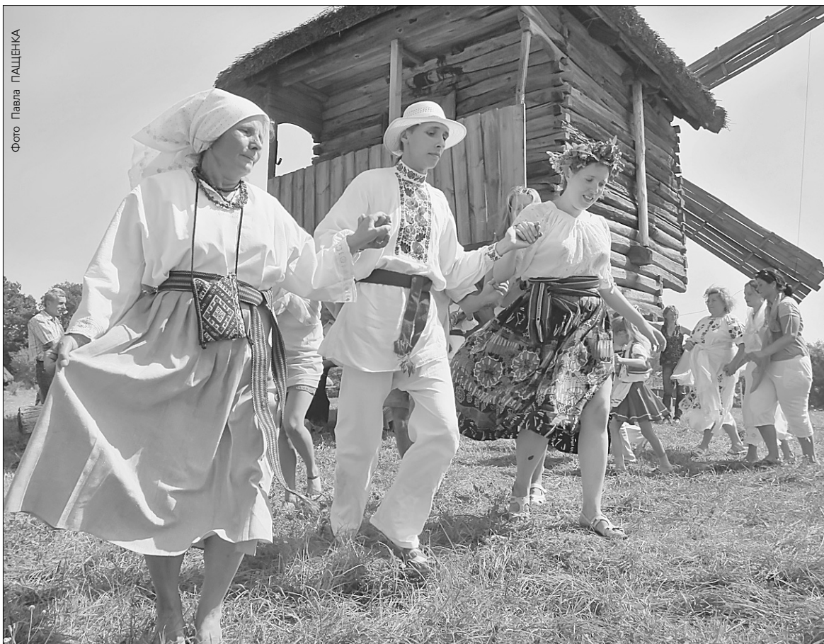
У Пирогові свято меду перетворили на народні гуляння

Гості також побували на "Ярмарку ідей", де було представлено технічні новинки вітчизняного бджільництва. Крім того, вперше за чотири роки у Пирогові провели Всеукраїнський медовий чемпіонат, де пасічники з різних регіонів змагалися у 33 номінаціях, дві з них — "Мед глядацьких симпатій" та "Медовий напій глядацьких симпатій" — "судили" не журі, а гості. Головою ж експертного журі став Норман Волш — всесвітньо відомий знавець природних ласощів, дворазовий володар Кубка світу з якості меду, кавалер ордена Британської Імперії. Розважальна програма також містила багато приємних сюрпризів для глядачів. Серед них: конкурс краси "Медова княгиня України-2008", концертна програма, що об'єднала фольклорні колективи з різних куточків України, богатирські ігри, майстер-класи народних умільців, давньоукраїнські танки та бойові мистецтва. Шанувальників цілощого продукту привітали зірки української естради Анатолій Матвійчук та Ірина Шинкарук. Завершилося ж святування Парадом хоругв українських бджолярських братств та запаленням найбільшої у світі воскової декоративної свічки — як пам'ять про жертви Голодомору 1932—33 років ●