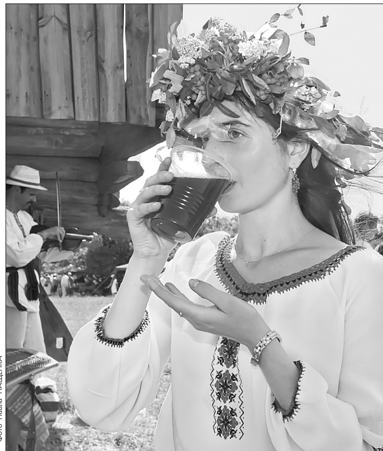
Втамувати спрагу можна справжньою медовою