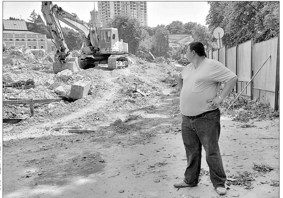
Стара будівля на Інститутській, 3, що заважала будівництву нового Музею історії міста, повністю знесена, очистити майданчик для початку робіт обіцяють до кінця тижня

Тим часом власники ділянки ТОВ «Історія міста» запевняють, що всі роботи