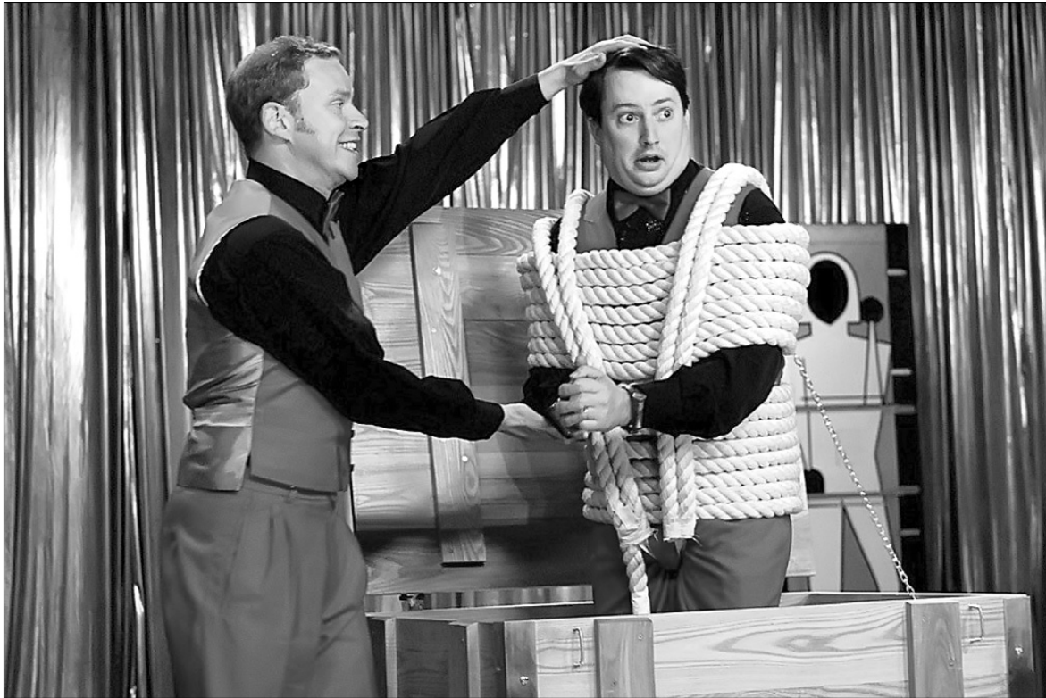
Зробивши ставку на комедійний дует Девіда Мітчелла та Роберта Уебба, режисер "Чарівників" Ендрю О'Коннор явно не прогадав

Завтра в український прокат виходить британська комедія Ендрю О'Коннора "Чарівники"