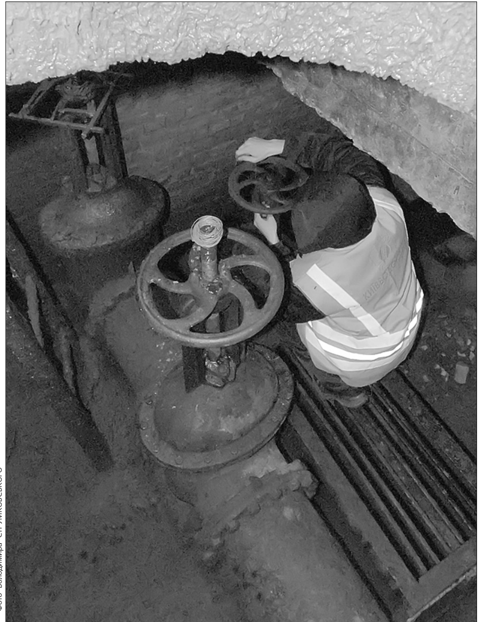
Через брак коштів на закупівлю реагентів для очищення води, “Київводоканал”, аби не поїти мешканців столиці брудною водою, планує вмикати її погодинно

Ще одним важливим питанням стало відшкодування ВАТ АК “Київводоканал” різниці між фактичною вартістю наданих ЖЕКам послуг з водопостачання та їх собівартістю. За розрахунками компанії,