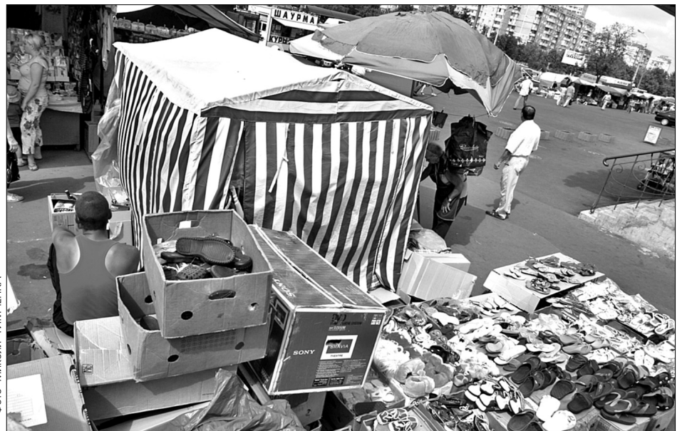
Однею з причин виселення ринку "Фестивальний" називають засміченість території, торговці запевняють, що все приберуть, аби лише з робочими місцями бути

У п'ятницю торговцям сказали, щоб звільнили ділянку. Термін закінчується