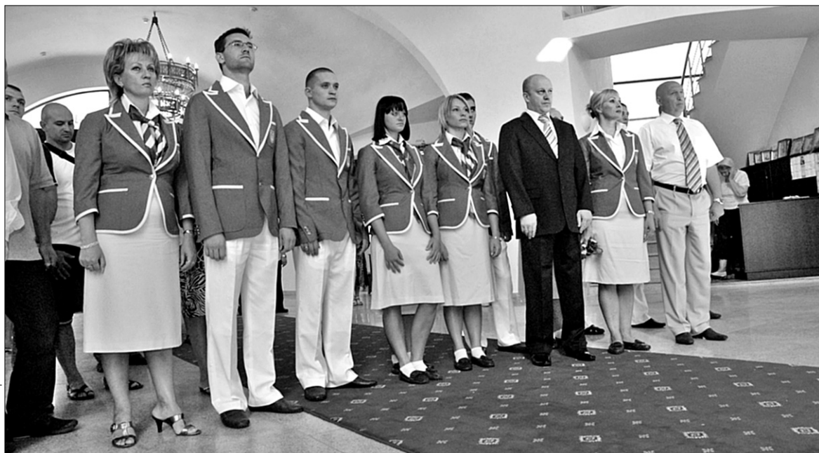
Команду олімпійських плавців благословили на золоті медалі у храмі Преображення Господнього у Голосіївському районі

Тим часом до скверу підїхали самі олімпійці. Коли вони в жовто-блакитних костюмах вийшли з авто, їх уже чекали телекамери, а головне, звичайні люди — їхні уболівальники. Плавці були трохи здивовані, розчулені, але радісні й горді. Усі пішли на молебень. “Перед змаганням не забудьте осінити себе хрестом, і Господь вам допоможе підкори-