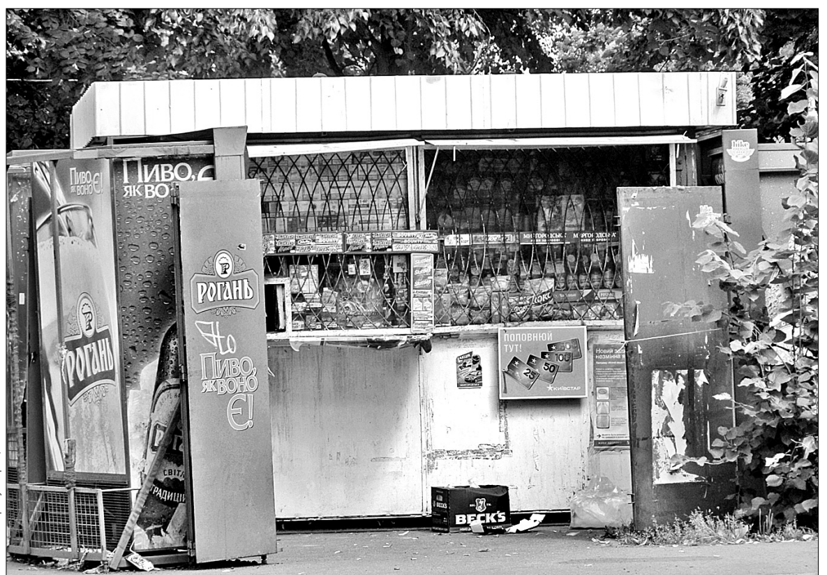
Кожна МАФ столиці отримає належну оцінку від киян та міської влади

У Дарниці такий кіоск знайшли на проспекті Бажана поряд