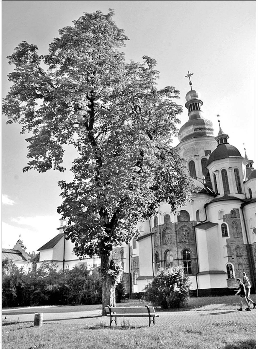
У Києві росте півсотні дерев — свідків історичних подій, які потребують не менш шанобливого ставлення, ніж пам'ятки архітектури

"Ми постійно взаємодіємо зі згаданою студентською організацією, і цього разу серед дерев-претендентів були саме вісім. Ми повинні охороняти їх, бо вони старі й уражені. А