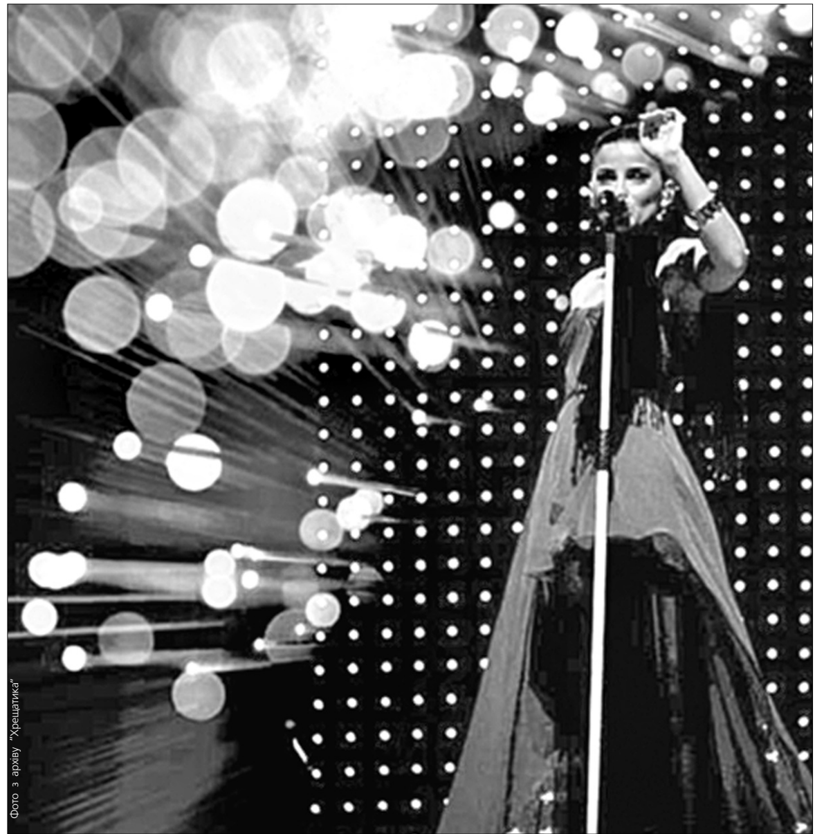
Неллі Фуртадо вирушила у світовий тур як справжня поп-діва

Співачка презентує в Києві альбом "Loose"