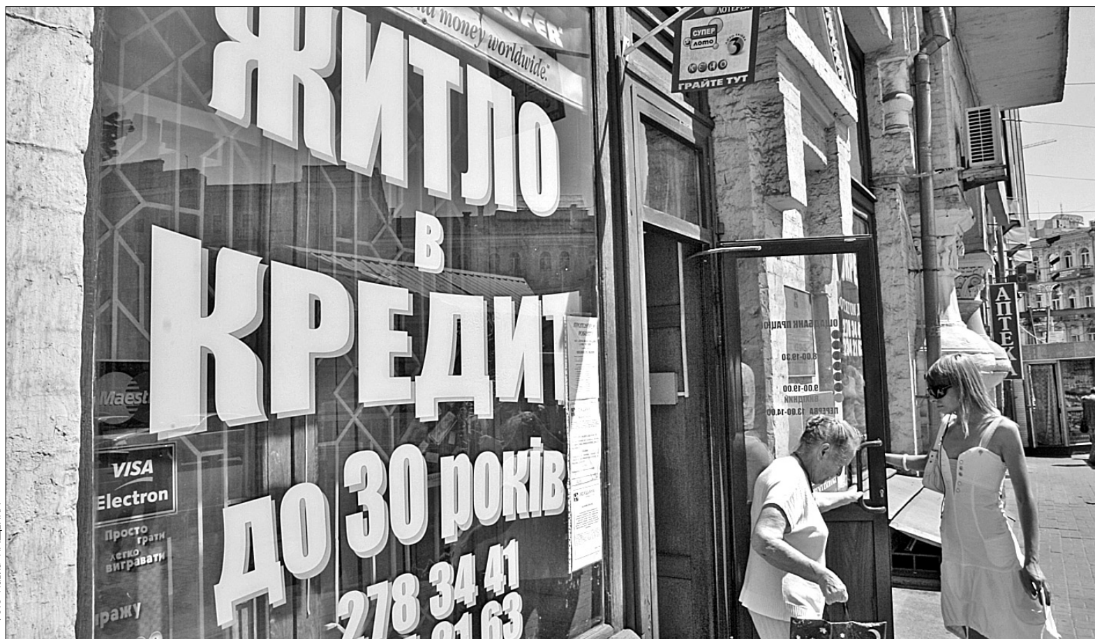
Банківський кредит в Україні нагадує лотерею — ніколи не знаєш, скільки платитимеш і до якого віку погасиш

В умовах жорсткої конкуренції банків споживачі стають жертва-