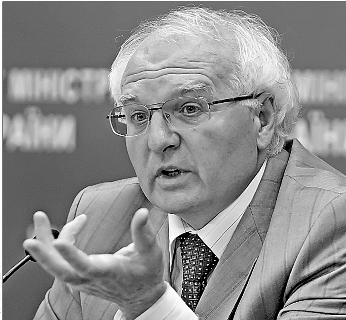
Іван Вакарчук визнав існування корупційних схем у вищих навчальних закладах

Натомість робоча група з підготовки концепції зовнішнього незалежного оцінювання пропонує боротися із свавіллям ректорів запровадженням прозорішої системи тестування. Учора голова робочої групи народний депутат Леся Оробець представляє механізм поліпшення умов вступу абітурієнтів до вишів. Уже з