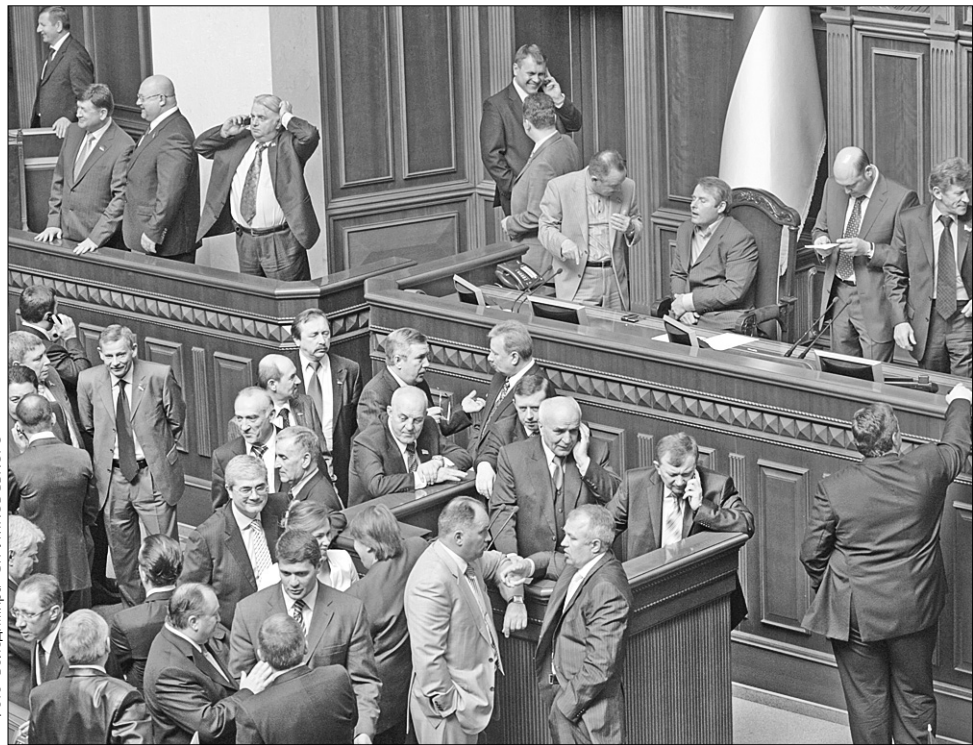
Дуже знайома картина в українській політиці