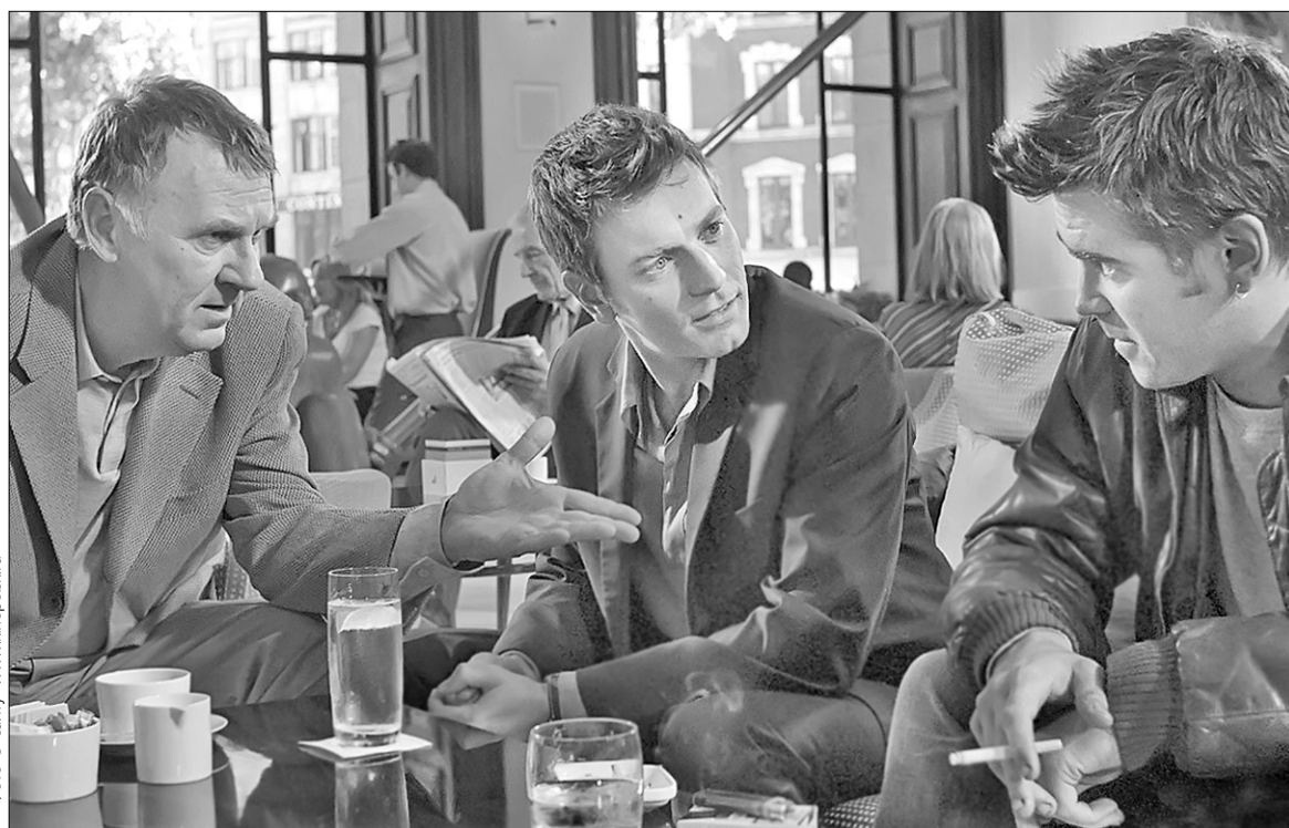
Своєю невтішністю чергова стрічка Вуді Аллена нагадує своєрідний режисерський заповіт

Офіційна прем'єра "Мрії Кассандри" відбулася на Венеціанському кінофестивалі торік у вересні. Стрічка завершує "британську трилогію" Вуді Аллена і є на диво невеселою. Адже за півстоліття плідної роботи в кіно режисер привчив свого глядача до іронічних життєствердних комедій. Саме вони принесли йому популярність. Однак, розмінявши восьмий десяток і перебравшись із Нью-Йорка до туманного Лондона, Аллен, здається, кардинально змінив стиль: почав знімати стрічки, присвячені холоднокровним убивствам і болісним сімейним трагедіям. "Дебютний" британський "Матч-пойнт" (2005) нагадував похмурі романи Федора Достоєвського. Думалося, що із "Сенсацією" (2006) повернеться колишня іронія: сумний античний мотив Царства мертвих перебував тут із "легковажною" інтригою про маніяка-аристократа. Намарно. Депресивна "Мрія Кассандри" — це ніби "Злочин і кара-2", та ще й з елементами давньогрецької трагедії.