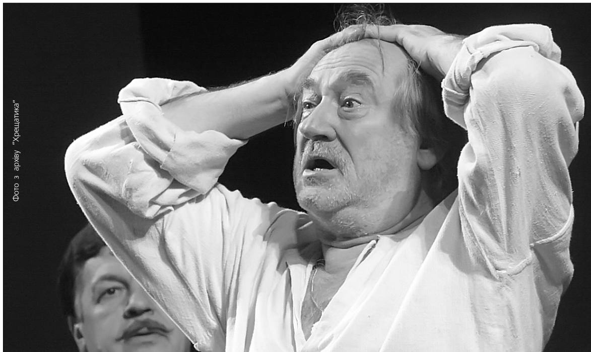
Секрет успіху Богдана Ступки в його таланті, і талані

Богдан Ступка найактивніше з усіх українських акторів знімається у "великому кіно"