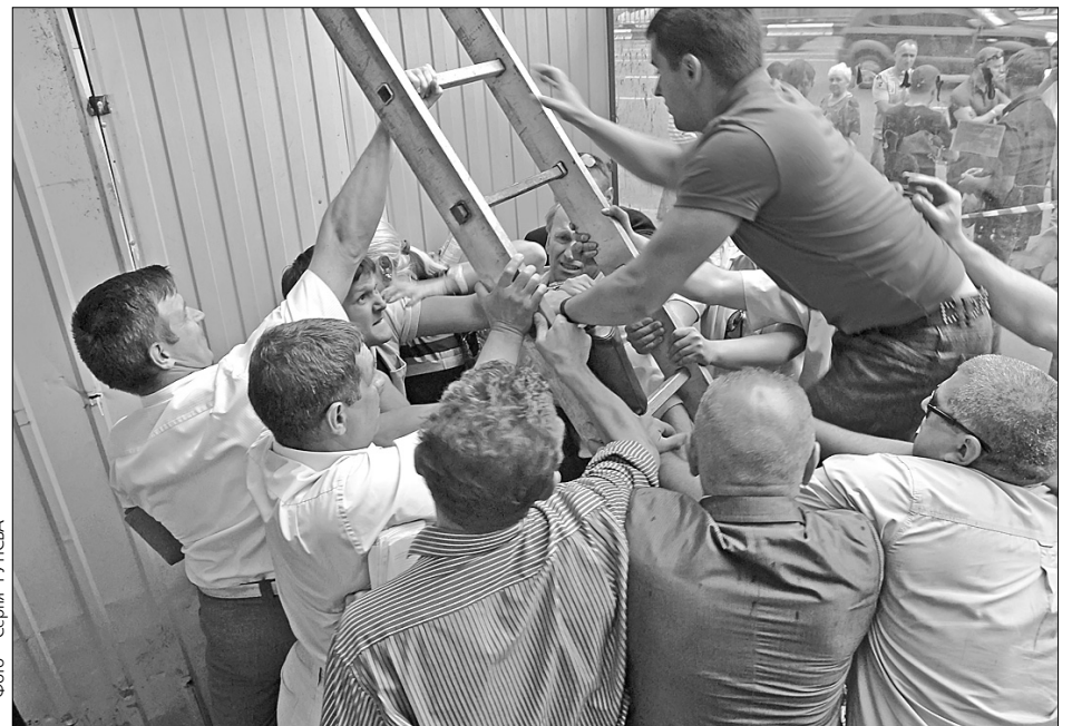
Під час демонтажу незаконно встановлених кіосків у районі станції метро "Шулявська" підприємці чинили шалений спротив

Про знесення кіосків їхніх власників попередили завчасно. Тому зранку поліціанти магазинчиків були вже порожні. Комісія одразу ж розпочала роботу. Спочатку демонтували два МАФі, у яких не знайшлося господаря. Коли ж дійшло до третього, з'явилася його власниця. Жінка відчайдушно стала на захист майна. Вона заявляла, що має всі дозволи і документи, які й продемонструвала комісії та журналістам. "Те, що ми бачимо, просте театр", — заявила володарка п'яти кіо-