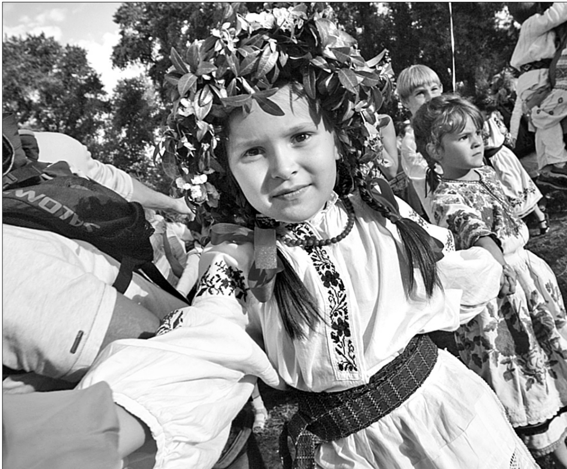
За народним звичаєм увечері проти Купала діти насилають купу піску, встромлюють у нього жмут кропиви і всі разом починають співати. Хлопець, що стоїть першим, повинен перестрибнути через Купало. За ним усі інші...