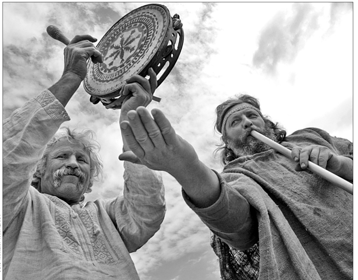
У Ржищеві можна не лише відпочити на березі Дніпра, а й полинути в атмосферу сивої давнини

Цьогоріч шанувальників історії зібрали на ще одне цікаве дійство — перший еко-культурний фестиваль "Трипільське коло", що відбувався у Ржищеві минулого місяця. Його культурну частину склали виступи численних фольклорних музичних колективів, виставка-ярмарок майстрів традиційних ремесел та кіноперегляди, а екологічну — проживання на природі, спортивні розваги та здоровий спосіб життя. Тут усіляко пропагували відмову від вживання алкогольних напоїв і цигарок. За задумкою організаторів, фестиваль мав показати, як діставати насолоду без будь-яких зовнішніх стимулів. Сучасним "трипільцям" запропонували долучитися до культурно-історичного надбання краю: проводили лекції та семінари, присвячені трипільській добі, а також влаштували толоку. За два дні волонтери і краєзнавці відтворювали оселю предків: одноповерховий будинок із дерева, соломи та лози. За кілька днів до фестивалю підготували заготовку у вигляді дерев'яного каркасу та стін. Очі вкривали дах соломою та займалися своєрідною глинотерапією — дружно місили глину ногами та обмазували стіни. Перший еко-культурний фестиваль "Трипільське коло" відбувся під знаком води. Надалі організатори обіцяють провести щонайменше три дійства такого формату, але з різною програмою. Так, наступного року заплановано фестиваль "Земля", ключовою тезою якого стане дбайливе ставлення до довкілля, а далі в хід підуть інші стихії — "Вогонь" з культом Сонця й Матері та "Повітря", присвячений проблемам глобального потепління ●