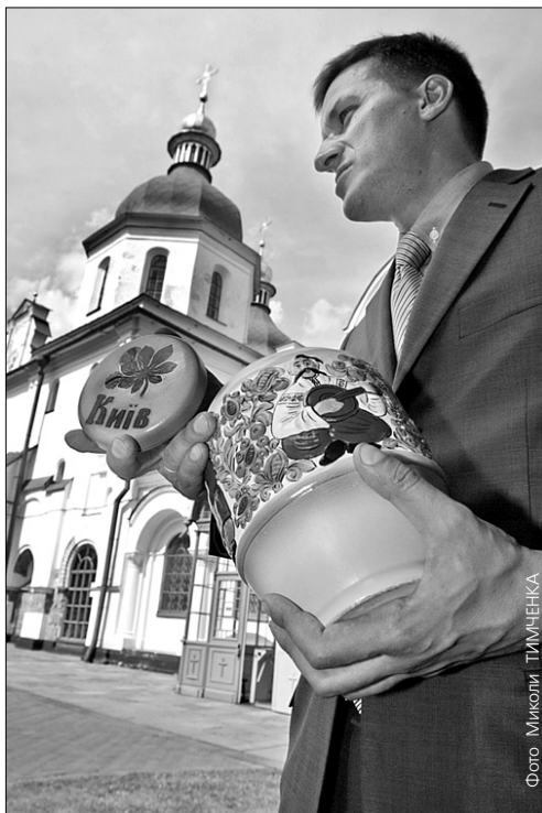
Колбу із землею, яку взяли під Софією Київською, відправлять на Алею національних символів, розташовану на вершині Говерли

На найвищій точці України облаштують Алею, де чільне місце відведуть подарунку від Софії Київської та майдану Незалежності