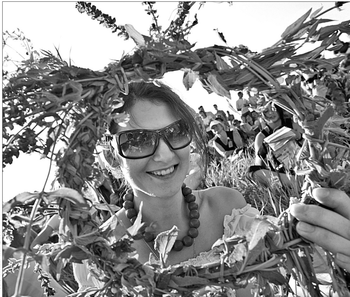
Шанувальників історії до міста щороку запрошують фестивалі "Ржищівський вінок" та "Трипільське коло"

Відомо, що цей край заселений людьми з давніх-давен. Археологічні знахідки перших по-