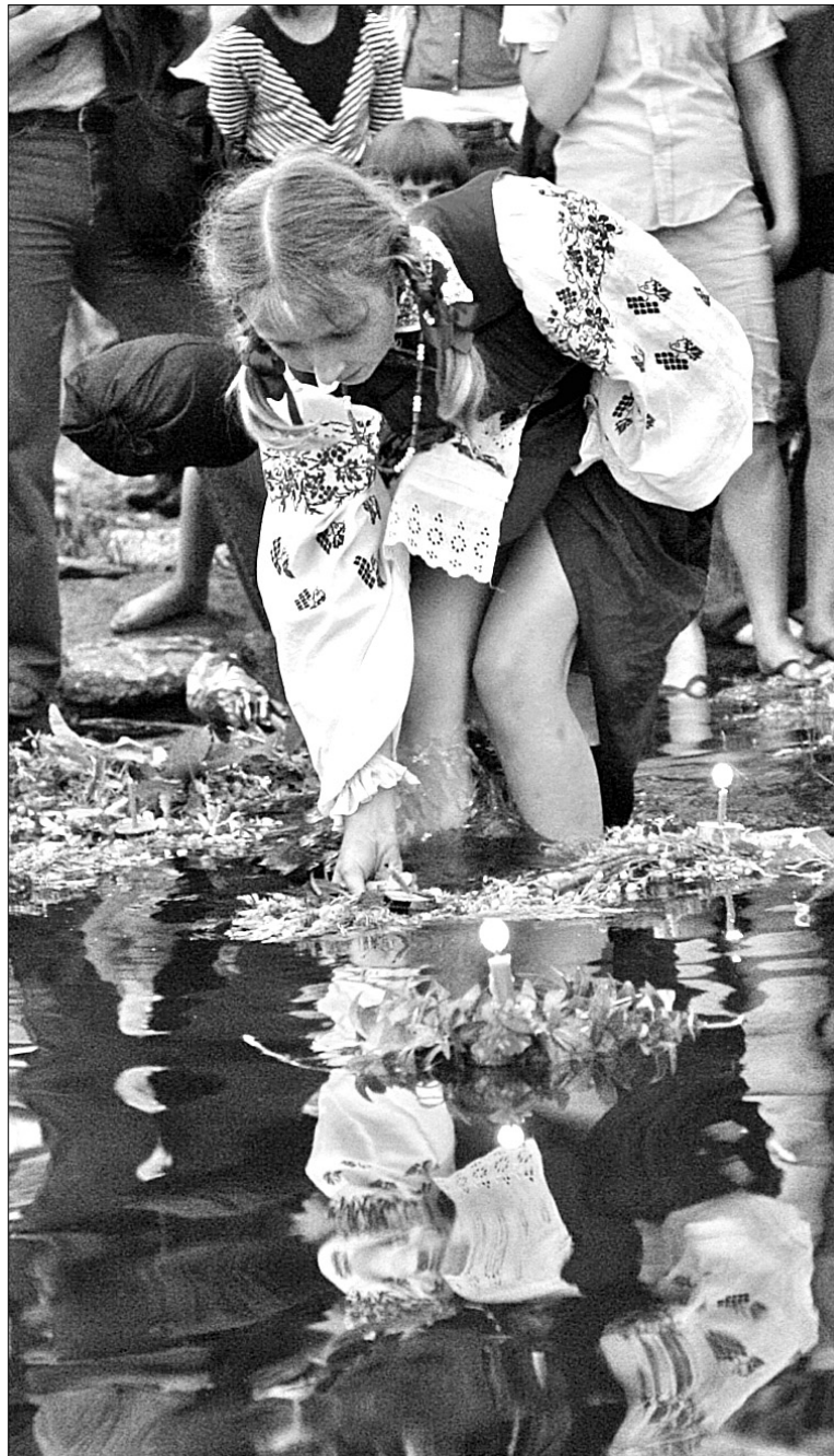
Після потоплення Купала дівчата пускають на воду вінки із запаленими свічками і співають. Якщо вінок пливе рівно і свічка не гасне, то знак, що дівка скоро піде заміж, коли крутиться на місці – ще дівуватиме. Якщо вінок запливе далеко і там пристане до берега, в той бік дівці й заміж їти