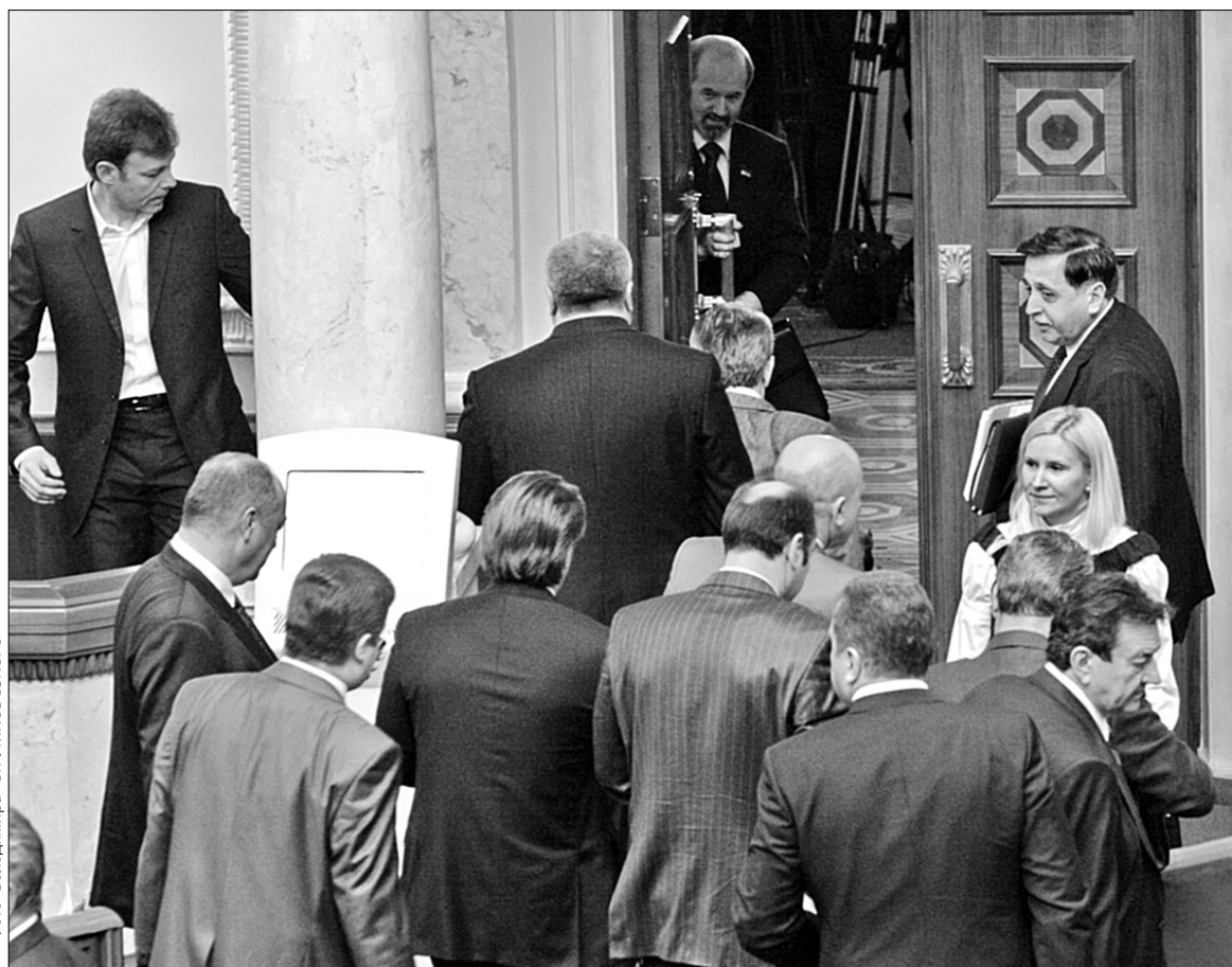
Уряду залишається сподіватись на те, що парламент піде на канікули. На економіку сподіватись уже пізно

20 червня повним складом фракція Партії регіонів у Верховній Раді України внесла на розгляд народних депутатів України проект постанови "Про відповідальність Кабінету Міністрів України". Цим проектом передбачено зокрема і прийняття вотуму недовіри уряду Юлії Тимошенко. Як з'ясував "Хрещатик", потрібні 226 голосів цілком можуть знайтися. Адже після поразки, якої БЮТ зазнав від Леоніда Черновецького, український політикум розуміє: популізму буде покладено край. "Ми хочемо заслухати урядовий звіт, бо не розуміємо, що відбувається в країні. До 1 березня мали бути зміни до бюджету —