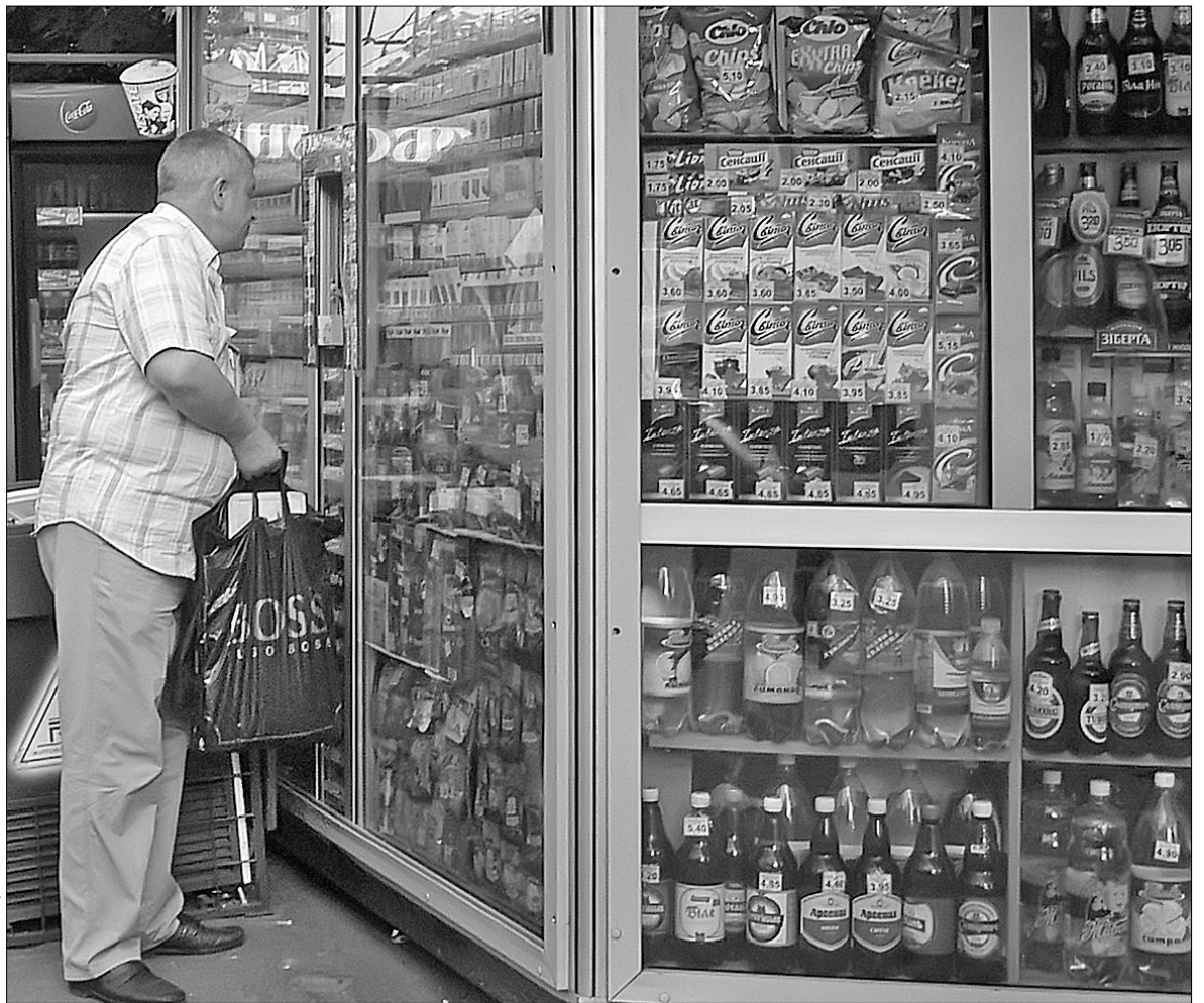
Купуючи солодкі води, мало хто з киян задумується, з чого їх виготовляють, тим часом деякі виробники використовують досить небезпечні домішки

Виробники своєю чергою коментували наявність таких добавок у своєму товарі навідріз відмовлялися. В "Оболоні", наприклад, головний технолог дуже занепокоїлася, коли сказали, що телефонують із газети. У "Росинці" весь час перенаправляли до різних спеціалістів і вигадували різноманітні виправдання ●