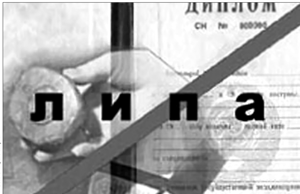
Міносвіти створило спеціальний сайт, на якому можна перевірити, чи зареєстрований диплом у відповідному ВНЗ

Попри безкарність, зайвої реклами такі "фахівці" не люблять. Зазвичай на сайті,