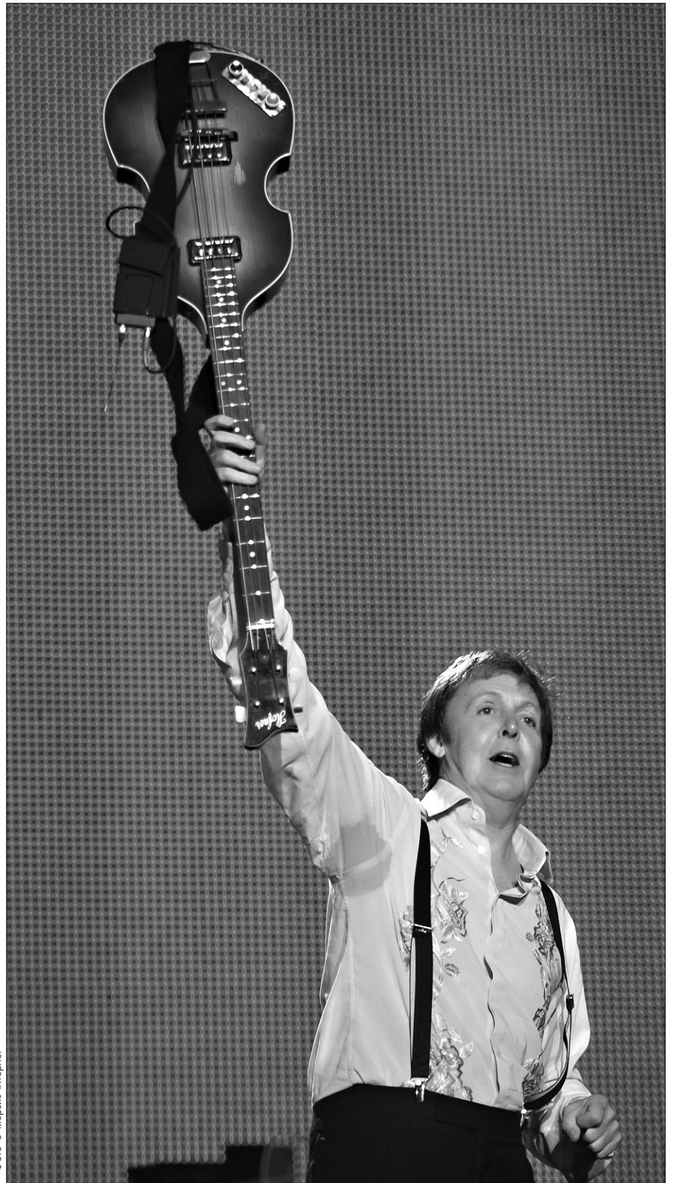
Пол Маккартні радував українців своїми піснями на майдані Незалежності дві з половиною години

Сера Пола Маккартні у Фонді Віктора Пінчука вирішили використати як-