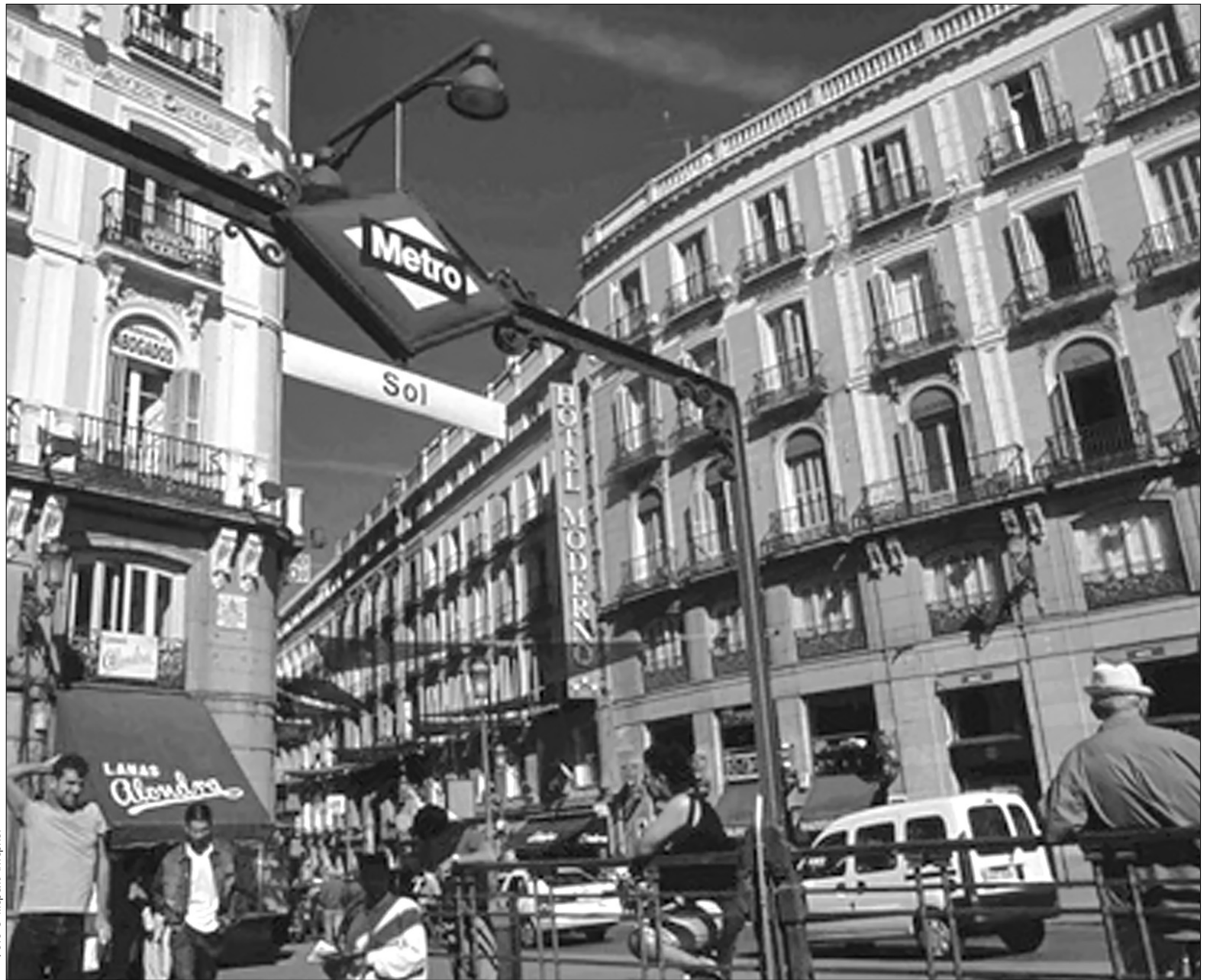
Мадрид нарешті став популярнішим за Канарські острови

Згідно з новим законодавством, яке набере чинності в кінці цього року, в багатьох провінціях, таких як Онтаріо та Квебек, тютюнові кіоски зможуть продавати сигарети, але їм заборонено буде виставляти їх на вітрині. Влада провінцій хоче, аби тютюн став не таким звичним і доступ-