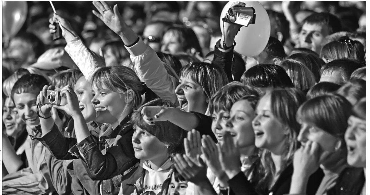
Фестиваль “Чайка”, що проводиться на однойменному аеродромі під Києвом, завше збирає багатотисячні натовпи драйвової столичної молоді

Альтернативу року в червні пропонує фестиваль Олега Скрипки “Країна мрій”. Він відбуватиметься на Співочому полі раніше — 21-22 червня, адже цьогоріч концепція народного свята прив'язана до часу сонцестояння (“середоліта”), а фестивалний репертуар буде насичений купальською тематикою. Організатори проголошують “Країну мрій” міжнародним народознавчим дійством. Свою співочу майстерність на ньому продемонструють кобзарі та самодіяльні колективи, а також гурти Karavan Fa-