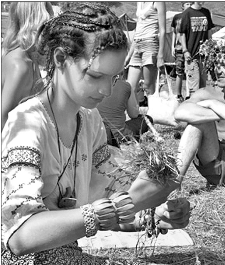
“Шешори”, як і карпатські, так і подільські, традиційно пропонують розмаїття майстер-класів, особливо гості полюбляють плести ляльки-мотанки

Оксамитовий музичний сезон у Криму відкриє п'ятий фестиваль “Джаз-Коктебель”, що відбудеться з 19 до 21 вересня. До Коктебеля дістатися можна з Феодосії чи Сімферополя, а оселитися в численних пансіонатах та приватних готелях (вартість від 50 гривень на добу). На східному коктебельському узбережжі, з якого відкривається чудовий краєвид на гору Карадаг, можна поставити і намети. Цього року організатори фестивалю обіцяють порадувати меломанів живими виступами легендарних Archie Shepp Quartet and Mina Agossi, Richard Galliano and Tangaria Quartet, Geoffrey Ogueta&Insight. Цікавинкою стане і проект “Пушкін джаз”: читання чернеток Олександра Пушкіна під фрі-джазовий акомпанемент квартету в складі Олександра Александрова, Володимира Волкова, Юрія Парфьонова та Володимира Тарасова ●