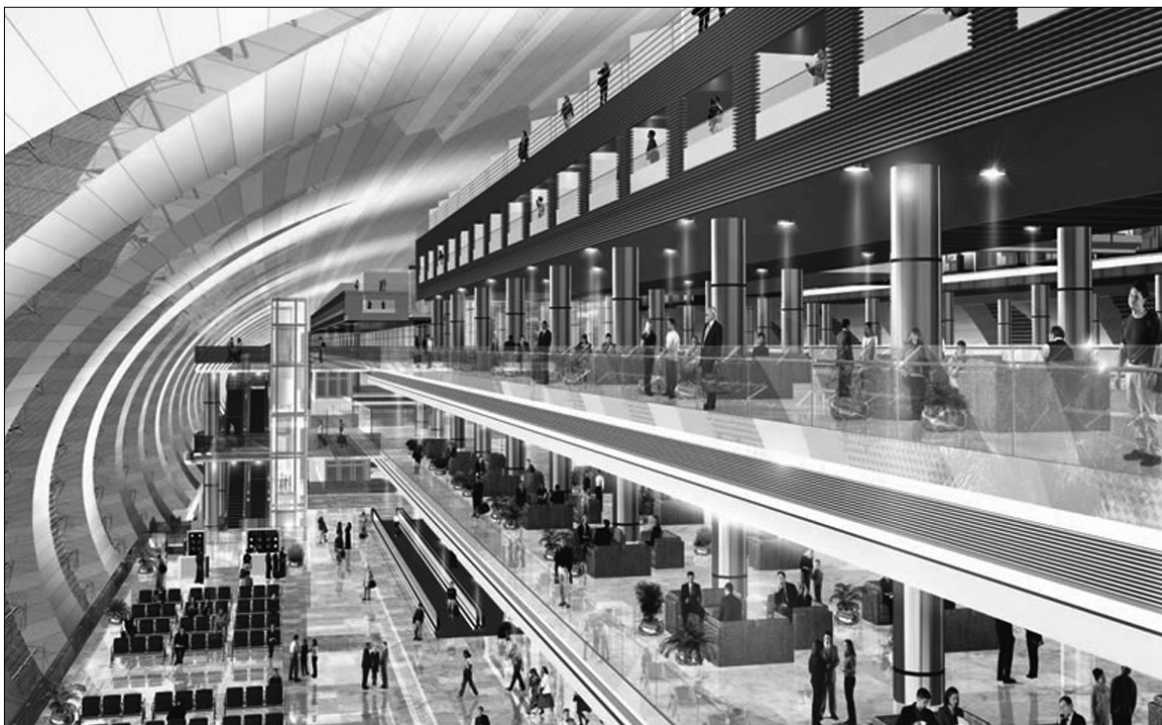
Дубайський аеропорт готовий надавати свої послуги не лише багатіям

У Берні ж уболівальникам наразі пропонують лише передмістя. Вільні номери в готелях є лише для тих, хто планує свій приїзд після 17 червня. У Цюріху готельні номери ще є. Про всяк випадок, для тих, хто не встигне, — можна звернути свою увагу на спеціальні автопаркінги для ночівлі або, знову ж таки, — табори фанатів. У Женеві також ще залишилися незаброньовані номери. До послуг уболівальників — села фанатів, приватні квартири, молодіжні турбази та кемпінги ●