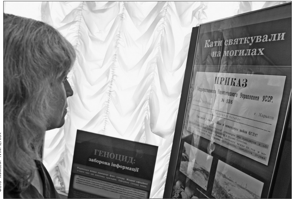
У Деснянській адміністрації виставили стенди із забороненою раніше інформацією про Голодомор в Україні 1932—1933 років

"Сьогодні в цьому залі відбувається не просто формальність. Це біль наших сердець, українського народу. Біль матерів, які хоронили своїх дітей, та дітей, які бачили смерть своїх батьків. І дуже символічно, що їхню пам'ять ми вшановуємо саме сьогодні, у день Вознесіння Господ-