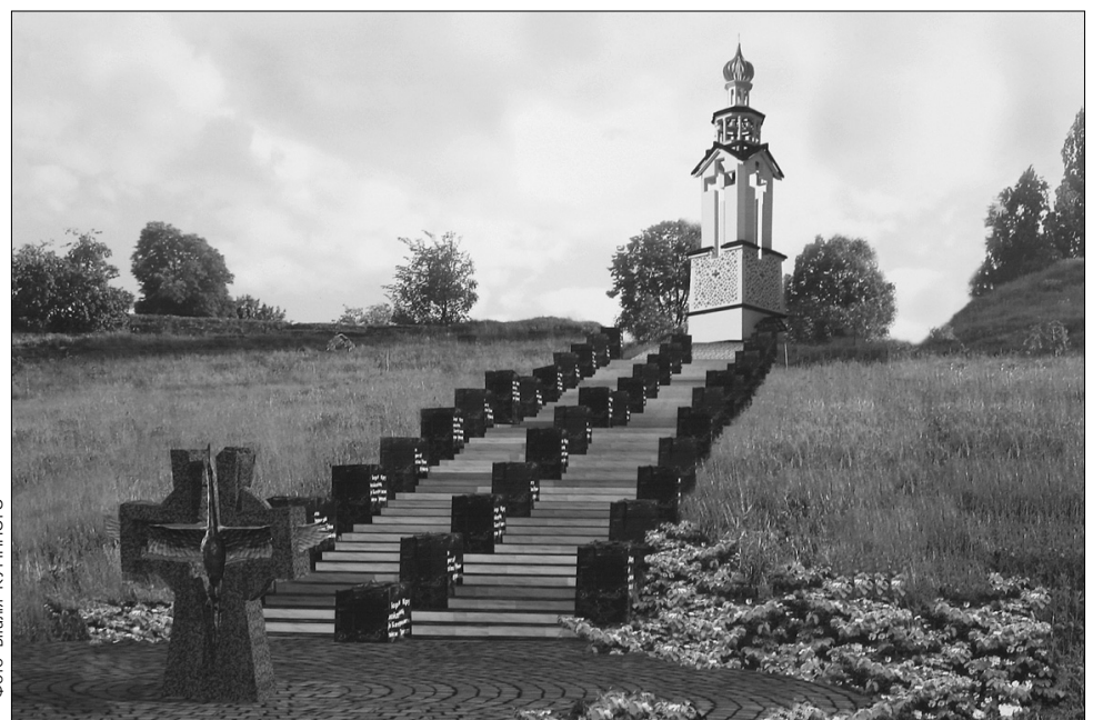
Восени в столиці вшануватимуть пам'ять жертв Голодомору біля нової дзвіниці на печерських схилах — першого об'єкта майбутнього меморіального комплексу

Він додав, що перша черга передбачає спорудження центральної меморіальної площі для проведення масових заходів, пам'ятного знака, дзвіниці та залу пам'яті. Окрім цього, зведуть кілька підірних стін та штолень. Пан Ковильов розповів, що скульптурну композицію комплексу становитимуть зображення янголів та дівчинки серед колоскового поля.