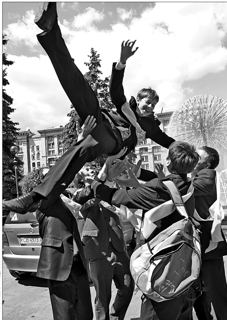
Майбутній пілот бере першу висоту

У напутніх словах учителів і батьків — гордість за учнівську молодь і водночас тривога за те, як складеться їхнє життя. Адже в той час, як випускники у піднесеному настрої фотографувалися, обмінюючись враженнями від свята та складаючи плани на предмет подальшого відпочинку, батьки й учителі обговорювали майбутні вступні випробування. Отримані напередодні свята "конверти-сюрпризи" від Всеукраїнського центру незалежного зовнішнього оцінювання знань здивували як самих учнів, так і їхніх учителів та батьків. Хоча це дивно, та позитивні результати тестування переважно показали слабо підготовлені школярі, які у тестах просто "вгадували" відповіді. Багато ж успішних учнів тепер планують подавати апеляції, бо підозрюють, що сталися помилки під час обробки тестових завдань комп'ютером. Та, попри деяку стурбованість