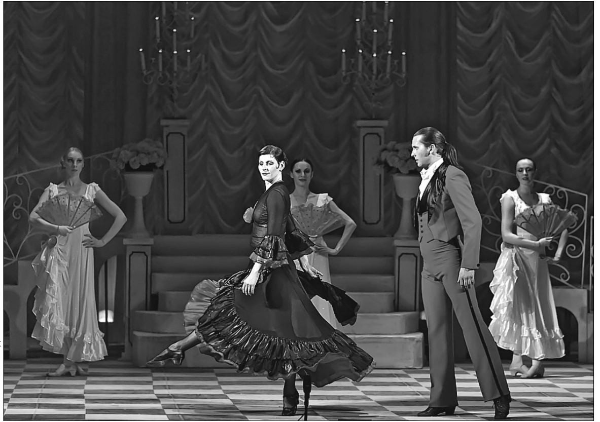
Не підтанцювати під запальні мелодії та ритми на концерті у Київській опереті було просто неможливо

Щоправда, організатори вирішили славу оперети розділити з оперою (за словами пана Струтинського, цілком ймовірно, що через якийсь час на сцені київської оперети з'являться й повноцінні оперні постановки). Тому все перше відділення гала-концерту українські та литовські артисти по черзі співали відомі арії з опер Россіні, Верді, Бізе та Гуно, а в другому — дали волю солодким, як халва, мелодіям західноєвропейських класиків оперети.