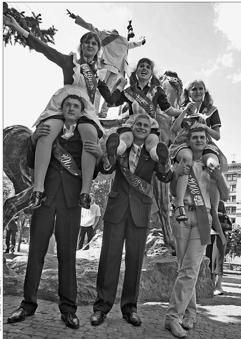
Головна задача жінки — сісти чоловікові на шию

Зокрема, випускників з нагоди свята привітав і заступник голови КМДА Віталій Журавський, який відвідав одну із столичних шкіл. "Цей рік у житті 22 тисяч київських випускників — один із найвідповідальніших, адже останній дзвінок у школі — це водночас і перший дзвінок дорослого життя для кожного. Знайте, Києву потрібні ваші знання, розум, відданість і чесність. Саме вам творити майбутнє столиці, і ми віримо у ваші здібності, наполегливість та сумлінність. Тож я переконаний, що в майбутньому ми будемо колегами. Наші двері завжди відчинені для вас. Хочу також подякувати учителям, які вклали в своїх вихованців усю душу, глибоку мудрість, чуйність, самовідданість", — наголосив