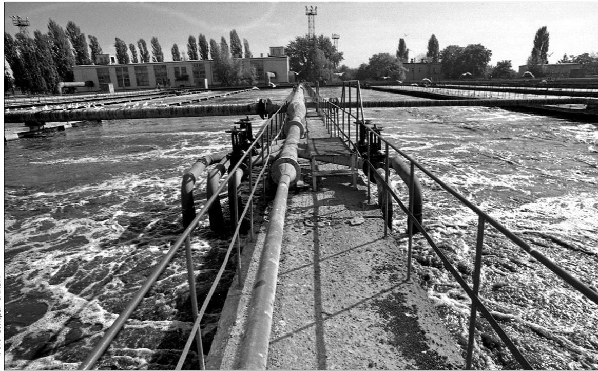
Для реконструкції Бортницької станції аерації потрібно 400 млн євро. Першу чергу робіт планують завершити до Євро-2012

Система забезпечення Києва водою вичерпала свій ресурс. Такі результати тримісячної перевірки ВАТ "Київводоканалу" оприлюднила минулого четверга комісія Міністерства ЖКГ. Вісімдесят відсотків водопровідних