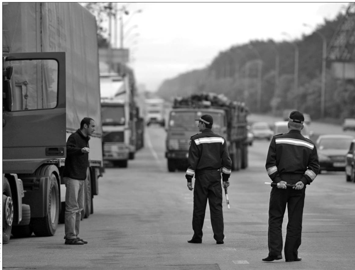
Побачивши автоінспекторів з жезлами, водії вантажівок одразу звертали на узбіччя, бо про обмеження в'їзду в столицю вони знали давно

За 15 хвилин на обочині зупинилося сім вантажівок. Одна з них завантажена деревом. "Он люди їдуть на роботу. А мені не можна? Я ж теж на роботі, щоб