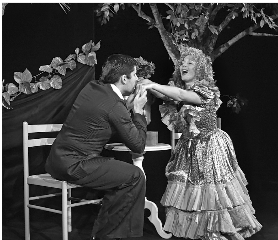
Публіка з легкістю впізнавала музичні й театральні номери з найяскравіших сцен репертуарних вистав

А втім, публіка йде в "Колесо" не по мистецьку несподіванку чи провокацію, а повноцінний відпочинок. Тому тут з успіхом відбуваються по-театральному яскраві вистави, такі, зокрема, як костюмовані "Жінки Моцарта" Міттерера про інтриги й кохання видатного композитора, музичні водевілі "Колишні справи" Нестроя і "Пристрасті дому пана Г.-П." за Оленою Пчілкою чи розіграш для театралів "Скандал з публікою" Хандке. Що спільного між цими виставами? Стилiзовані під ту чи ту епоху кос-