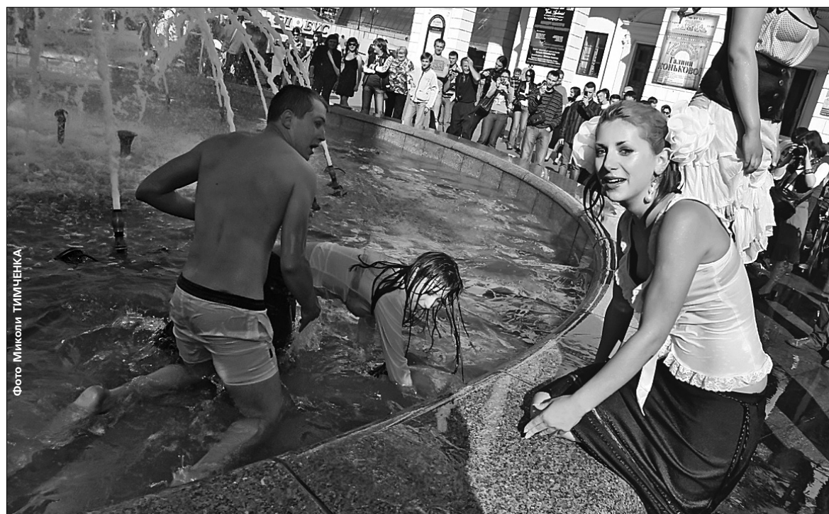
Після гарячих танців не гріх охолотитися

ник безробіття. Крім того, у Києві найвищий рівень освіти. Тож учнівська молодь зможе гідно реалізувати себе ●