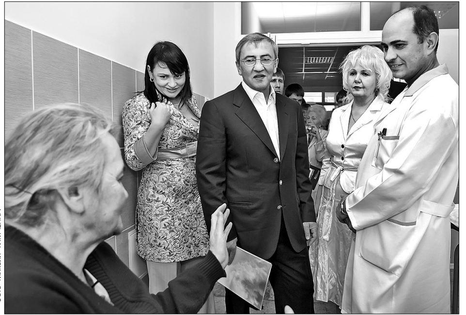
Леонід Черновецький заповнив, що у відремонтованій лікарні "Швидкої допомоги" усіх киян прийматимуть на рівні VIP-персон

"Я жодного разу не лікувався у спеціалізованих клініках. Знаю головного ліка-