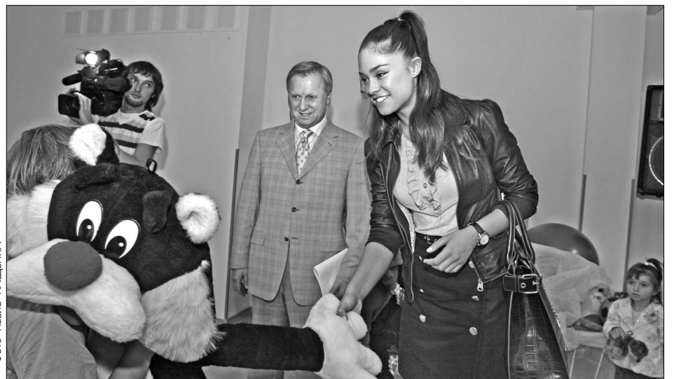
Переможниця "Міс-Україна-2008" Ірина Журавська подала руку ВІЛ-інфікованим дітям та пообіцяла займатися з ними малюванням і хореографією

"Міс Україна-2008" Ірина Журавська. "Я з великою радістю візьму шефство над закладом. Регулярно проводитиму тут заняття. Думаю, розпочнемо вже за тиждень", — сказала пані Журавська. Вона займатиметься з дітьми хореографією та малюванням.