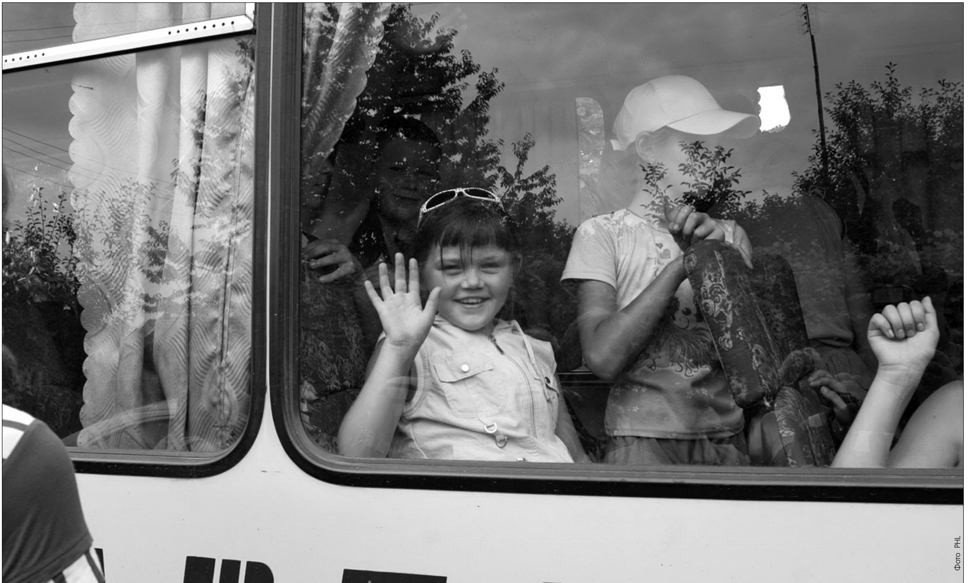
Перша група столичних дітлахів попрощалася зі школою та відправилася на відпочинок у літній табір, що у містечку Буча під Києвом

Столичних дітей почали відправляти у літні табори