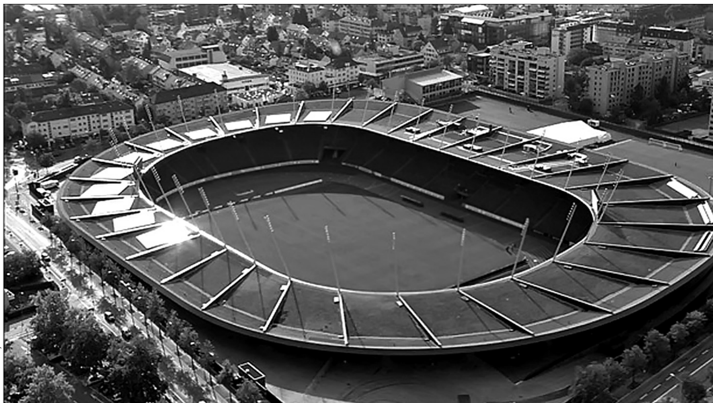
У Цюриху спеціально до Євро-2008 звели новий стадіон

До Євро-2008 у Женеві побудували Стад-де-Женев. Це новий багатифункціональний стадіон, де грає місцевий "Серветт". Сучасний 30-тисячний розташований у районі Ля-Прей, неподалік французького кордону. Проект стадіону розробляли у співпраці з УЄФА. Арена сполучена із системою женецького громад-