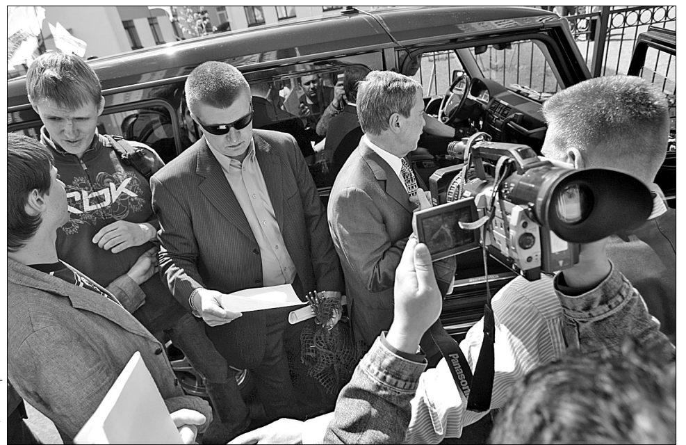
Хто саме отримав повістку, можуть побачити і читачі "Хрещатики"

він звернувся до прокуратури для того, щоб показати приклад громадянам України, як захищати свою честь і гідність від міліцейського свавілля та провокацій. "Я прошу киян не вірити провокаторам від політики, навіть якщо вони носять державну міліцейську форму. На своєму прикладі я покажу киянам і всім громадянам України, як захищати власну честь і гідність від міліцейського свавілля і провокацій. І цю справу я доведу до кінця", — заявив Леонід Черновецький.