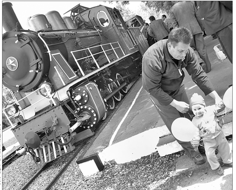
Покататися на дитячій залізниці у Сирецькому парку можна буде до серпня

"Тема не змінилася — знесення "Троїцького", — такими словами розпочав учорашню нараду з підготовки столиці до Євро-2012 перший заступник голови КМДА Анатолій Голубченко. 25 травня з черговою перевіркою до Києва приїдуть інспектори УЄФА. Тим часом, якщо готелі, медичні заклади та транспорт готують "повним ходом", питання демонтажу торговельно-розважального центру "Троїцький" загальмувано. За три місяці з цього приводу відбулося 14 нарад, однак практичних результатів вони так і не дали.