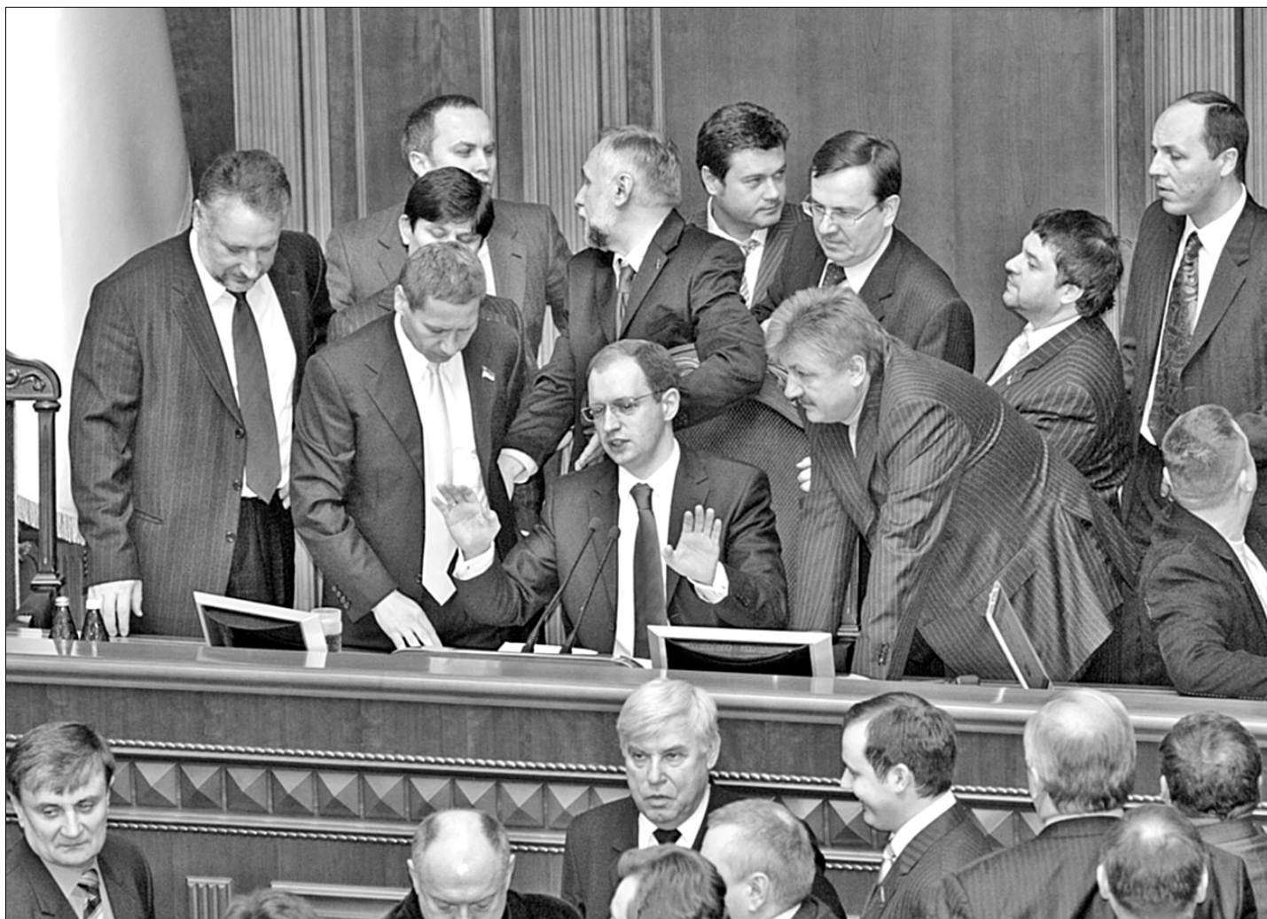
Заблокована трибуна може стати візитівкою нинішнього парламенту

Довіра до преси нині дуже висока. І руйнувати цю довіру політикам украї не вигідно. Тому що вони отримують згортання свободи слова та повернення до старих часів, коли у нас були проблеми з цією сферою. Видання не мають бути хлопчиками для биття. Засоби масової інформації мають бути поза розбірками політиків. Подання позову — це передвиборний крок. Але звинувачувати ЗМІ — це крок хибний. Олександр Турчинов отримає від цього лише мінуси. Адже такі дії можуть негативно позначитися на його іміджі, рейтингу та рейтингу його політичної сили. Політикам варто пам'ятати, що будь-які судові позови проти ЗМІ завжди б'ють негативно по тих, хто є їхнім ініціатором •