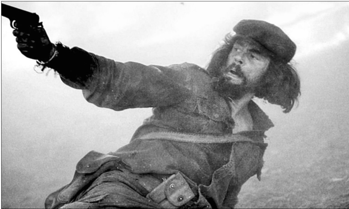
Картини Стівена Содерберга про Че Гевару пророкують "Золоту пальмову гілку" на фестивалі в Канні

У Канні розпочинається бійка за кінонагороди