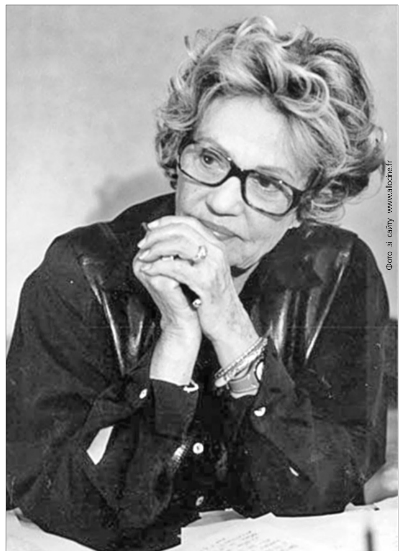
В 60-річну кар'єру Жанни Моро вписано всю історію Каннського фестивалю

Канн — не тільки найбільший у світі кіноринок, а й головний прем'єрний майданчик. Заради вечірніх показів стелється червона доріжка, актриси влаштовують парад мод, а численні фото-