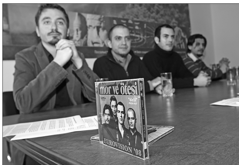
Турецький рок-гурт Mor ve Otesi збирається підкорити Європу якісним живим виконанням ліричної балади “Божевільний”

Цього року демонструвати музичний потенціал Туреччини будуть не солодкоголосі дівчата чи драйвові співаки на кшталт Таркана, а справжній рок-гурт. Так вирішила Турецька телерадіокомпанія і запропонувала на вибір телеглядачам три пісні колективу Mor ve Otesi. Зрештою переможницею визнано ліричну композицію Deli, що у перекладі