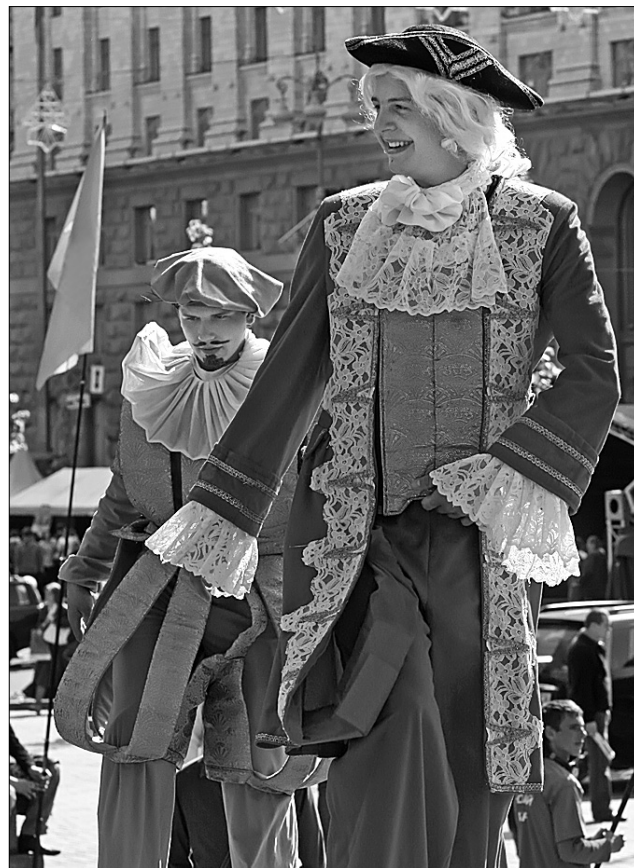
День Європи у столиці став велелюдним святом

віртуозних танцюристів під музику австрійських класиків, переглядали відеофільми про історичні місця, архітектуру та мистецтво різних народів. Маленькі кияни залюбки бралися за олівці, аби взяти участь у конкурсі малюнків, присвяченому 400-річчю від дня народження Дон Кіхота. Кожне диппредставництво намагалося показати свою країну якнайповніше. Австрійські музиканти грали менуети. А чимало охочих штурмували столицю, щоб посмакувати справжню віденську каву. Англійський намет зустрічав шотландськими мелодіями. Данія пропонувала познайомитися з її кухнею, народними танцями та співами. Великобританія розповідала про можливо-