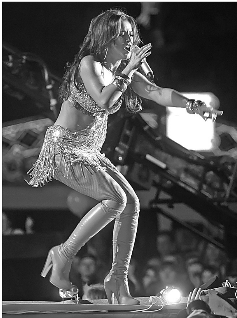
Українська поп-дива Ані Лорак на Євробаченні у Белграді просто “виблискуватиме”. З собою на конкурс співачка везе чотири валізи прикрас

Підготовці до конкурсу передували виступи Ані Лорак у 15 країнах Європи: шукала підтримки слухачів та визначала смаки європейської публіки в Болгарії, Іспанії, Греції, Швеції, Великій Британії. Привернути увагу до власної персони співачка збирається і доброчинністю. У 2004 році ООН надала їй офіційний статус Посла Доброї Волі з питань ВІЛ/СНІДу в Україні, а з 2005-го має орден Святого Станіслава IV ступеня з Офіцерським Хрестом за підтримку ВІЛ-інфікованих громадян України. Перебуваючи у Бельгії, Ані Лорак підписала угоду з організацією “Дизайнери проти СНІДу” на виго-