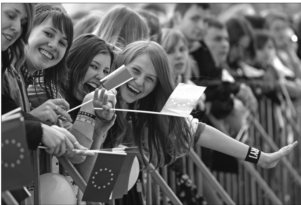
Кияни вірять у європейське майбутнє України

Учора в Києві відзначили День Європи. Над Майданом замайорили два прапори — український та Євросоюзу, а в небо злетіли п'ять тисяч блакитних кульок з двадцятьма сімома золотими зірками — символами країн-членів ЄС. Центром святкування стало Європейське містечко, де кияни та гості могли подискутувати на тему міжкультурного діалогу, покуштувати страви європейської кухні та вивчити кілька фраз іноземною мовою. Завершився День Європи грандіозним рок-концертом та феєрверком.