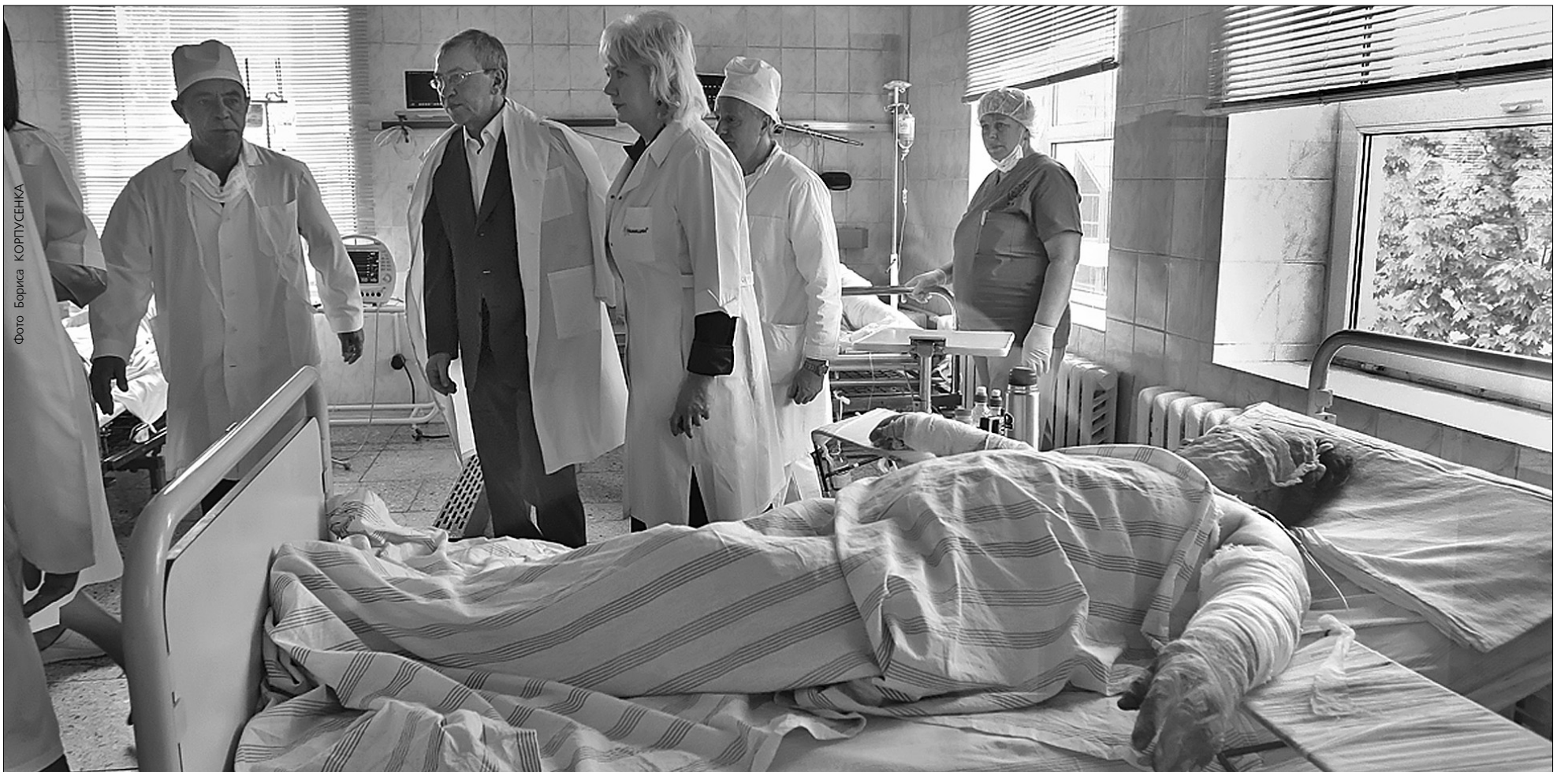
Леонід Черновецький відвідав постраждалих від вибуху кіоску з шаурмою, які перебувають в опіковому відділенні міської клінічної лікарні № 2. Мер пообіцяв допомогти людям та закрити всі незаконні кіоски

Незаконні кіоски в місті закриють найближчими днями