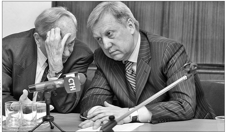
Останній президент УНР в екзилі Микола Плав'юк пообіцяв передати до нового музею експонати з власної колекції. А заступник голови КМДА Віталій Журавський запевнив, що столична влада відремонтує приміщення

Місцерозташування вибрали не випадково. Нинішній Будинок учителя колись належав Українській Центральній Раді. Саме тут свого часу працював новостворений український уряд. Місце історично вважають початком української державності. "Я страшенно радію, бо музей стане наступним кроком до створення передумови для того, щоб знати минуле. Це для українців