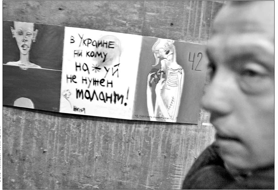
Молодому мистецтву на Гогольфесті знайшлося місце в кутку

Вигляд такий, як у звичайної презентації галерей на арт-салоні. У кожному нефі центральній анфіладі розмістилося по галереї — загалом вийшло дванадцять цілком традиційних виставкових циклів. Те, що існує поза галереями, тобто живопис молодих нахаб разом із відеопрое-