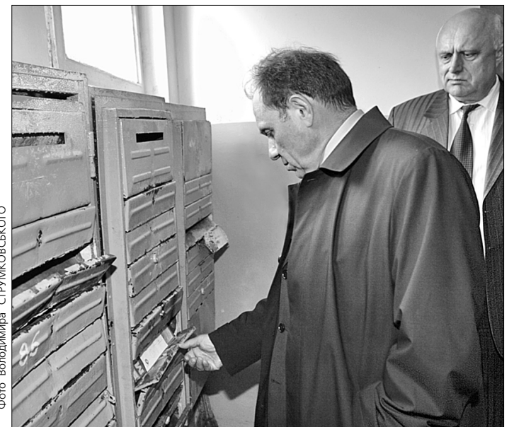
Заступник голови КМДА Анатолій Голубченко полаяв комунальників за неякісний ремонт будинків на вул. Малиновського, що в Оболонському районі, та дав два тижні, аби виправитися

Схожу картину спостерігали і в будинку на вул. Малиновського, 15/3. Піднялися на п'ять поверхів, і на всіх не було лам-