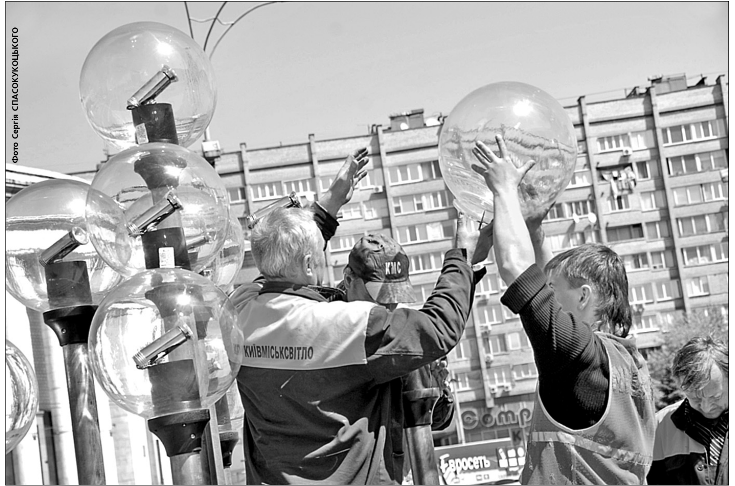
Стела Перемоги на однойменній площі засвітиться по-новому до кінця тижня. Учора біля монументу встановили сучасні ліхтарі

У місті впроваджують нове підсвічування історичних пам'яток