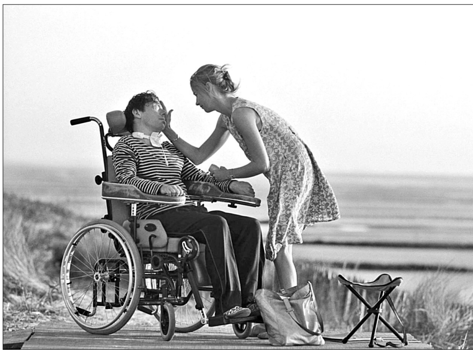
На половині дороги між небуттям та літературою побачити героєві Матьє Амальріка вдається чимало цікавого

Найзахопливіша частина фільму — перші хвилини п'ятнадцять, коли глядач занурюють у черепну коробку головного героя, що перетворився, власне, на однооку веб-камеру (друге око, яке розумілося кліпати, лікарі швидко зашили через непотрібність). Звісно, з усіх увічнених на екрані людських хвороб параліч з оком, що підморгує, особливо цікавий для кіно. Нерухоме тіло з кліпаючим отвором — напролюд точна алегорія стрекотливої кіно-