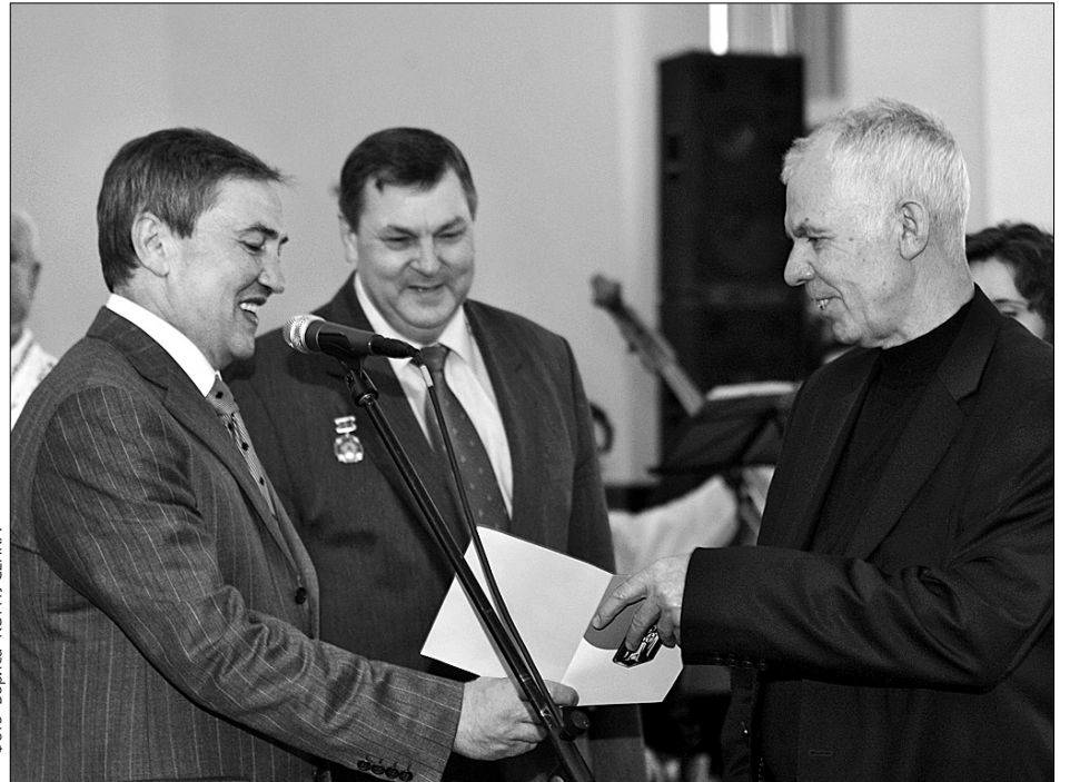
Напередодні 22-ї річниці чорнобильської трагедії мер Леонід Черновецький вручив ордери на квартири 16 родинам постраждалих від наслідків аварії

наразі лише у Києві, на відміну від інших міст, реально здійснюють програми для чорнобильців. “Усе це має фінансувати держава. Але вона через часту зміну уряду, на жаль, не в змозі цього робити. Київ узяв відповідальність за всю Україну”, — сказав мер столиці.