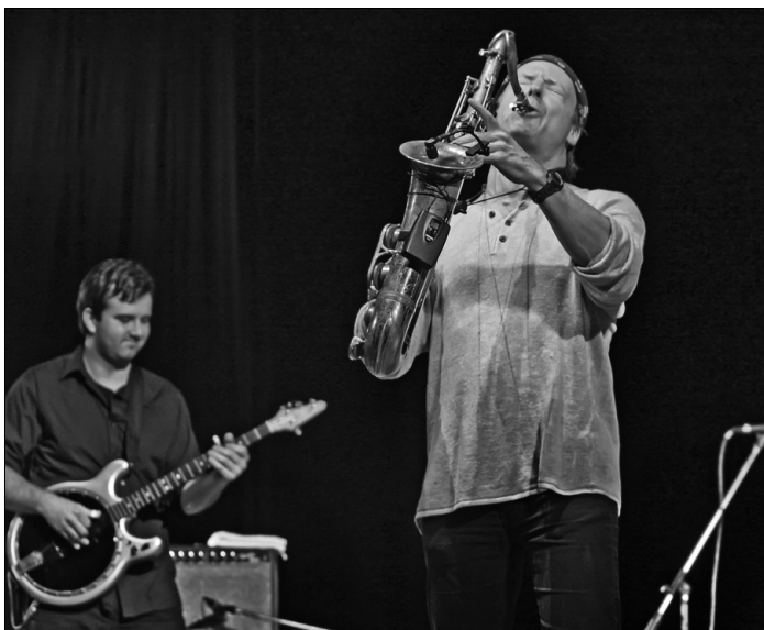
Американським народним кантрі київський виступ Білла Еванса не обмежився

Відкриття концерту незмінний ведучий усіх вечорів, що їх влаштує центр Jazz in Kiev, Олексій Коган почав із вибачення — за надто зірковий статус Білла Еванса: “Ми намагаємося показати класних, міцних, справді яскравих музикантів, а не вразити публіку титулами”. І він має рацію, але хто ж винен, що Білл Еванс справді заслужив ці титули. Скромність скромністю, та кілька номінацій на Grammy чогось таки варті. Додайте до цього участь Еванса у славновісних ансамблях Майлса Девіса й Джона МакЛафліна плюс власні успішні проекти, й ви остаточно зрозумієте, яке не легке завдання взяв на себе Олексій Коган. Та й партнери Еванса у проекті Soulgrass,