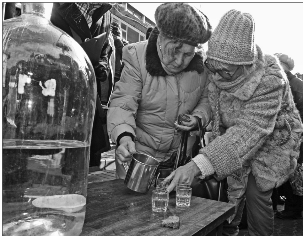
Наливаючи собі оковитої, подумайте, чи вистачить у вас здоров'я

Апостол Павло сказав: "Не впивайтеся вином, бо в ньому блуд". Пророк цар Давид зауважував, що "вино веселить серце чоловіка". Великдень є днем великої радості. Тож і радіти, і веселитися варто. Але пияцтво — це осквернення і зневага. Бо воно не прикрашає навіть у будень, а на свято тим паче недоречно. Тому категорично: упивання, зловживання алкоголем цього дня несумісне зі святковістю, величністю і заповідями Божими.