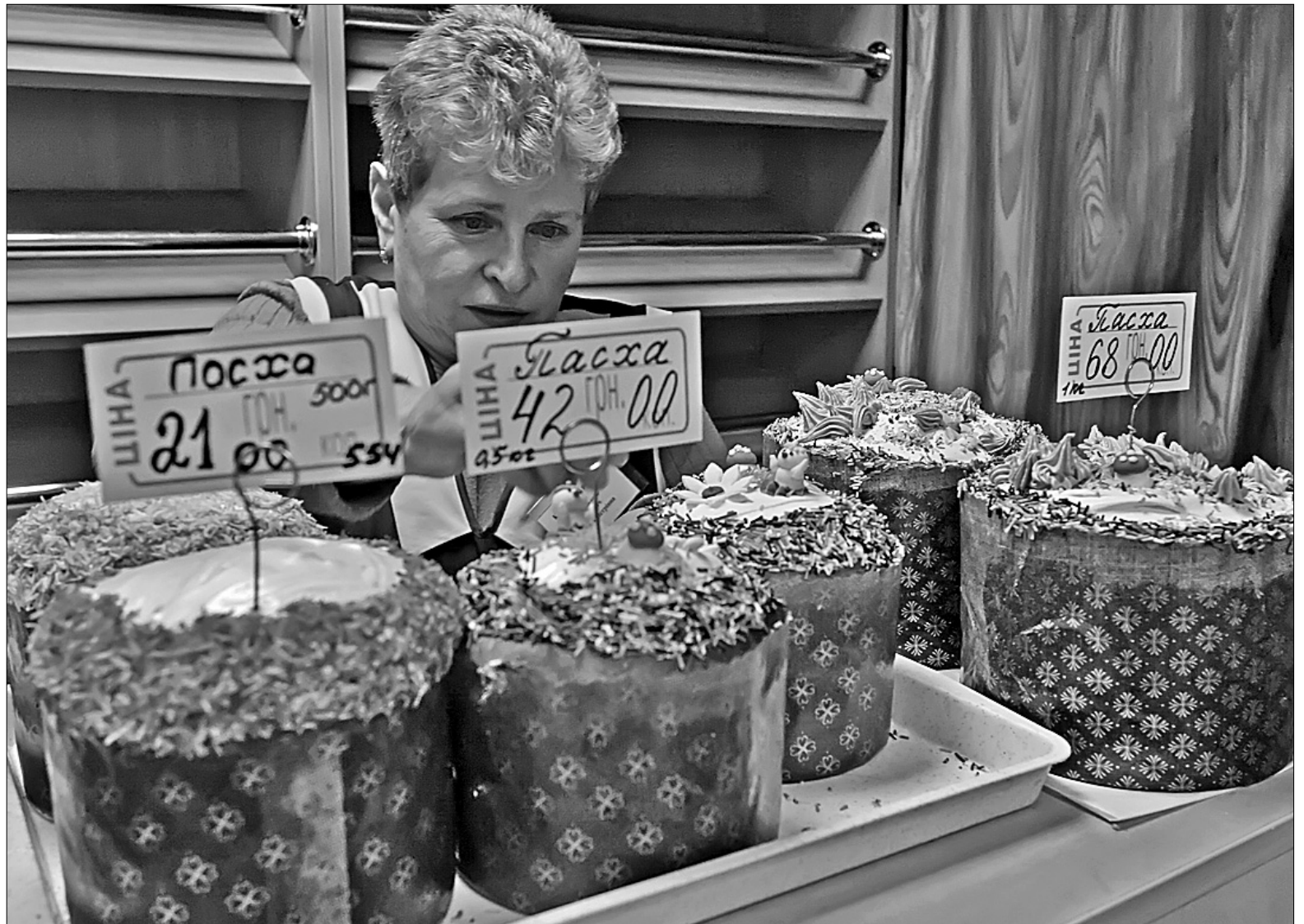
На Житньому ринку паски продають від 21 до 68 гривень, найдешевший святковий хліб пропонують у великих супермаркетах — по 7 гривень

Українці зазвичай не заощаджують на святі, дбають, щоб усього було вдосталь. Адже і у