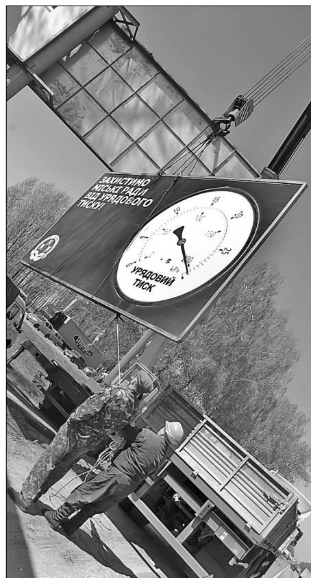
Щотижня у столиці демонтуватимуть по десять незаконно встановлених рекламних щитів

Демонтаж одного біл-борда обходиться місту майже 5 тис. грн, але ці гроші місто не втрачає. “Сама конструкція