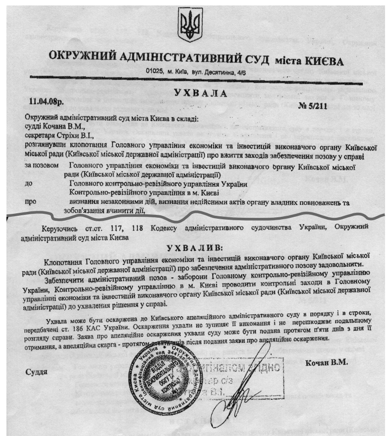
Рішення суду є, проте виконувати його команда Юлії Тимошенко не бажає

Столичний голова запевнив: "Одного разу Держказначейство вже блокувало соціальні виплати киянам. Тоді вони вийшли з протестом проти таких дій. Раджу високопосадовцям не маніпулювати благополуччям мешканців міста заради власного самоствердження на політичній арені. Гроші в столичному бюджеті є. Для цього наполегливо працювала моя команда, і підстав для блокування рахунків держадміністрації немає" ●