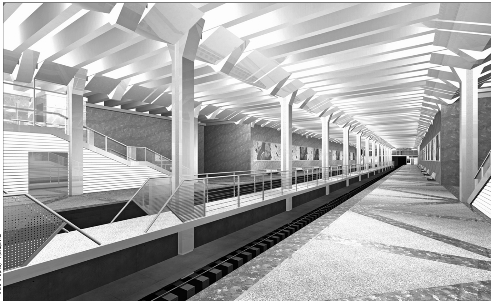
Скоро нова станція "Червоний хутір" гостинно відкриє двері для киян

"Передусім станцією "Червоний хутір" користуватимуться щонайменше 5 тисяч працівників 26 великих промислових і будівельних підприємств, таких, як фармацевтична фірма "Дарниця", Хлібокомбінат № 11, ВАТ "Дарницький завод ЗБК",