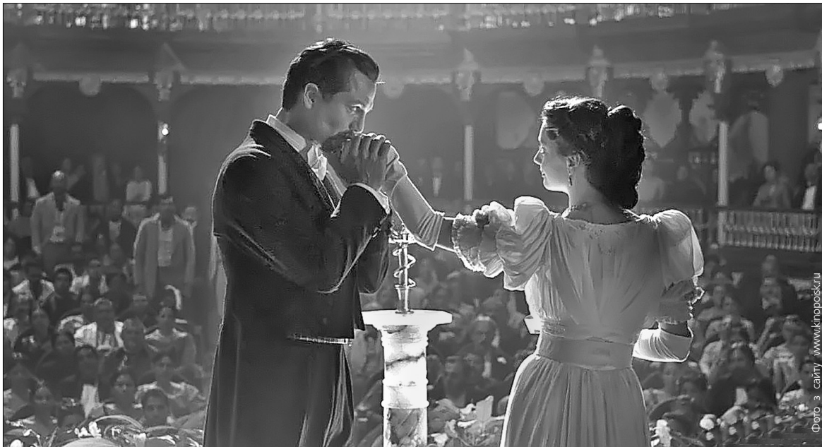
На героїв Маркеса не обов'язково дивитися очима кінокамери

Роман Габріеля Гарсія Маркеса складно впізнати у фільмі "Любов під час холери"