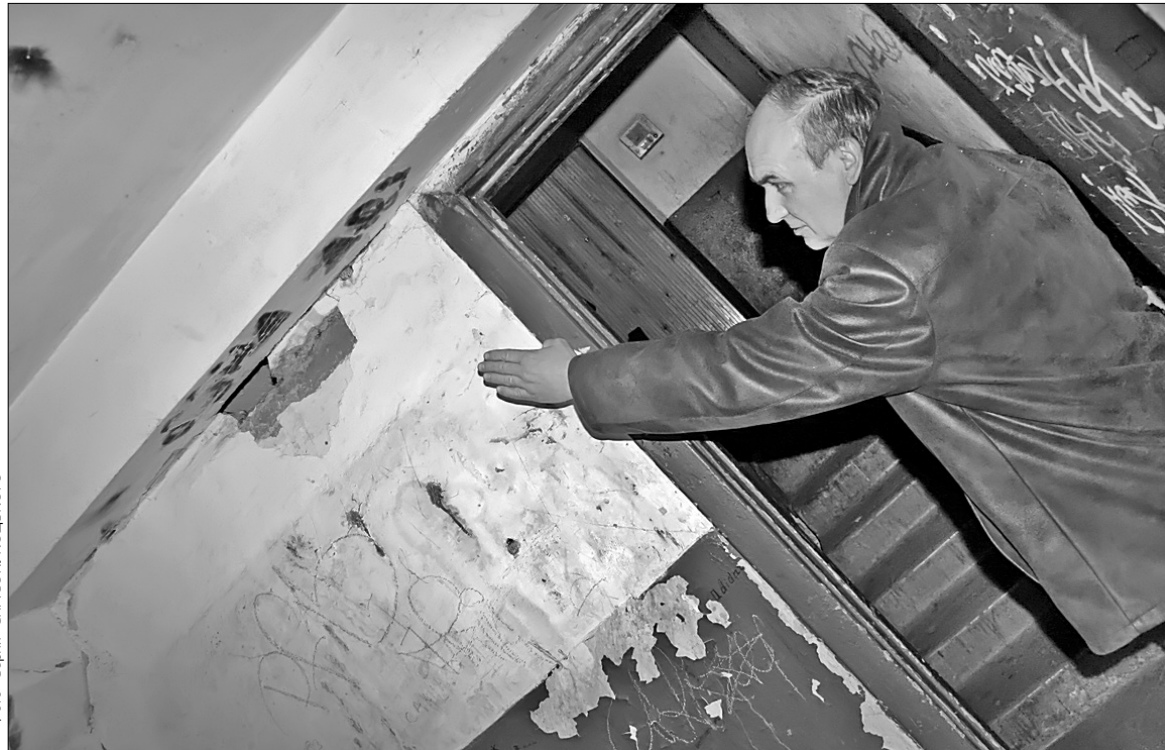
Розкриті очі на нагальні проблеми мешканців будинку на вулиці Петра Запорожця, 8-в працівників ЖЕКу змусила лише публікація “Хрещатика”

Зі слів мешканців будинку, першочергового ремонту потребував 5-й поверх, дах якого в дощову погоду протікав, через що псувалися стіни та перекриття квартир. А з люка на першому поверсі постійно виходила пара. Були проблеми і в першому парадному. На один із листів від керівництва району ще торік у вересні надійшла відповідь, що через заборгованість за житлово-комунальні послуги питання ремон-