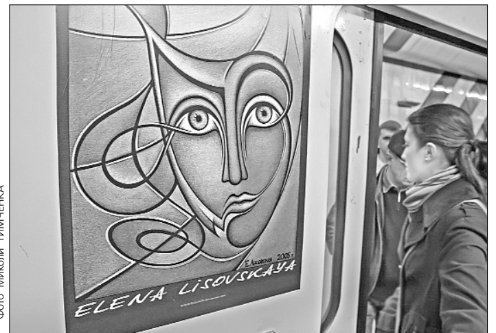
Замість реклами у вагонах одного з потягів на Сирецько-Печерській лінії пасажири розглядатимуть картини сучасних художників