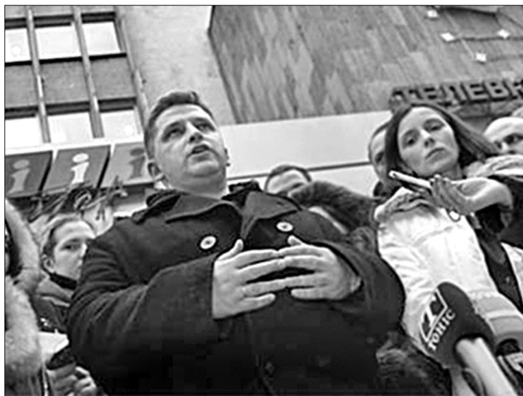
Звільнені рік тому журналісти “Інтера” так і не отримали роботу на своєму каналі

Нагадаємо, що на початку року корпорація Валерія Хорошковського UA inter media group придбала 60 % ВАТ “Телевізійна служба інформації” (телеканал НТН). Таким чином канал увійшов до складу UA inter media group. Віце-президент зі стратегічних інвестицій UA inter media group Ярослав Прохоняк уже повідомляв “Хрещатику”, що цього року на каналі НТН уперше