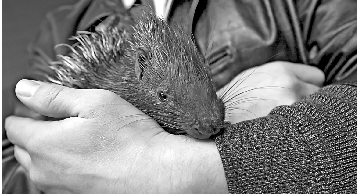
"Маленькому дикобразу Нафані дуже гарно живеться під опікою співробітників зоопарку: вони годують його солодким молоком і бананами"

До трьох місяців малюка годуватимуть штучно, після чого він потрошку звикатиме їсти самостійно — принаймні так відбувається у природі, коли звірята перестають живити материнське молоко. Тоді ж його спробують залучити до своєї родини, аби батьки та майбутні брати чи сестри до нього звикали — до тих пір, поки не визнають як члена своєї сім'ї. "В природі так буває, коли тварини відмовляються від