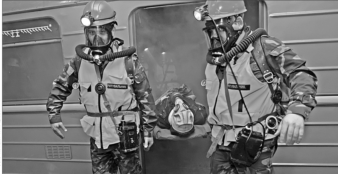
Ліквідовувати надзвичайну ситуацію на “Золотих воротах” спецмашинами прибули щонайменше 140 рятувальників

Учора станцію “Золоті ворота” оточило щонайменше два десятки спецтехніки — машини “швидкої” допомоги, пожежні, вибухо-піротехнічна служба. З них “висипало” майже 140 людей —