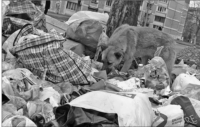
На вулиці Гаршина у Святошинському районі сміттєві контейнери зникли кілька місяців тому. Жителі мікрорайону змушені викидати сміття просто на дорогу

Водночас до міського call-центру почало надходити все більше