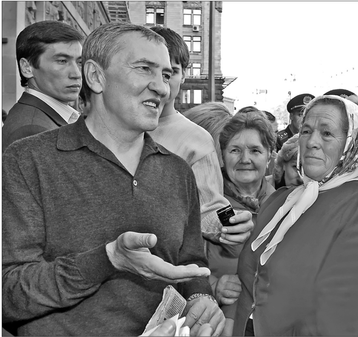
Леоніду Черновецькому завжди є що сказати людям

Протягом останніх двох років Київ був острівцем стабільності в країні, що дало змогу значно поліпшити рівень життя пересічного киянина. “Ми робимо конкретні справи, а не займаємося порожнім базіканням на відміну від тих, хто у власних шкурних