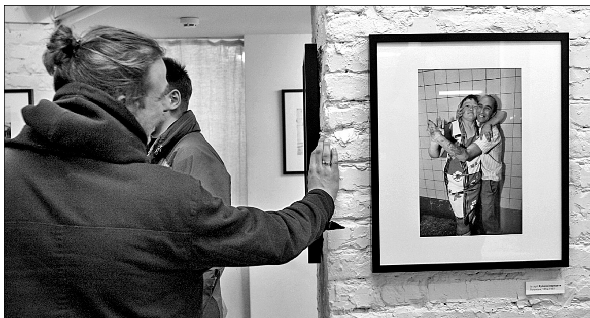
Бомжі Олександра Чекменьова почувуються на вулиці, як на сцені

Наймолодший із метрів української фотографії, як завше, вірний собі. І не тільки тому, що вкотре виставив портрети земляків. З часів найударніших чекменьовських циклів, “Переможців” і “Копанки”, від уродженця Луганська нічого іншого, окрім хроніки донбаських буднів, здається, і не чекають. Дивне в іншому: Олександр Чекменьов знову вдалося зробити серію про людей, у край принижених життям, і при цьому і на йоту не принизити їх на власному знімку. А, здавалося б, що є простіше: збери луганських бомжів з вибитими зубами і набряклими від горілки обличчями, вбери в балетні пачки або костюми космонавтів, оберни відповідне тло, зроби концептуальну серію і — вперед