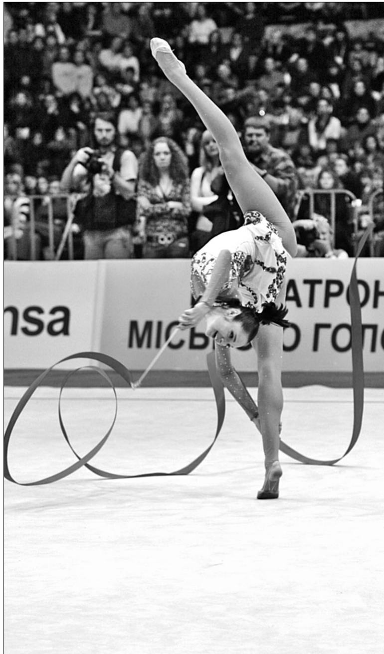
Чемпіонка Ганна Безсонова, безумовно, втілила свою мету — бути найкращою — в житті

олімпійський комітет визнав Безсонову найкращою спортсменкою 2007 року. Спортсменка також була номінанткою на звання "Спортсмен року-2007".