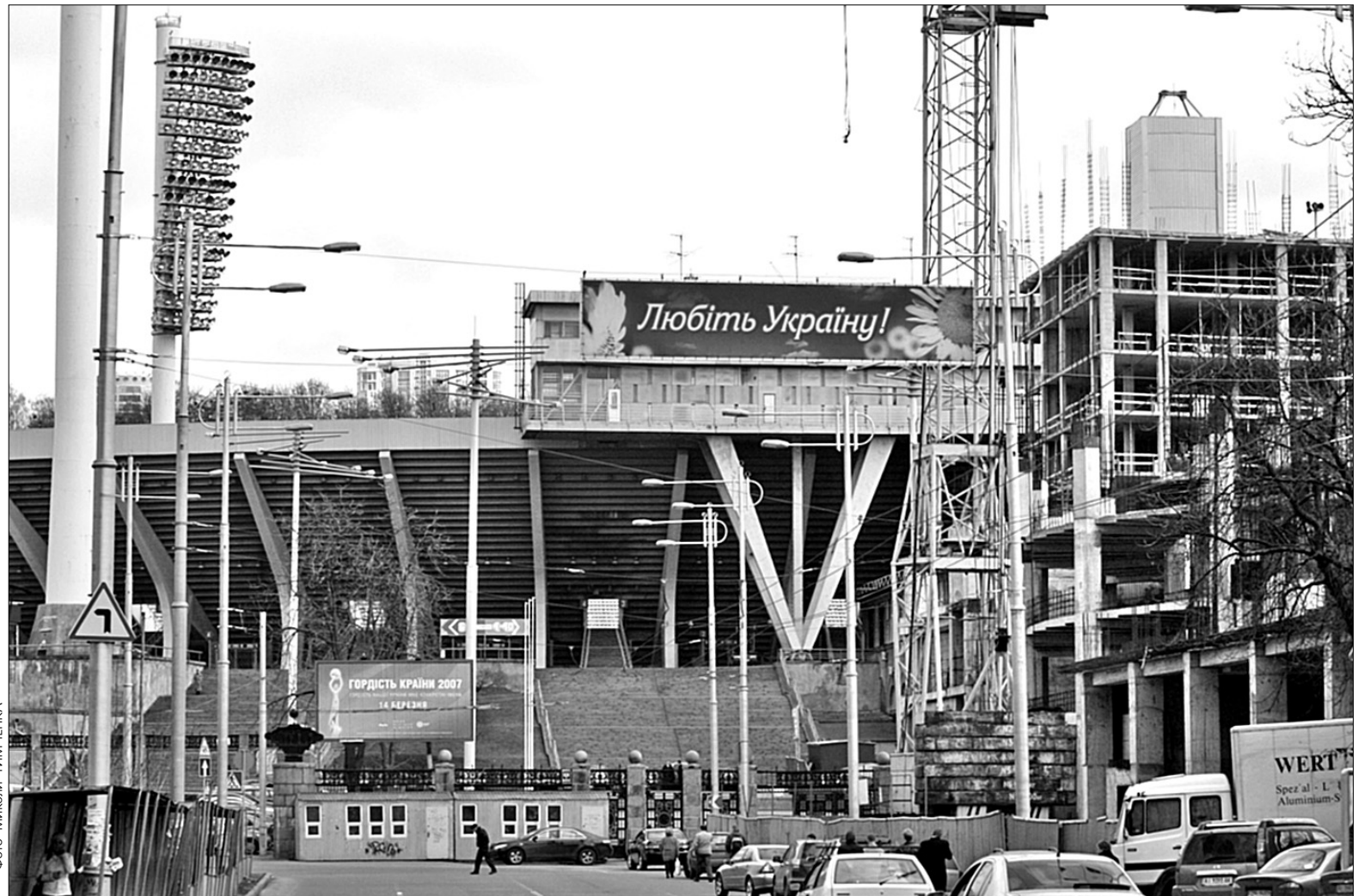
Демонтаж "Троїцького" та реконструкція НСК "Олімпійський" гарантують проведення Євро-2012 в Україні