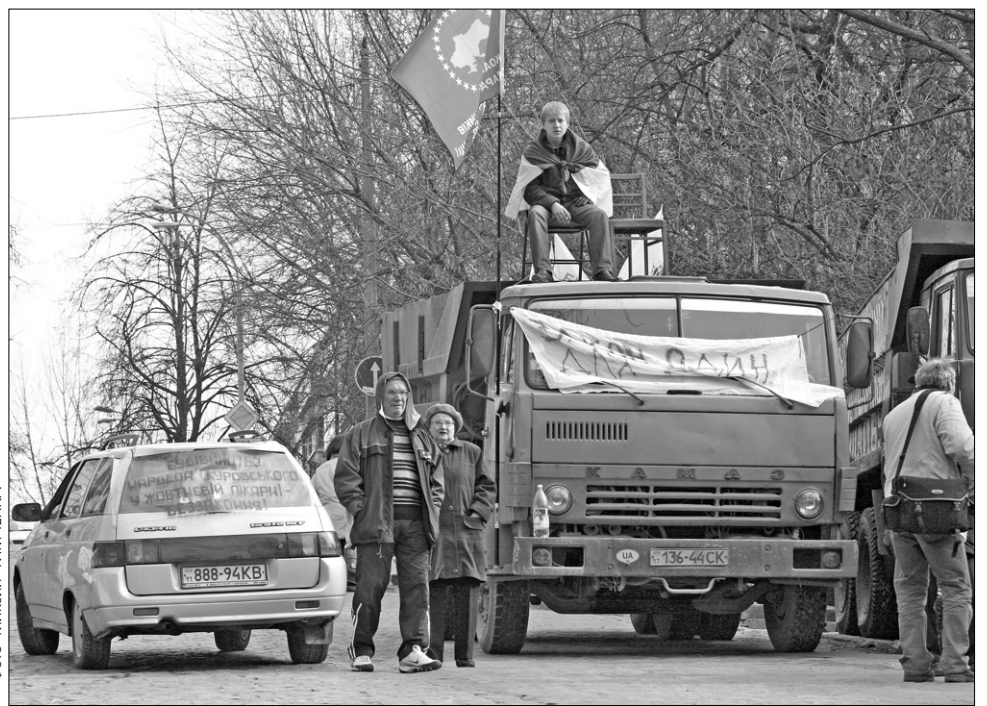
Активісти проти забудови Жовтневої лікарні чергуватимуть цілодобово, щоб не допустити зведення висотки на колишньому могольнику

Нагадаємо: будівництво висотки на території лікарні веде компанія "Житло-Буд", яка належить нардепу від БЮТ Івану Куровському. Землю він отримав ще за часів Олександра Омельченка. Крім цього проекту, компанія має й інші. Причому теж скандальні, приміром, на вул. Патержинського (біля СБУ), Круглоуніверситетській, Тверського тупика. Будівництво — головна сфера діяльності нардепа. Він також займається агропромисловим комплексом (його підприємству "Агропрогрес" належить майже