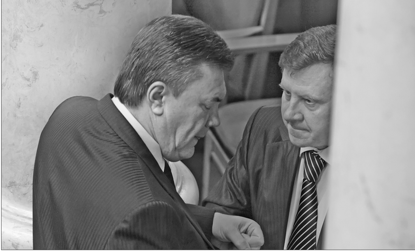
Опозиція стискає кулаки у парламентських кулуарах

Кабміном не задоволені ані опозиція, ані Президент