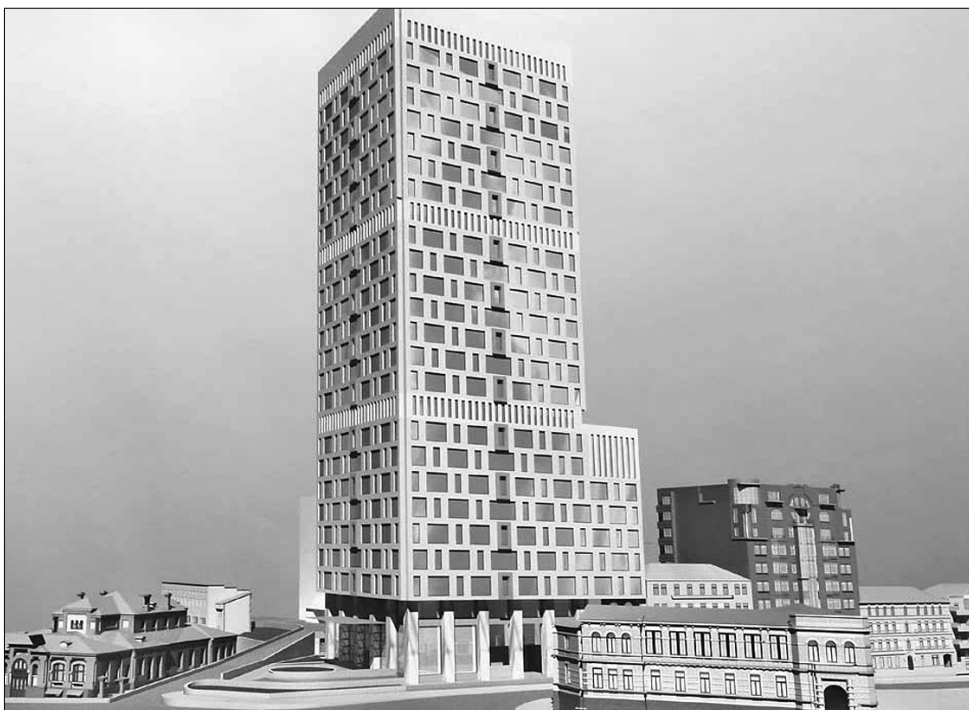
Для дитячої урології у майбутній будівлі на вулиці Обсерваторній запланували лише 40 ліжок, решту площ займають офіси і ресторани