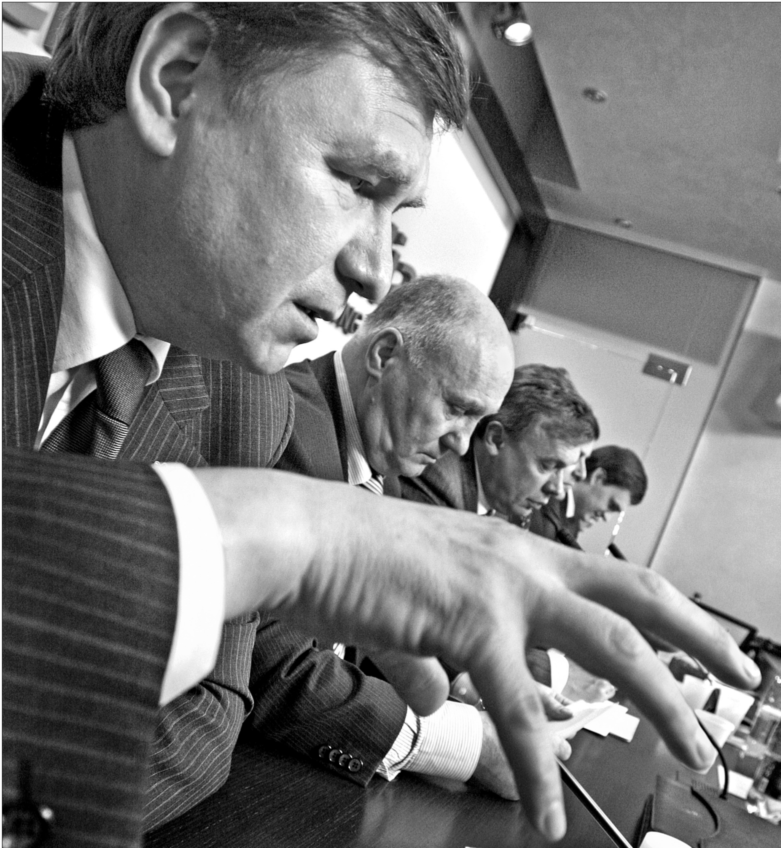
До посади Леоніда Черновецького вже тягнуть руки майже десять кандидатів

Мер просить Юлію Тимошенко створити йому конкуренцію