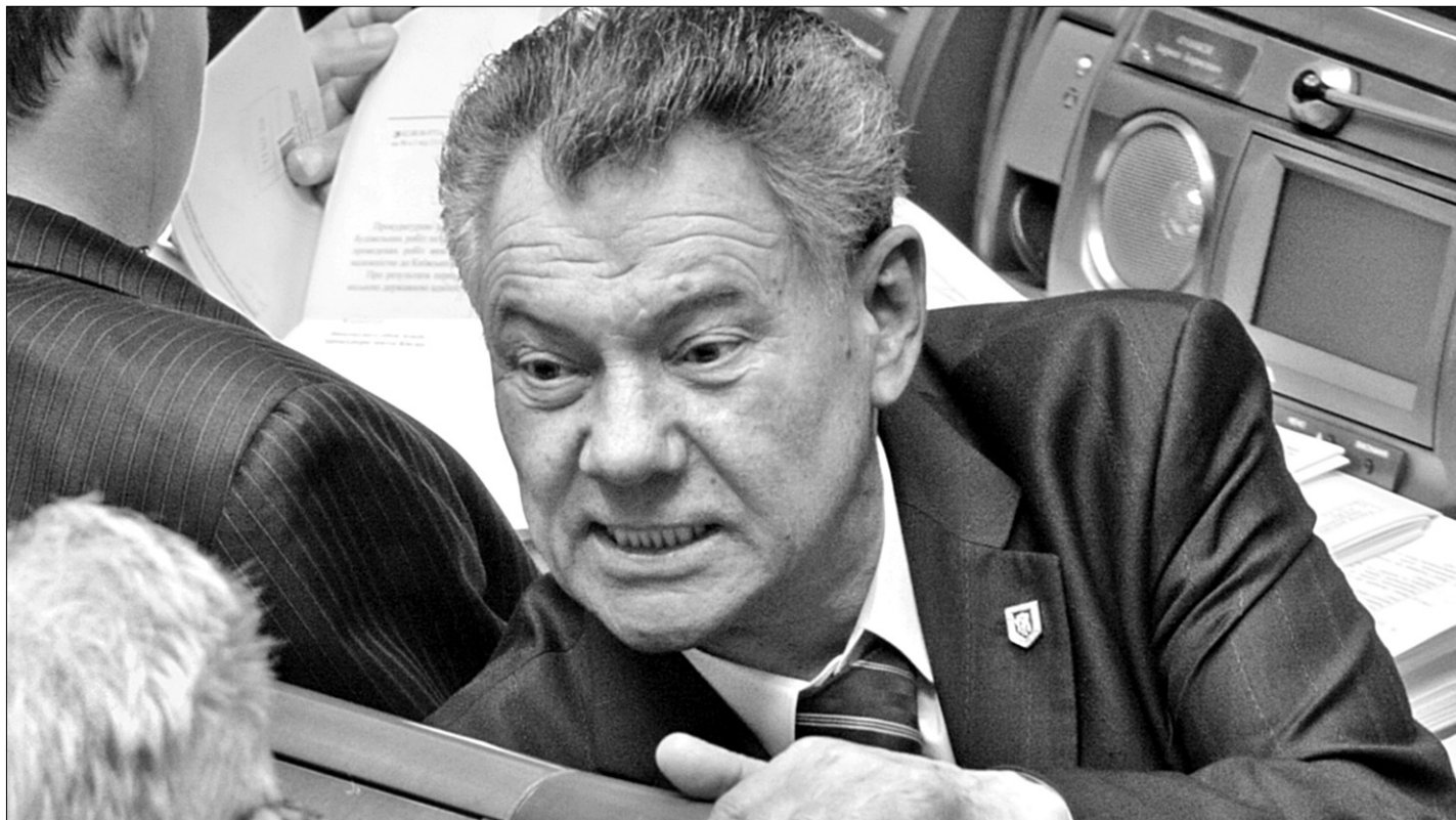
Колишній мер Києва Олександр Омельченко шукає собі новий політичний дах

Активність колишнього мера політолог Кость Бондаренко прокоментував “Хрещатику” як намагання повернутися у велику політику. “Маючи партію, яка б відображала його інтереси, він може набути зовсім іншої ваги. Одна річ, якщо він просто екс-мер Києва, інша — коли в нього є якась структура, нехай невелика і не надто активна, але завдяки їй можна знову ініціювати входження до того чи іншого блоку, здобувати підтримку з боку інших політичних сил. Таким чином пан Омельченко демонструє, що з політики йти не збирається”, — зазначив “Хрещатику” Кость Бондаренко ●