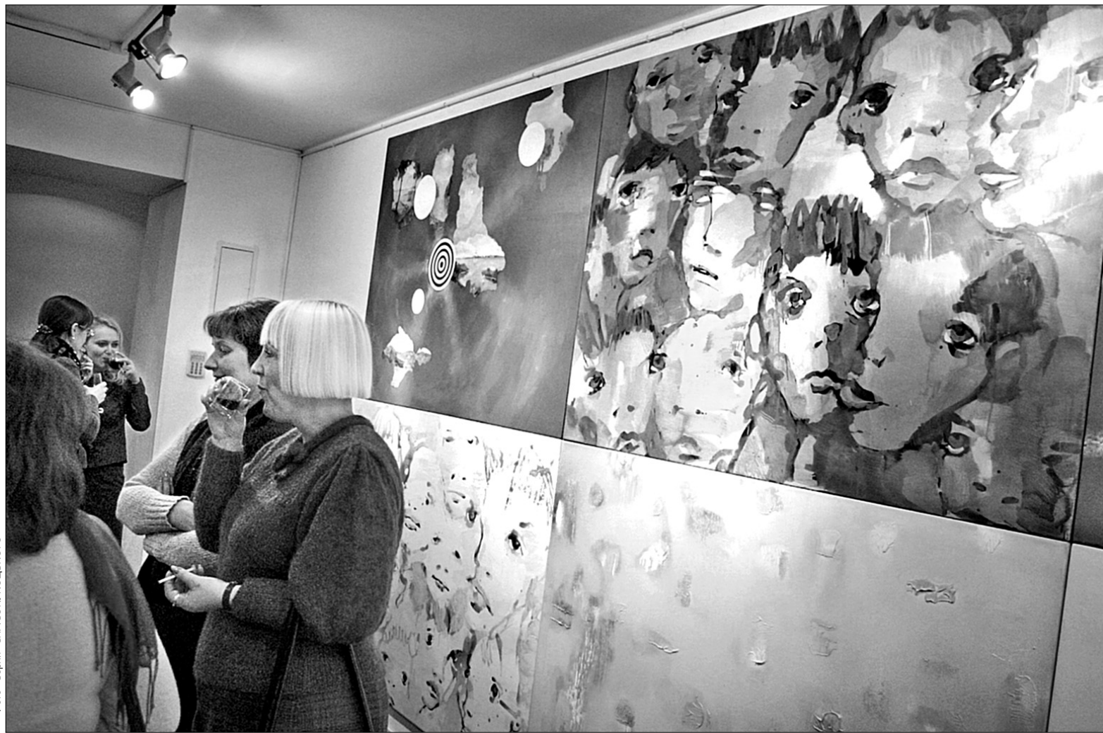
Литовські художники розфарбували політичну лояльність під державний прапор

Почали куратори з того, що виготовили одинадцять гіпсових копій мармурового торсу. Потім роздали по зліпку художникам з п'яти країн, що входили колись до складу Австро-Угорщини, — представникам Польщі, Словаччини, Угорщини, Австрії і України. Фото- і відеозвіт про десять оригінальних інсталяцій разом із одинадцятьма незайманою копією вже провезли виставковими залами всіх великих міст колишньої Габсбурзької імперії і наприкінці вирішили показати в Києві. Смісловий хід, підкреслюють організатори виставки, принциповий: іншого міста, де б так хотілося говорити про емблеми, що пережили монархів,