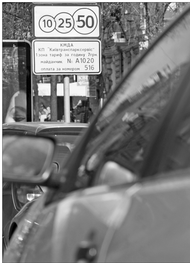
Мобільне паркування ще не один місяць існуватиме тільки на дорожніх знаках, поки стане популярним

Незважаючи на всі нарікання водіїв у "Київтранспарксервісі" упевнені, що послуга таки стане популярною. "Я думаю, що прак-