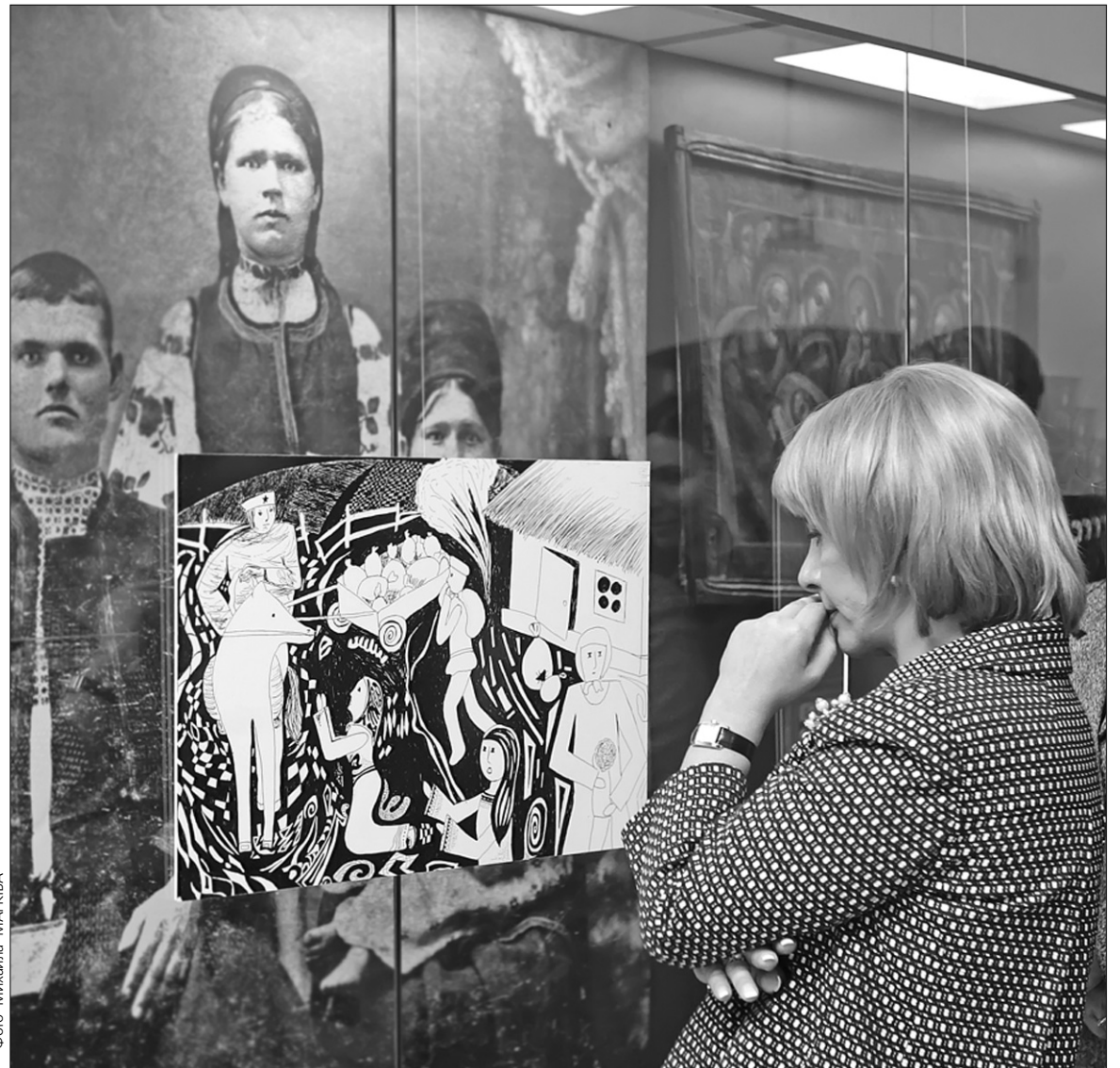
На II Всеукраїнському конкурсі плакатів «Свічка у вікні», організованому МФБ "Україна-3000", було представлено найкращі плакати на тему Голодомору в Україні в 1932—1933 роках

Міжнародний благодійний фонд "Україна-3000" оголосив переможців II Всеукраїнського конкурсу за найкраще висвітлення теми Голодомору