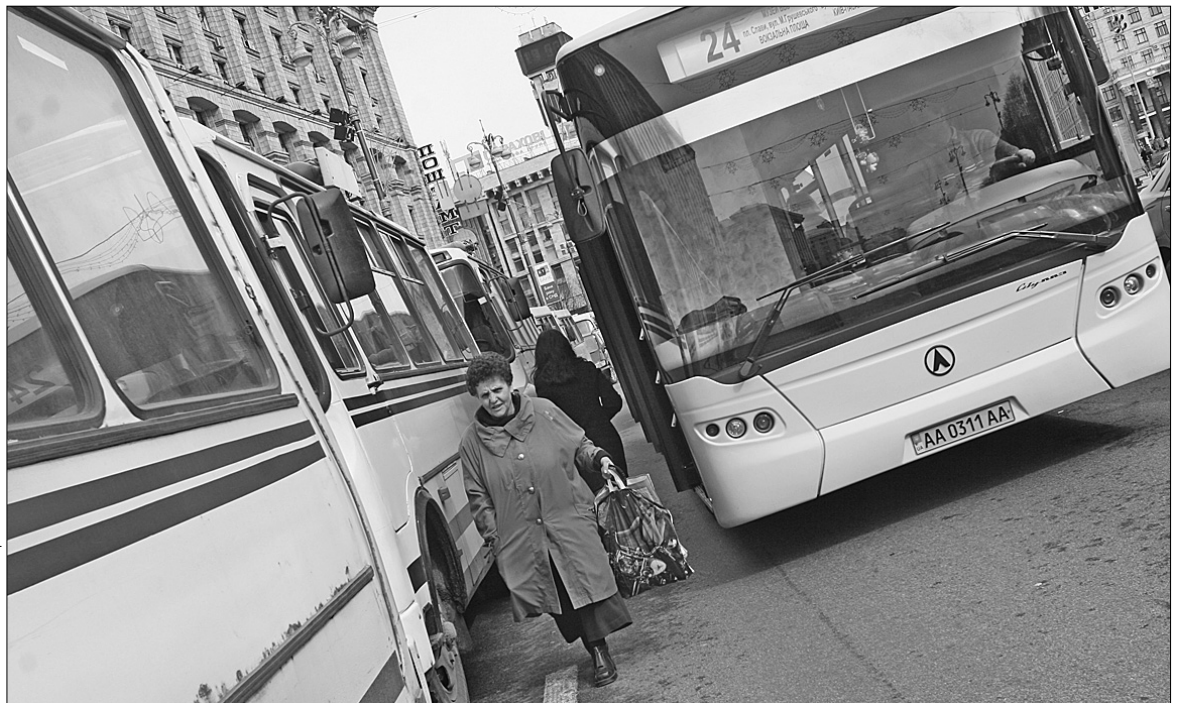
Попри страйк, киянам не доведеться платити більше за транспорт

"Хочу, щоб кияни зрозуміли, що розвал громадського транспорту стався за минулої влади, у якій не було ні грошей, ні сил, ні охоти навести лад у цій сфері. У нас же є і кошти, і воля, щоб забезпечити киян надійними, сучасними автобусами, тролейбусами й трамваями європейського рівня. З кондиціонерами і високим рівнем сервісу. І це одне з моїх пріоритетних завдань у роботі на благополуччя киян, — сказав Київський міський голова. — Поки що ж я приношу вибачен-