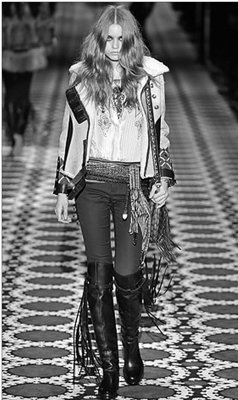
Одяг від Gucci пройнятий українськими народними мотивами

Автентична напівлюксова марка Bottega Veneta від дизайнера Томаса Майєра показала неперевершену колекцію, витриману в найкращих традиціях цього бренду.