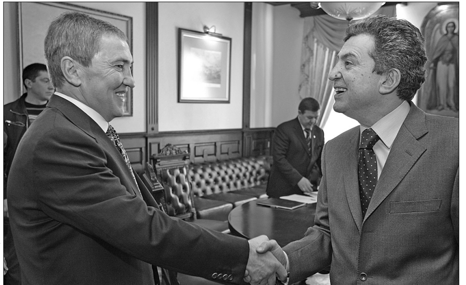
Київ потиснув руку Риму