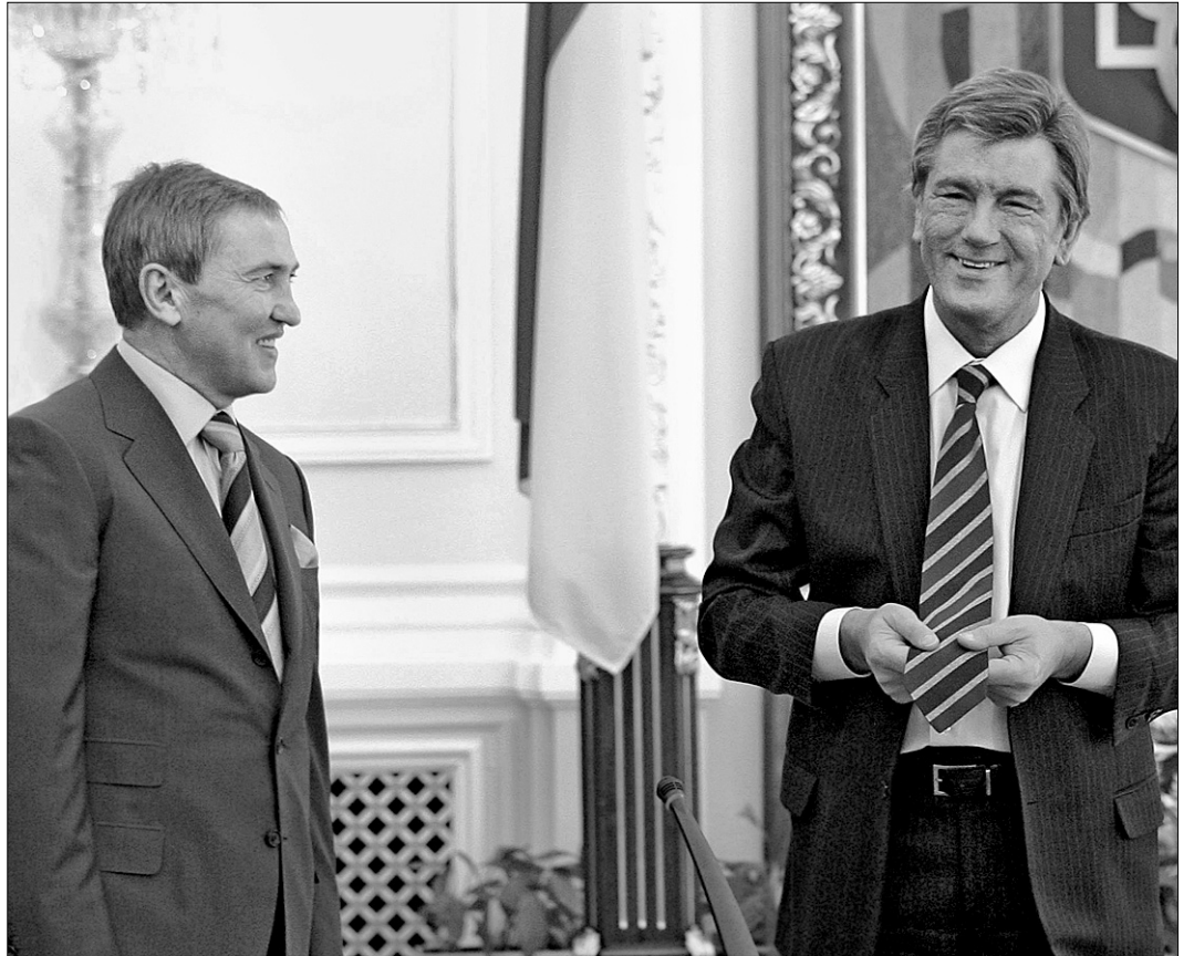
Ще під час вітання Віктора Ющенка з днем народження мер Києва та Президент обговорили майбутній розвиток столиці

«Завдання стосовно поліпшення й розвитку столичної інфраструктури, які визначив у своєму указі Президент, київська влада вже виконує. Ми очікуємо таких же кроків і з боку Кабміну. Я вже казав, що урядові час поверну-