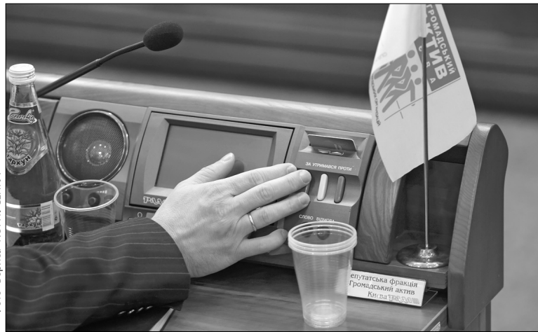
Хто саме тиснутиме на кнопки в залі Київської ради, сьогодні вирішуватиме міська виборча комісія