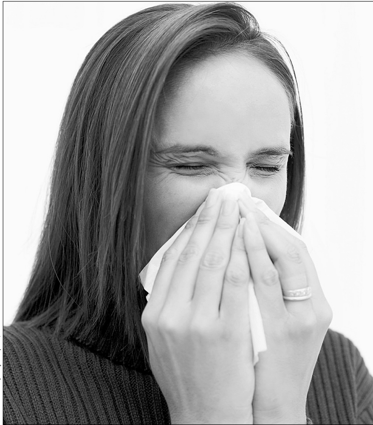
Якщо ви вже захворіли на грип, то під час чхання й кашлю намагайтеся прикривати рота хустинкою, аби не поширювати інфекцію

Останнім часом з грипом та ГРВІ злягли чимало киян. Спеціалісти запевняють, що захворюваність стрімко зростає, хоча поки що не перевищує епідеміологічного порогу. Як розповіли "Хрещатику" в Центрі грипу та ГРВІ МОЗ України, минулого тижня на 10 тис. населення припало майже 80 киян, котрі захворіли на грип, тоді як поріг становить 121,3. А втім, на сполох медики вже можуть бити наступного тижня, коли захворюваність сягне критичної межі. За прогнозами фахівців, може статися, що й київські школи закриють на карантин.