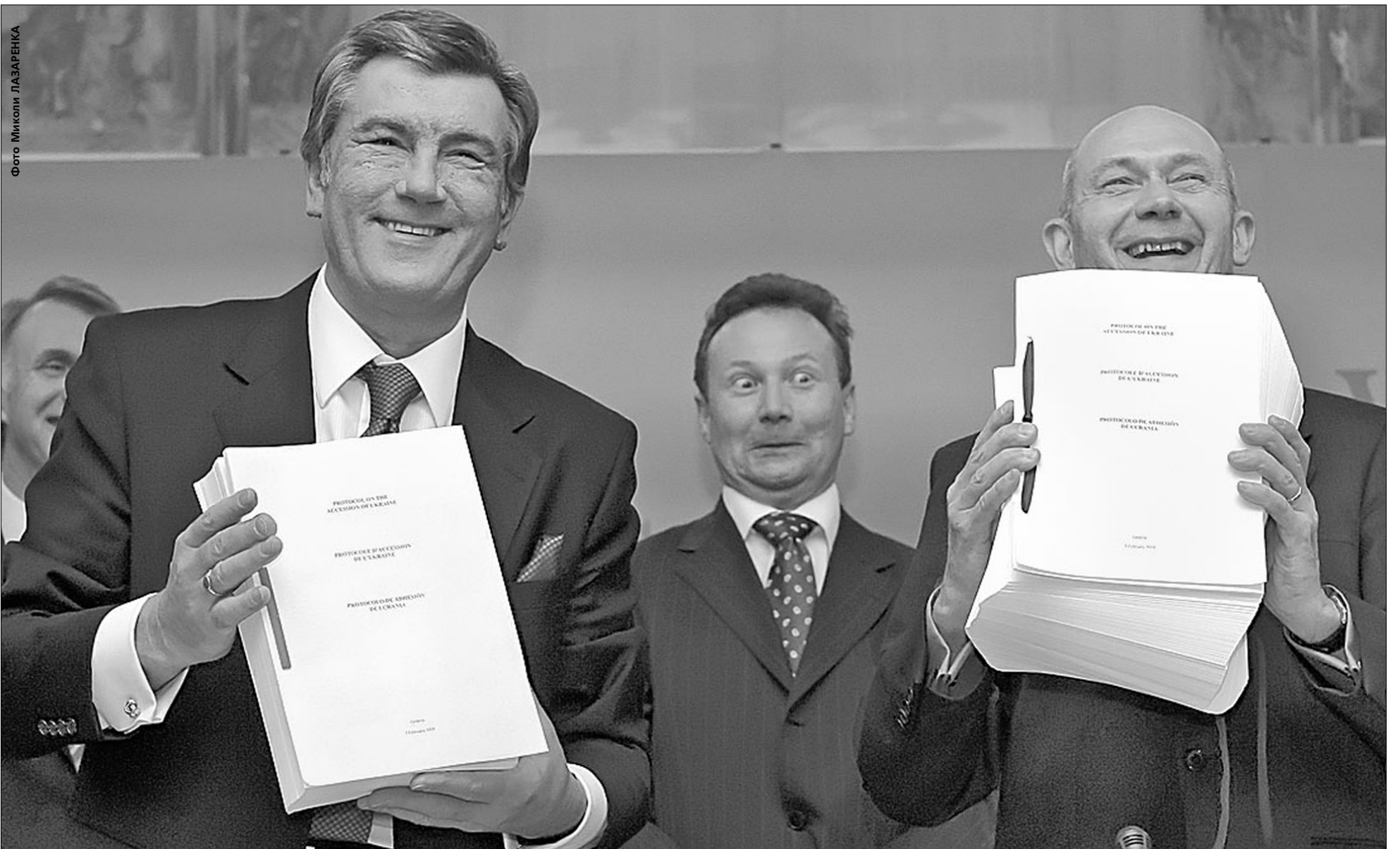
Фото Миколи ЛАЗАРЕНКА