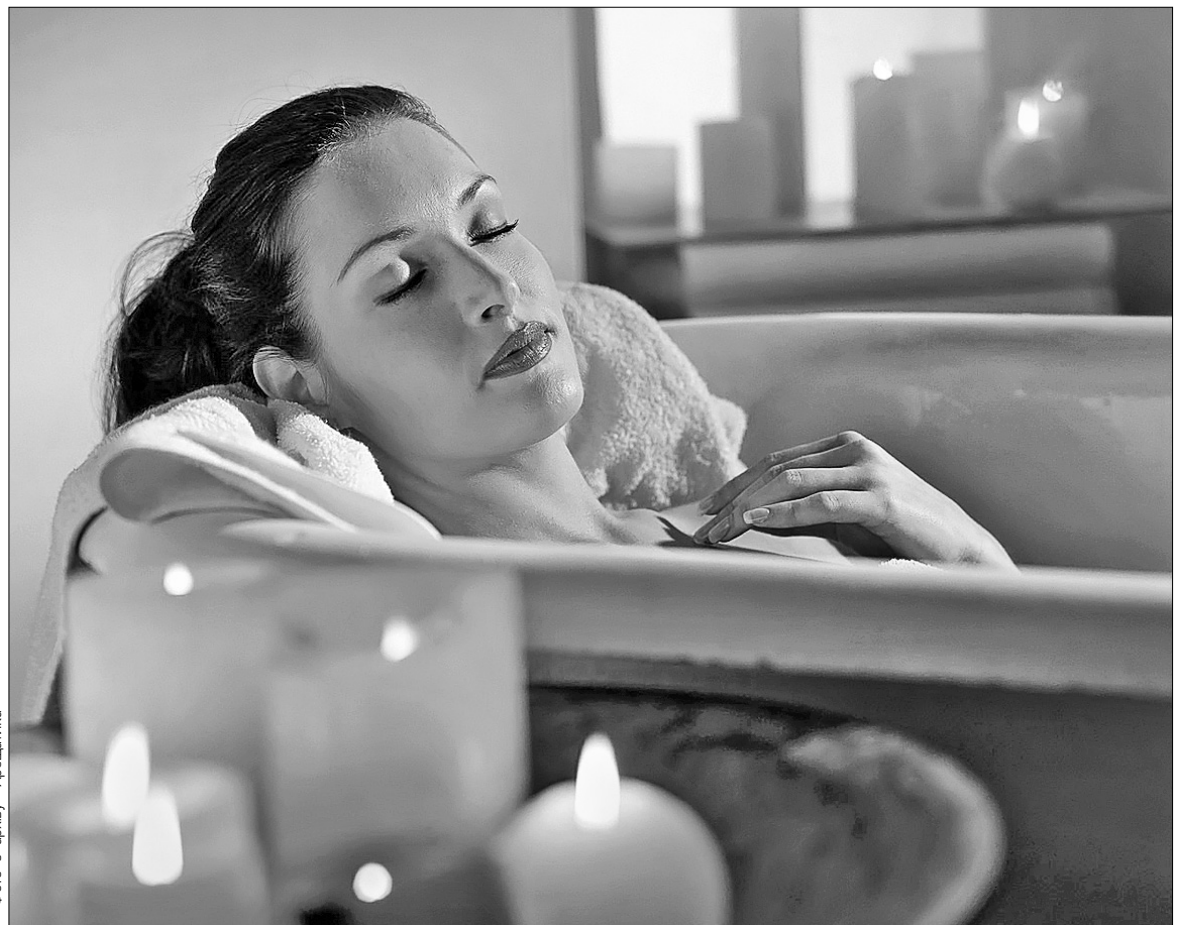
Водолікування — один із найпростіших методів фізіотерапії, який можна застосовувати й удома

Щоб запобігти гострим респіраторним вірусним інфекціям, організм загартовують, поєднуючи водні процедури з прогулянками, повітряними й сонячними ваннами, плаванням та інгаляціями різних лікарських розчинів. Від недуг опорно-рухового апарату й уражень периферійної