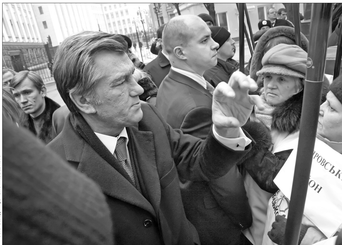
Віктор Ющенко взяв під контроль держави ситуацію навколо афери "Еліта-Центру"

Противники Леоніда Черновецького зібралися під будівлею Верховної Ради, сподіваючись, що парламент ухвалить постано-