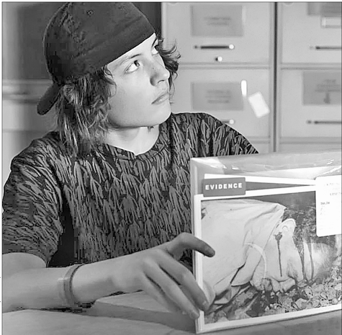
Найкраще камері Крістофера Дойла вдається розвинути хлопчика

Скейтборди і підлітки в "Параноїд-парку" Ван Сента