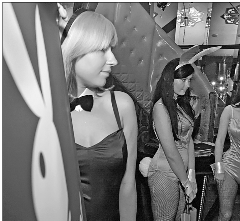
Зваблivi bunny-girls сумували наодинці через невелику кількість гостей