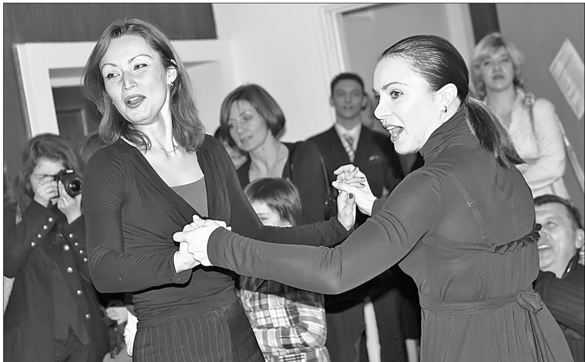
Лілія Подкопаєва провела для новачків безплатний майстер-клас

Після поздоровлень від колег по цеху гостей частували шоу-програмою, яку запальним джайвом відкрили зовсім юні, але вже "заслужені" учасники Відкритого чемпіонату Голландії та Чемпіо-