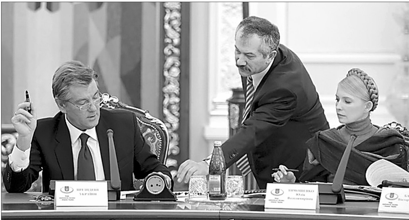
Нова ціна на газ має задовольнити не лише Президента, а й українську економіку

П'ятничне засідання РНБО дало старт реформуванню ринку газу