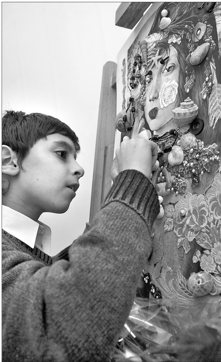
Колажі Сергія Параджанова не потребують від глядачів дистанції

Який вигляд мали ці перші колажі, відвідувачам виставки належить переважно здогадуватися — у тій частині колекції, яка прибула з Єревану до Києва, раннього Параджанова не так уже й багато. Один істотний нюанс: раннього — це п'ятдесятирічного, такого, котрий відбував перший термін (режисера заарештували в Києві в 1974-му й засудили до п'яти років; після київського арешту був ще тбіліський — у 1982-му). Представляють табірну творчість на виставці передусім марки — мініатюрні олівцеві портрети мешканців зони, один із найударніших експонатів ереванського зібрання. Це не колажі за технікою виконання, але колажний принцип — поєднувати несумісне — і тут в наявності. Малює товаришів за нещастям Параджанов у відверто шаржованій манері, але виходять при цьому парусни, що стільки ж само нагадують героїв звичайних шаржів, як і лики святих із фресок грузинських храмів. Святих багато, ціла дюжина, і всі просяться додому — неначе