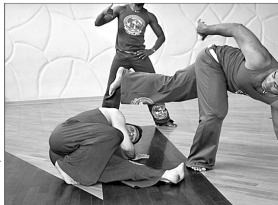
Синтез боротьби, акробатики та танцю — капоейра

Хореограф розповіла "Хрещатику", що капоейра — це водночас азартна та весела гра, пластика та акробатика, здоровий образ мислен-