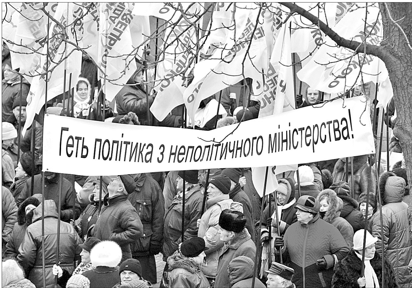
Кияни хочуть бачити на чолі МВС врівноважену людину