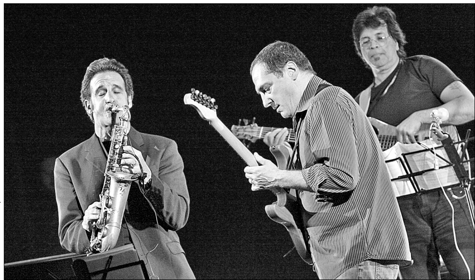
Від кількості зірок на квадратний метр щільність атмосфери на концерті циклу Jazz in Kiev відчутно зашкалювала

Ідея зібрати всіх до спільного бенду належить російському клавішникові, композитору, автору музики майже до усіх вистав Марка Розовського, а до того ще й засновникові власного колективу "Трансатлантик" Сергієві Чіпенку. Саме він запросив музикантів до Москви на запис свого альбому. А відтак, з'явилася й нагода організувати для гурту концертний тур російськими та українськими містами. Спланувати маршрут таким чином, щоб обов'язково заїхати до Києва, особливо заохочував колег саксофоніст Ерік Марієнталь, котрий в Україні завжди приїздить із задоволенням. А клавішник Джеф Лорбер, останній диск якого саме номінують на Grammy, як з'ясувалося, навіть має українське коріння. Його дідуся та бабусю народилися у Дрогобичі, куди Джефові, як зізнався сам музикант "Хрещатикові", дуже кортить навідатися при нагоді. Напевно, найближчим часом така нагода трапиться, принаймні всі музиканти вже згодні викладати в так званих джазових клініках — своєрідних літніх школах. Їхньою організацією також займається Jazz