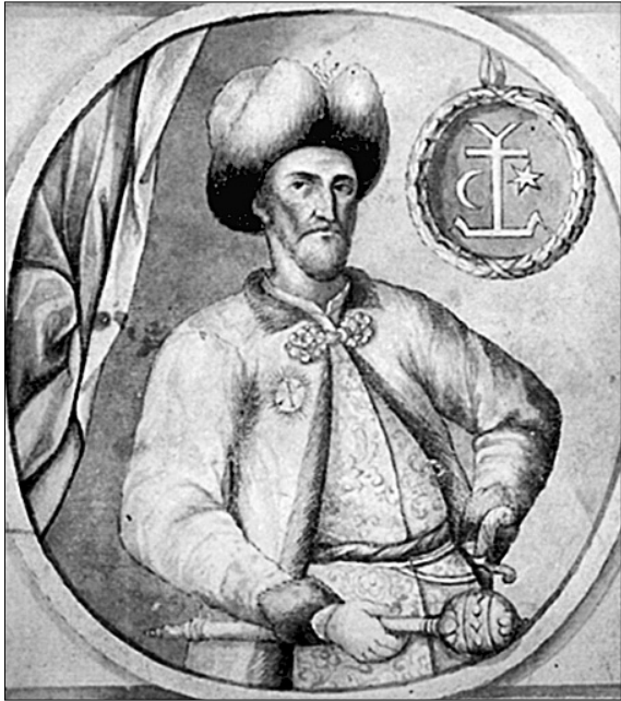
Портрет гетьмана Івана Мазепи роботи Самійла Величка (XVIII ст.)

У московських музеях виставлено портрети, на яких буцімто зображено Івана Мазепу