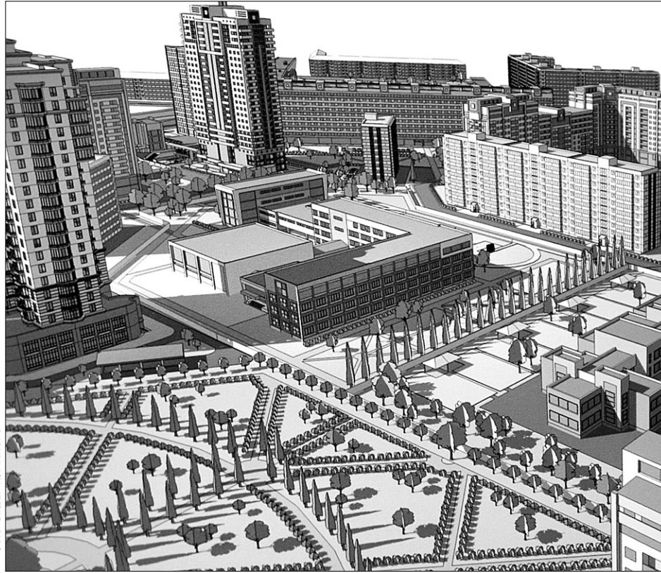
Реконструкція 8-го мікрорайону «Соцмістечка» передбачає знесення старих будівель і зведення висотного житла