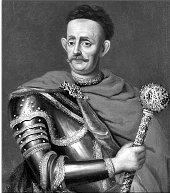
Портрет великого гетьмана Литовського, воєводи віленського Сапєги, довго вважали портретом Мазепи