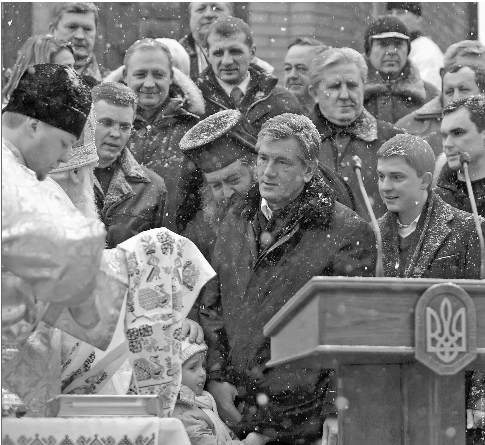
Патріарх Київський і Всієї Руси-України Філарет також здійснив чин освячення Дніпрових вод та води в каплиці Хрещення Господнього

У Гідропарку освятили Дніпрові води та воду в каплиці Хрещення Господнього