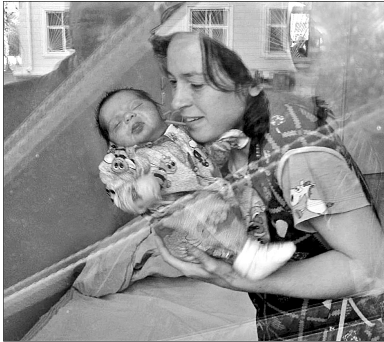
Немовля ще навіть не здогадується, наскільки воно дороге батькам

Вагітній можуть надати окрему палату. Тут умови перебування комфортніші, ніж у загальних