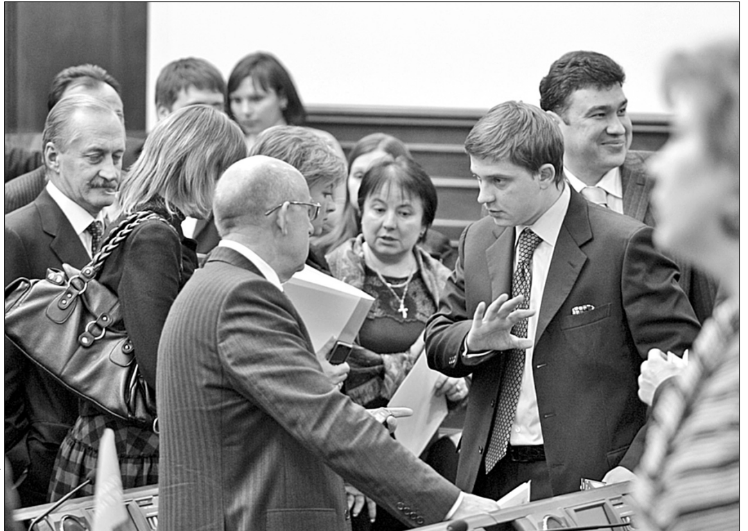
Усі спірні питання депутати Київради обговорять до початку сесії