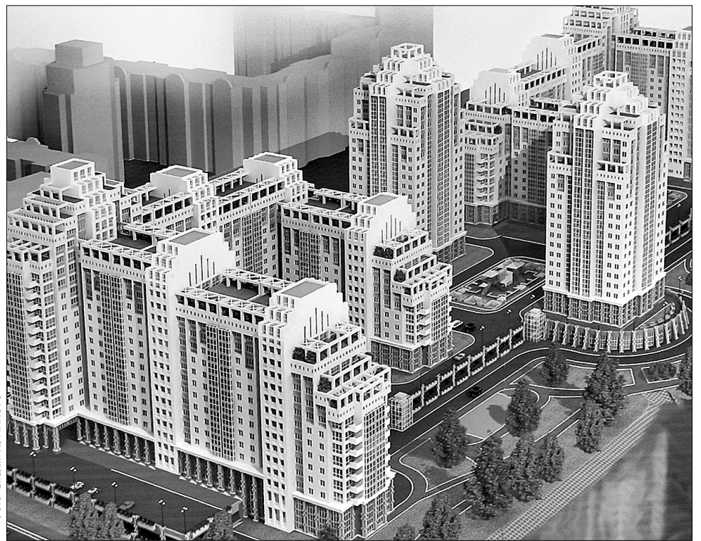
Містобудівна рада погодить проект будівництва житлової 20-поверхівки на вул. Костичева, якщо інвестор подбає про благоустрій навколишньої території

У цілому архітектори схвалили проект, але виявили деякі недоробки та упущення в роботі. "Насамперед замовник має забезпечити благоустрій зеленої зони поблизу