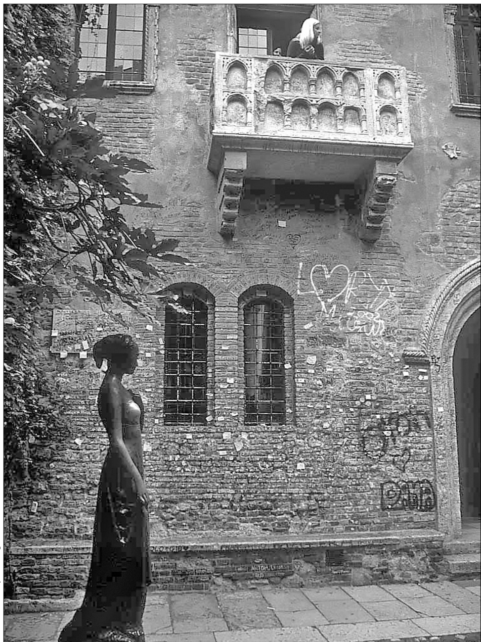
До Дня святого Валентина «Будинок Джульєтті» повністю очистять від нашарувань любовних записочок і графіті

У московському парку "Сокольники" завершено будівництво крижаного комплексу з палацом з гірками, скульптурами й невеликою ковзанкою. На "цеглу" для стін будови пішло 45 тонн льоду. Будувати палац розпочали в перші дні нового року, коли в столиці встановилася морозна погода. Нині комплекс готовий прийняти перших відвідувачів, які зможуть пройти крижаними залами й помилуватися скульптурами. Також незабаром у російській столиці має