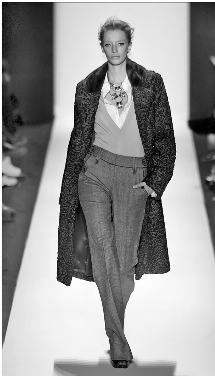
Варіантів для комбінування образу з білою сорочкою — безліч

Різдвяні розпродажі змушують серця модниць усього світу битися швидше. І українські дівчата не стали винятком. Сезонні гостромодні речі через кілька місяців відійдуть у минуле, але класика must have затримається в гардеробі ще надовго. Тому січень та лютий — найкращий час, аби скласти комплекти одягу та ще й зекономити добру половину власного бюджету. Серед розмаїття нових фасонів та різних кольорів дуже важко обрати щось одне. Але під час сезонних та святкових розпродажів можна не концентруватися лише на потрібних речах — за ціну, яку коштувала, наприклад, спідниця, на розпродажі можна придбати цілий комплект. Але більшість цього гостромодного одягу через 2–3 місяці стане неактуальною, тому зекономлені гроші все одно стануть "викинутими на вітер". Тож як скористатися "подарунком" правильно? Купувати класичні речі, що є завжди актуальними. Тільки вони стануть основою гардероба і служитимуть не один сезон.