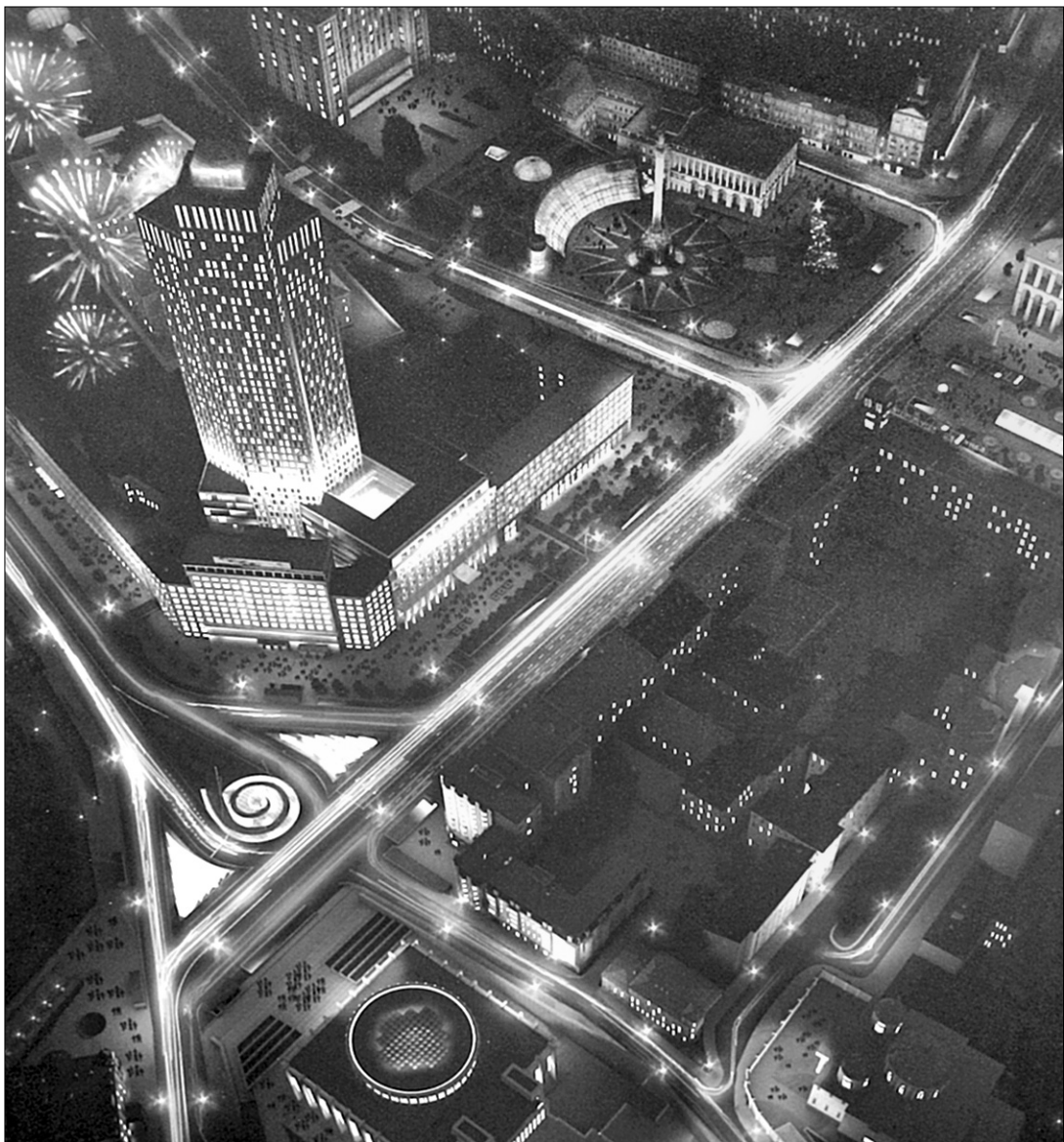
Реконструкція Європейської площі передбачає і будівництво 40-поверхового готельного комплексу

На наступній стадії проекту автори мають розробити пішохідно-транспортну схему в цьому районі з можливим будівництвом підземного автомобільного тунелю. Проектувальникам рекомендували також поліпшити силует висотки та визначитися із кількістю поверхів ●