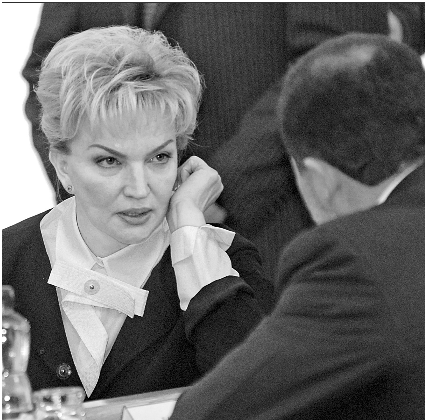
Раїса Богатирьова присіплює вивчає дії нового уряду

Кабінет Міністрів вніс до Верховної Ради новий проект головного фінансового документа-2008