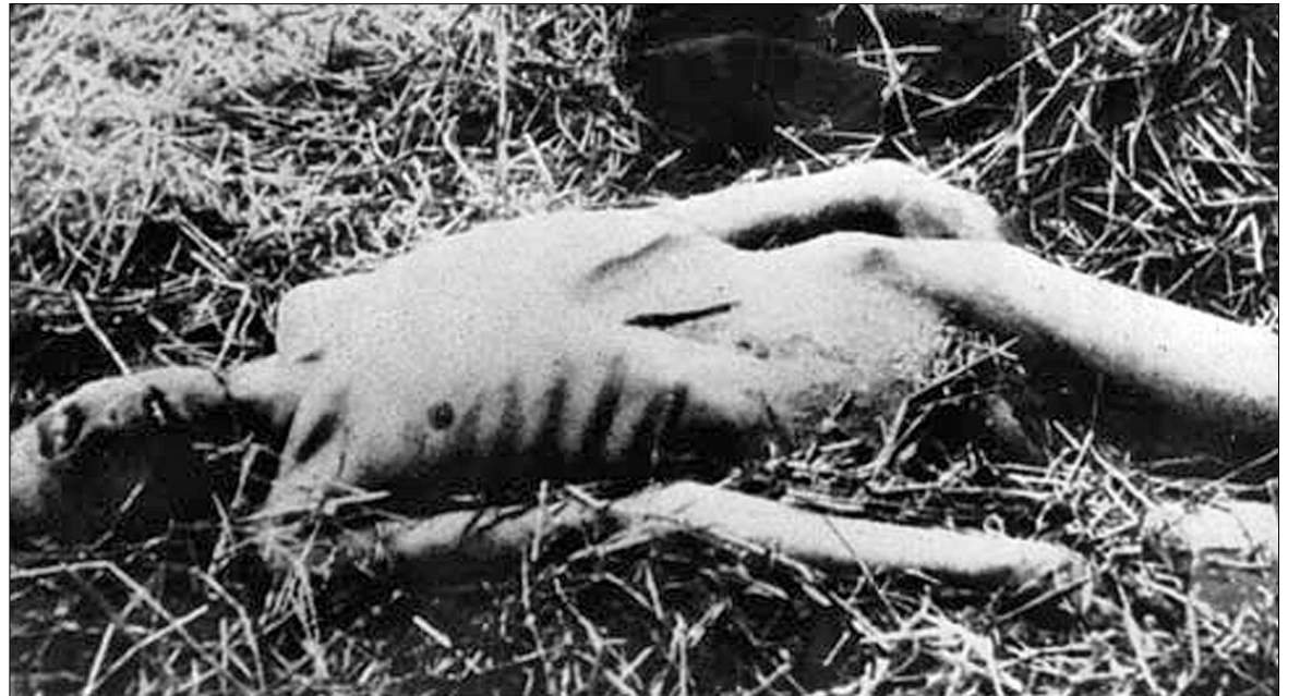
Трупи не ховали, бо не було кому