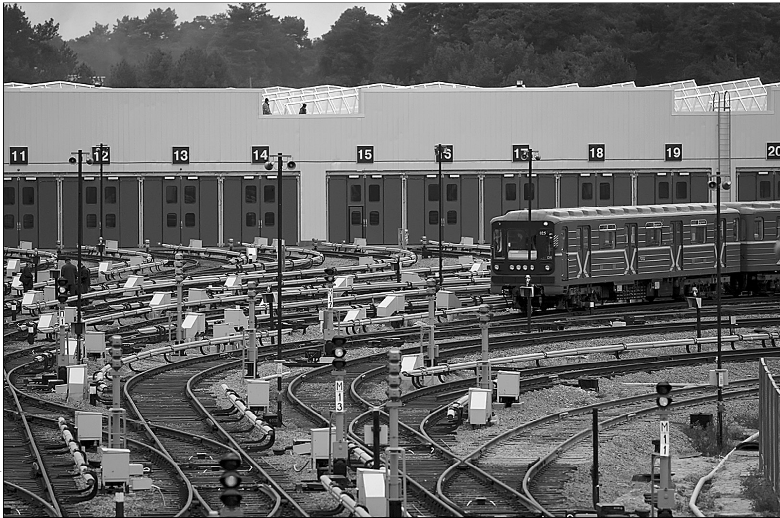
Тепер нове депо “Червоний хутір” в змозі одночасно приймати 200 вагонів метро