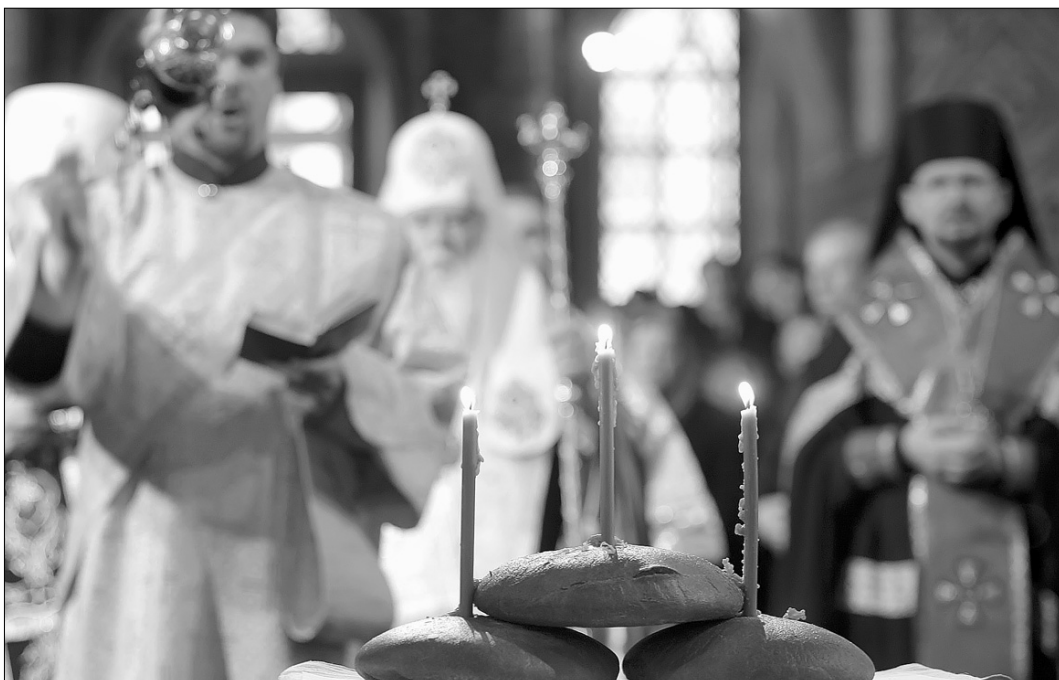
Панахида по померлих від голоду 1932—1933 років

Практичні лекції провели Урядовий уповноважений у справах Європейського суду з прав людини Юрій Зайцев, суддя Вишого адміністративного суду України Василь Співак, завідувач кафедри політичної аналітики і прогнозування НАДУ при Президентові України Сергій Телешун та керівництво юридичного апарату КМДА. Як результат, подальше вдосконалення функціонування державних органів перш за все через систему підвищення кваліфікації їхніх працівників сприятиме поглибленню знань із питань державного будівництва, державного управління, діяльності органів державної влади та місцевого самоврядування, соціально-гуманітарних, політико-правових, економічних та спеціальних фахових знань і вмінь із досвідної роботи державного управління ●