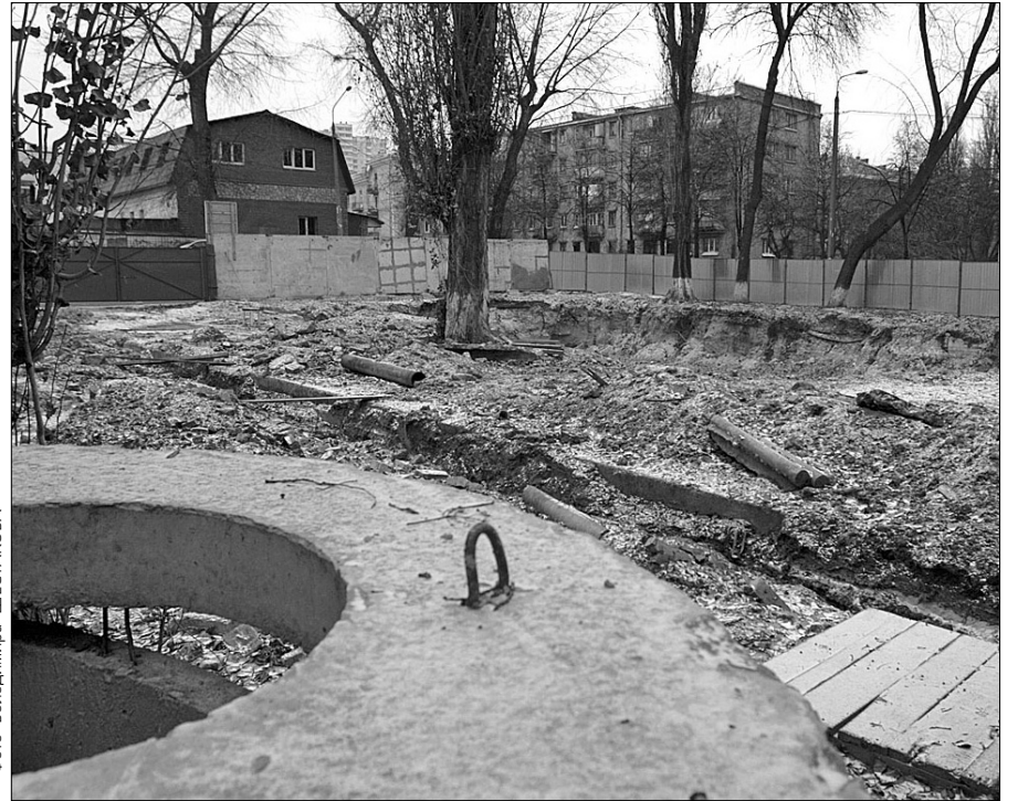
Ось такий безлад відкривається з вікна мешканців вул. Попова

"Будинок на вул. Попова, 5 передано в експлуатацію 1990 року. Колись на його місці була невеличка річка, яку через труби пустили в підземне русло, отож територія була непридатна для бу-