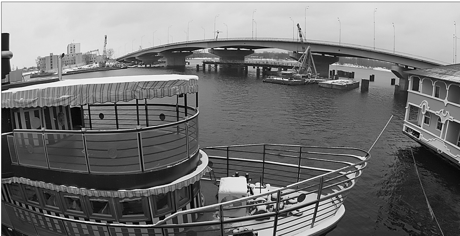
Завдяки новому мосту через Гавань водії зможуть скоротити свій шлях на 4 км з Подолу на Оболонь

На три роки раніше від запланованого в столиці відкрили міст через гавань з вул. Набережно-Хрещатицька. Відтепер шлях з Подолу на Оболонь скоротиться на 4 км. Щоправда, рухатися