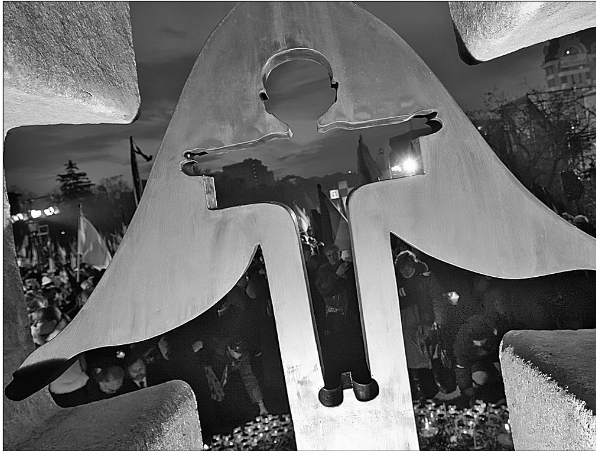
Пам'ятник жертвам голодомору в Києві

Нині в Україні готується "Книга пам'яті українського народу", де буде вміщено списки всіх загиблих і постраждалих від голодомору в УРСР. Згідно з Законом України № 376-V "Про голодомор 1932–1933 років в Україні" та розпорядженням Київського міського голови Леоніда Черновецького від 8 листопада 2007 р. за № 601 "Про стан підготовки заходів у зв'язку з 75-ми роковинами голодомору 1932–1933 років в Україні", у Державному архіві Києва створено робочу групу для виявлення архівних документів про голодомор.