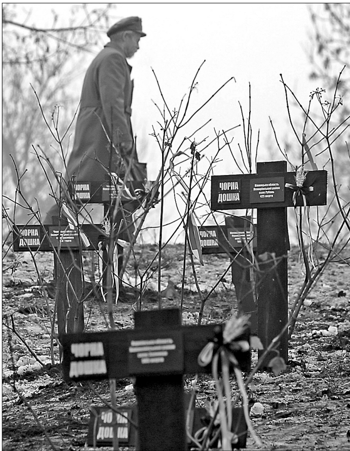
Меморіал жертвам голодомору "Калиновий гай"

Протоколом № 78 Президії Київради від 7 лютого 1932 року видано постанову "Про витрачання хліба в місті", який суворо регламентує постачання і витрату хліба в Києві, осо-