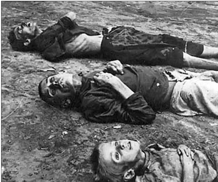
На початку весни вимирали цілими родинами

У Києві вже 1931 року введено суворі норми видачі хліба киянам — робітникам великих заводів і установ, зокрема, "Червонопрапорного", "Більшовика", "Ленкузні", "Червоного плугатаря", ім. Артема, фізико-механіки, КРЕС, ЦЕС, "Київодягу", фабрики взуття, трикотажної фабрики, меблевої ім. Боженка, цвяхзаводу, ім. Лепсе, Дарницького м'ясокомбінату, штамповочної шкіряників, ФЗУ шкіряників, ім. Домбала, палітурної фабрики "Жовтень", ВУАН, деяких будівельних організацій і друкарень, працівникам міліції, воєнізованої охорони, залізничникам, водникам. Видавали щодня 800 г хліба на особу та 300 г — на кожного