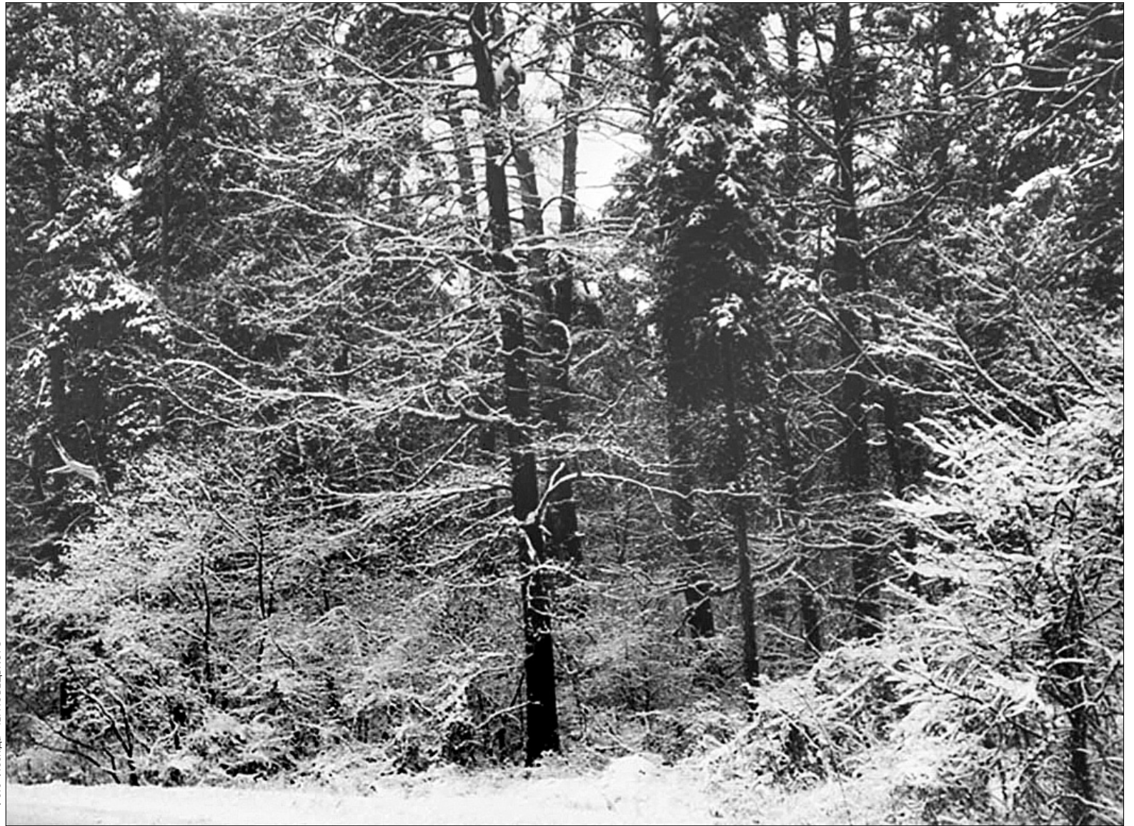
Фотографії виставки "Рівновага" кияни можуть подивитися в галереї "Лавра" до 20 грудня