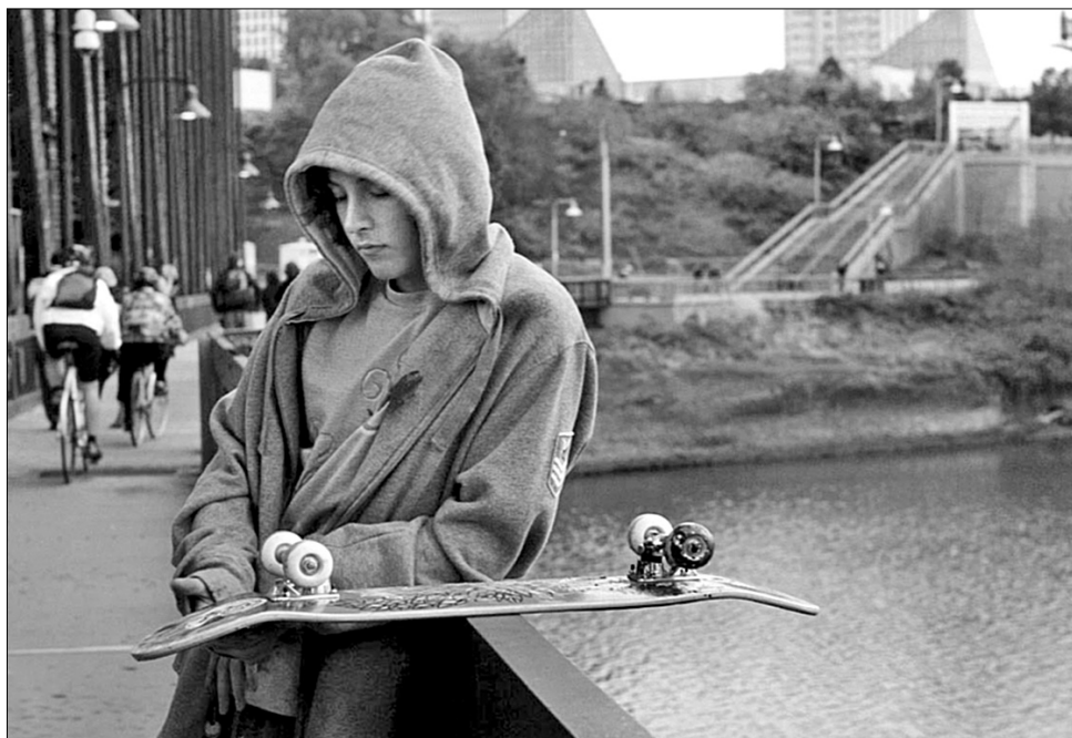
Операторська камера у “Параноїд-парку” перебуває в інтимних стосунках з акторами

Післязавтра на українські екрани виходить детективна драма Гаса Ван Сента “Параноїд-парк”. Напередодні прем’єри “Хрещатик” спробував з’ясувати, навіщо майбутнім глядачам стрічки перейматися тінейджерськими проблемами.