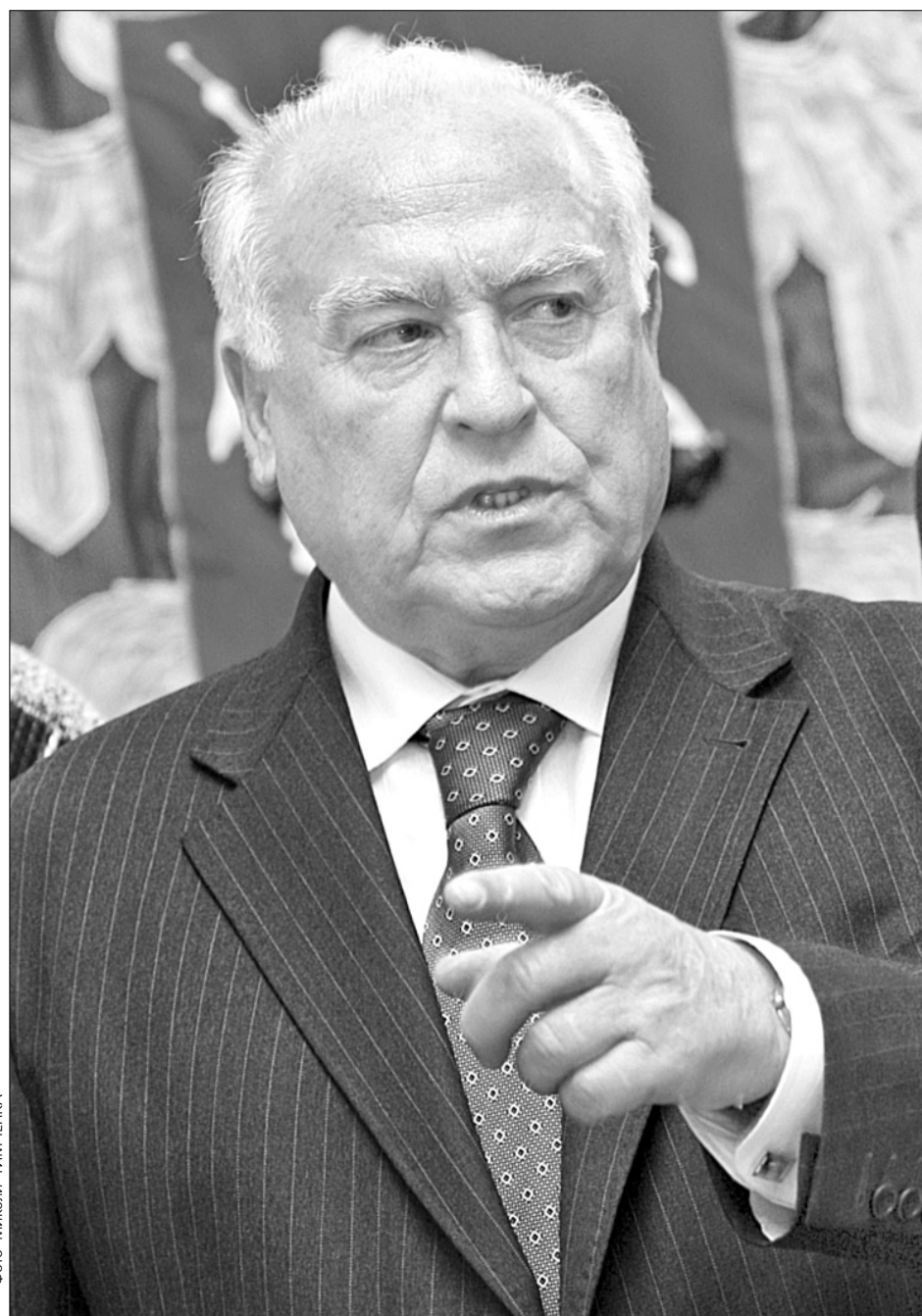
Посол РФ в Україні Віктор Черномирдін знає, якими будуть результати виборів до Держдуми

Опозиційні праві сили — СПС, "Яблуко" та інші — Кремль повністю деморалізував. Їхній рейтинг нині становить не більше 1%—2%. Щоб змінити стан речей, опозиціонери минулого тижня вдалися до