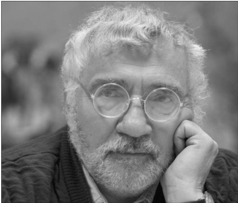
Вадим СКУРАТИВСЬКИЙ спеціально для "Хрещатика"

Якби ООН спало на думку облаштувати портретну галерею найсильніших інтелектуалів людства і його навічних благодійників, далеко не останнє місце в тій галереї посів би швейцарець Фердинанд де Соссюр. Подивіться на свій комп'ютер, на свій ноутбук — вони блимають, серед іншого, іскоркою геніальності цієї людини. Колись відомий лише фахівцем професор Женевського університету, котрий за життя так і не зважився видрукувати основоположну свою доктрину окремою книгою, сьогодні присутній, хай невиразно, чи не у кожному жесті сучасної цивілізації. Мовознавець — і комп'ютер? Людина, що народилася рівно 150 років тому, й сучасна цивілізація? Повірте, саме так.