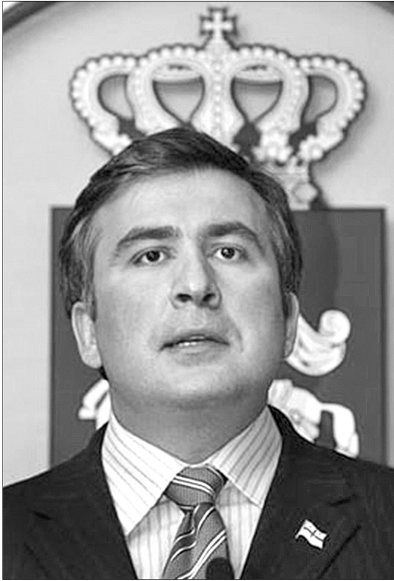
Михаїл Саакашвілі впевнений, що його правління в Грузії не закінчиться одним президентським терміном

У суботу президент Грузії Михайл Саакашвілі подав у відставку, передавши владу в країні спікеру парламенту Ніно Бурджанадзе. Пані Бурджанадзе до тепер була на других ролях, задовольняючись роллю "другої людини" в державі. Хоча саме вона відіграла величезну роль у перемозі "революції троянд" 2003 року. Відтоді революційний запал соратників значно зменшився. Весь цей час пан Саакашвілі замість обіцяних реформ брязкав зброєю, намагаючись повернути Абхазію та Південну Осетію, й шукав приводу для сварок з Росією. Врешті-решт, розваливши економіку, влада мусила вдатися до репресій, щоб придушити виступи невдоволених. Чимало опозиційних політиків заарештовано. Проте це не запобігло масовим акціям протесту в столиці. Щоб уникнути громадянської війни, влада згодилася на дострокові вибори президента, які мають відбутися 5 січня 2008 року. Згідно із законом, президент не може брати участі в передвибор-