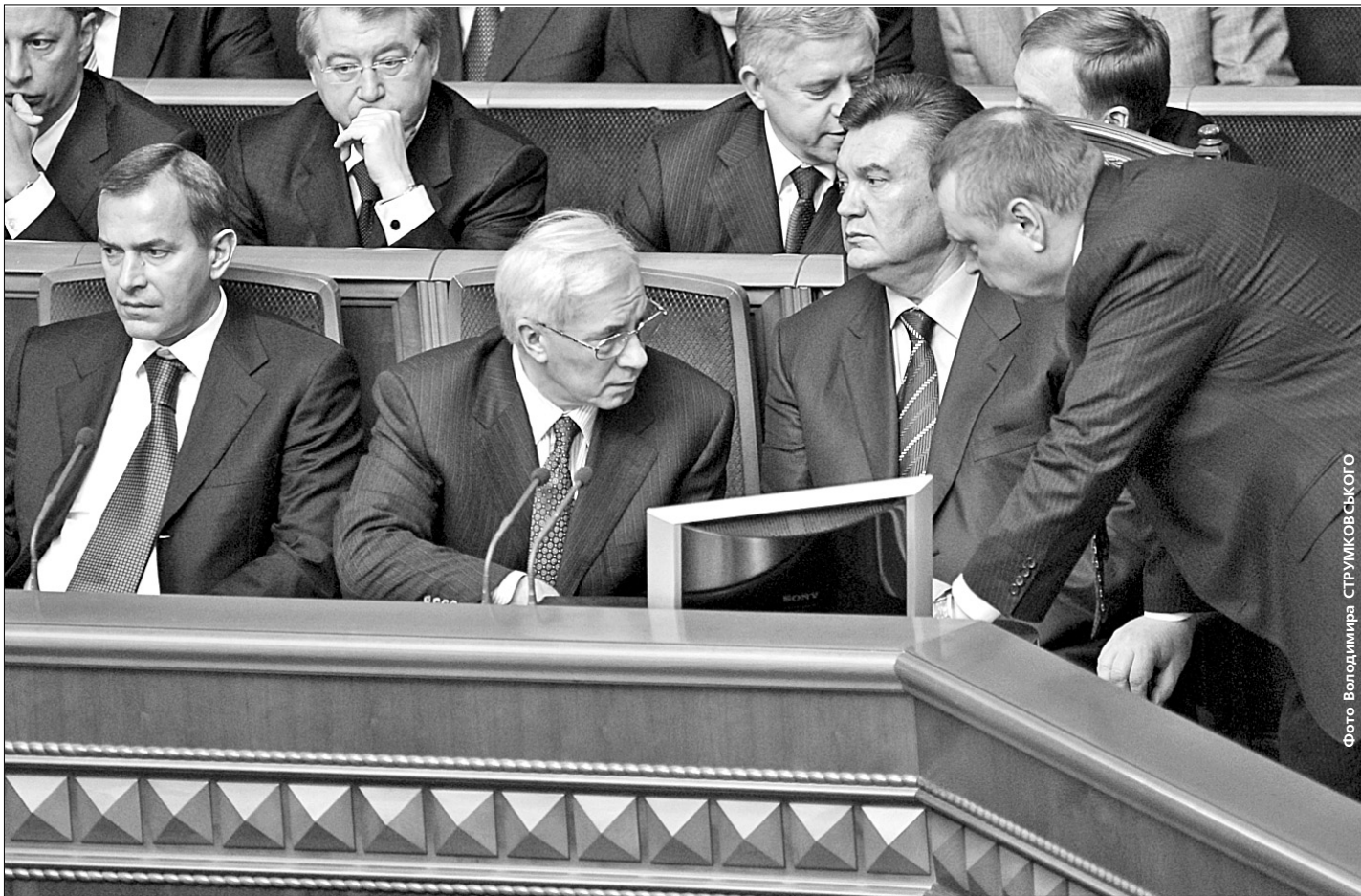
Віктор Янукович не поспішає залишати урядову лужу

Лідери НУ—НС хочуть у вівторок "додавити" своїх депутатів, які не підписали коаліційної угоди