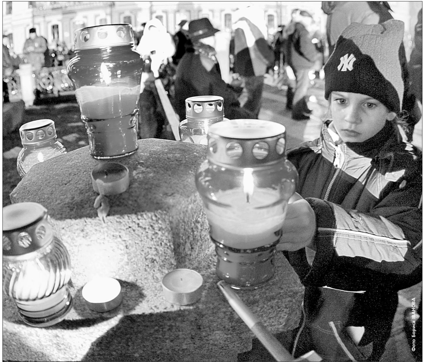
У пам'ять про загиблих 75 років тому запалили кілька сотень свічок