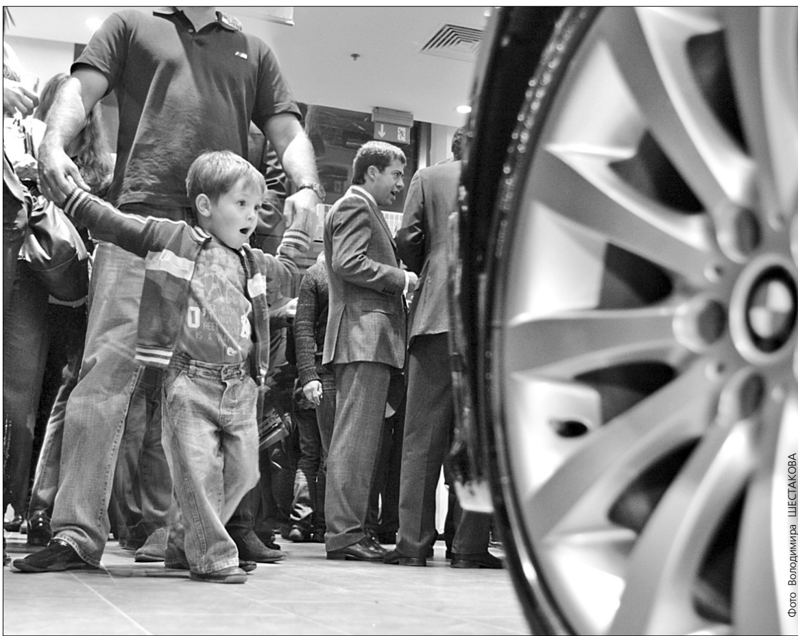
Дітей вразили машини, а дорослих — гарний фуршет