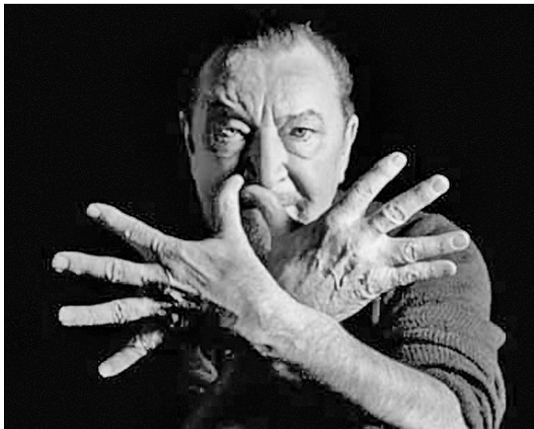
Естетичних заборон для майстра не існувало

Учора в Парижі пішов з життя великий реформатор балету хореограф Моріс Бежар. Киянам пощастило побачити фундатора знаменитого Bejart Ballet Lausanne вісім років тому, коли балетмейстер разом зі своєю трупю гастролював в Україні.