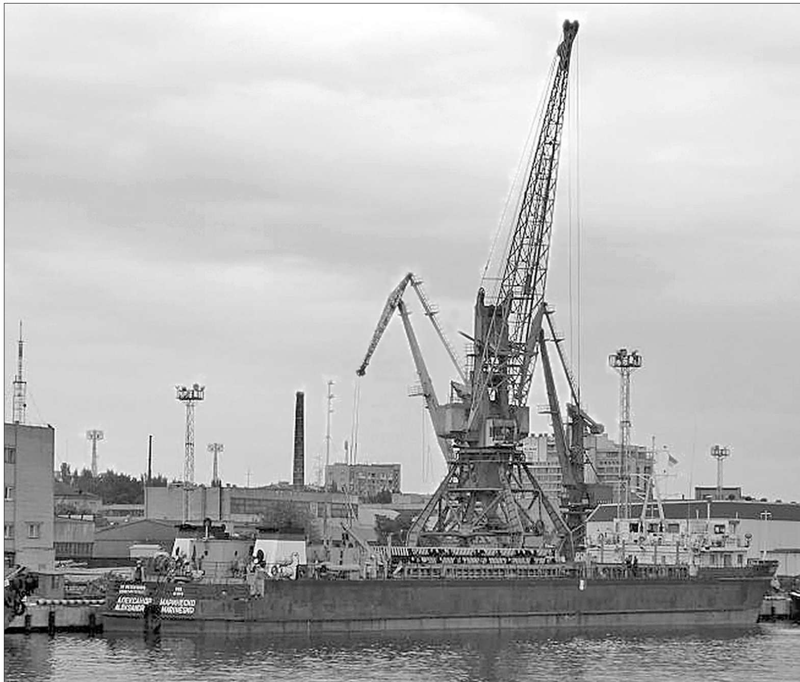
Херсонський порт збільшив обсяг перевезень вантажів на 73 % у порівнянні з минулим роком

Понад 60 тис. грн отримав бюджет Полтави в результаті рейдів міських правоохоронців, що перевіряли малі підприємства, які займаються торгівлею алкогольними виробами, та перевіряли інформацію щодо продажу цієї продукції неповнолітнім. За результатами рейдів, що відбулися на минулому тижні, складено 75 адміністративних протоколів за продаж алкогольних напоїв та цигарок неповнолітнім та притягнуто до адміністративної відповідальності 5468 правопорушників за розпивання спиртних напоїв у громадських місцях та майже 11 тис. осіб — за появу в нетве-