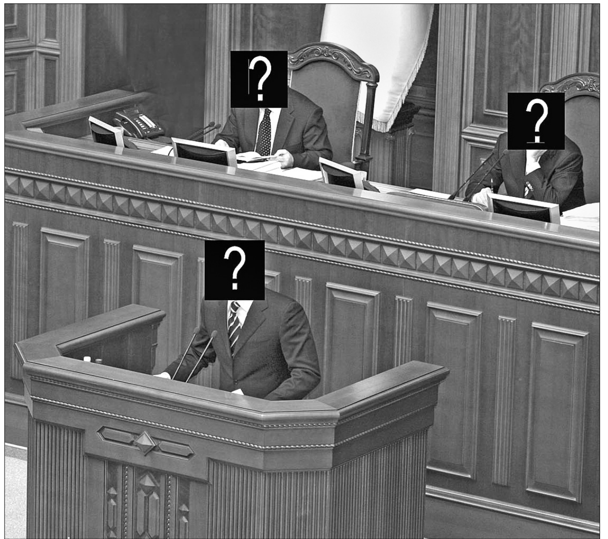
Задача з трьома невідомими