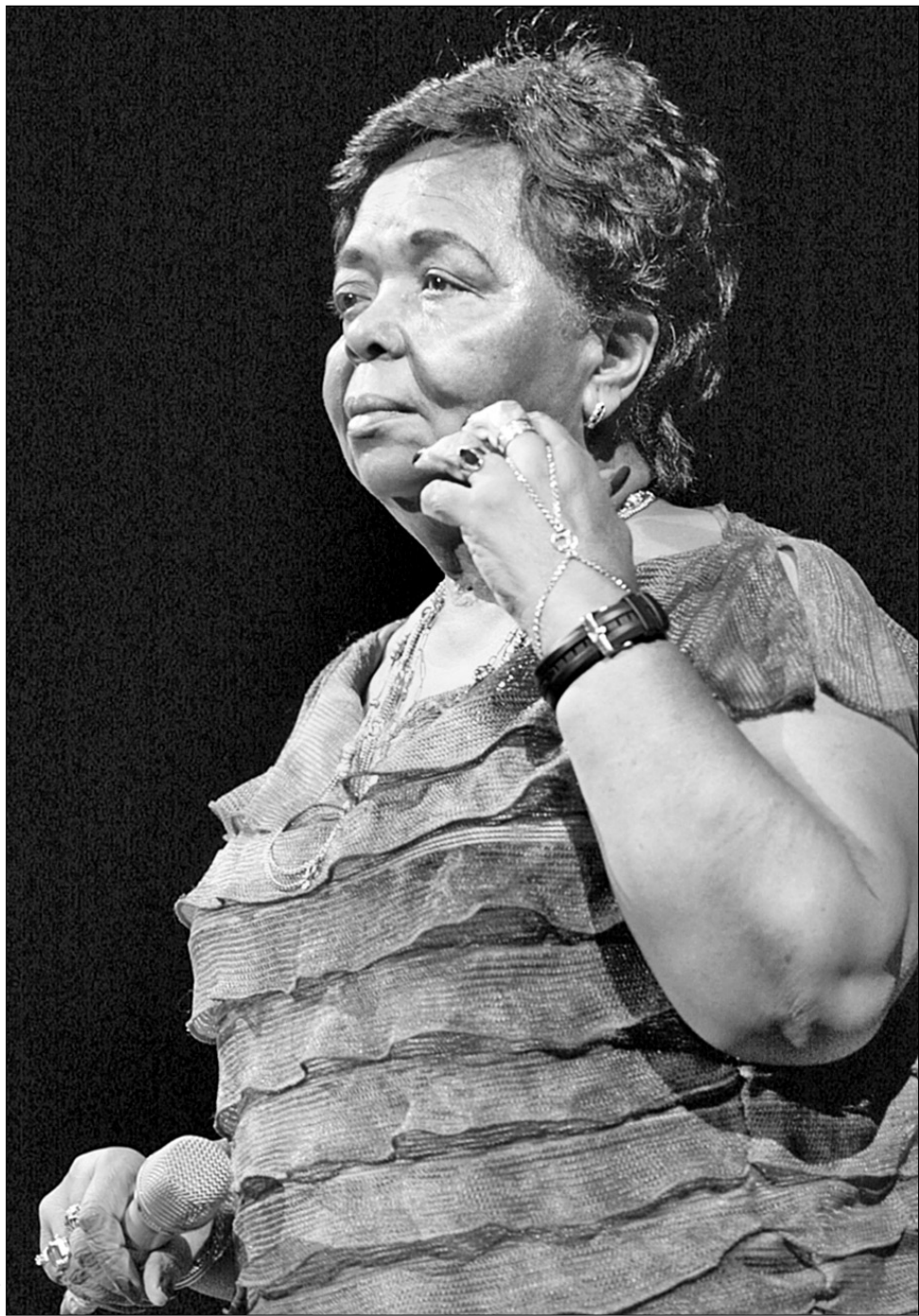
Сезарія Евора у співчутті чужим бідам вміє бути так само щирою, як і слова її пісень

Сама ж Сезарія, зробивши коротку паузу на перекур просто на сцені, так само природно продовжувала сповідуватися залові в своїх кабовердійських бідах. Публіка зривалася оплесками, впізнаючи улюблені "Міс Перфумадю", "Саудаджи", "Африка". Найулюбленішу — Besame mucho , котру Сезарія Евора співає як ніхто, — кияни почули вже в останні хвилини концерту. Разом із обіцянками приїхати в Україну ще раз ●