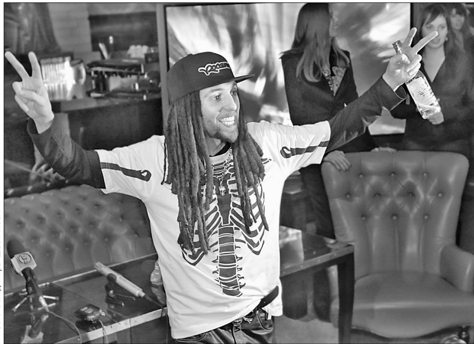
Наразі Дизель не стільки грає, скільки заробляє гроші

Уже традиційно для "сіро-зелених" пісня записана англійською та російською мовами одночасно, авторами англійської версії є самі вокалісти Sister Siren, а російської — Мурік та Дизель. На створен-