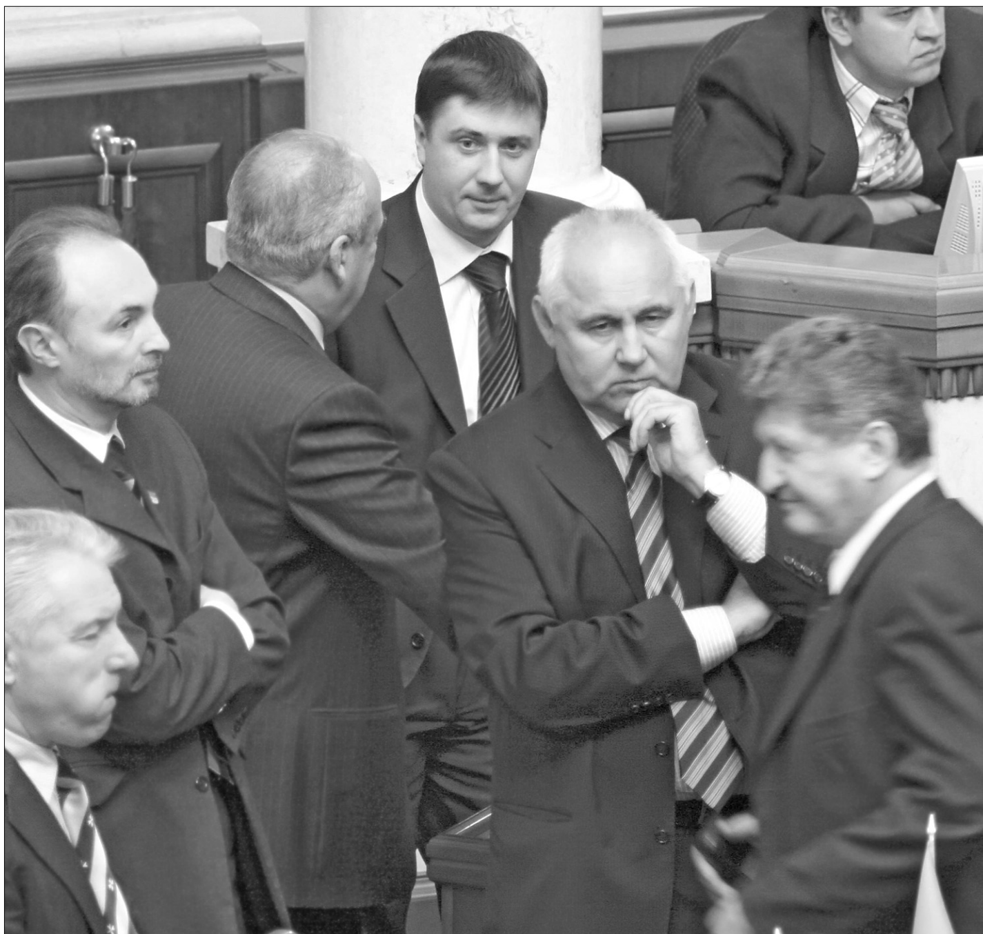
Депутати ще подумують, як голосувати