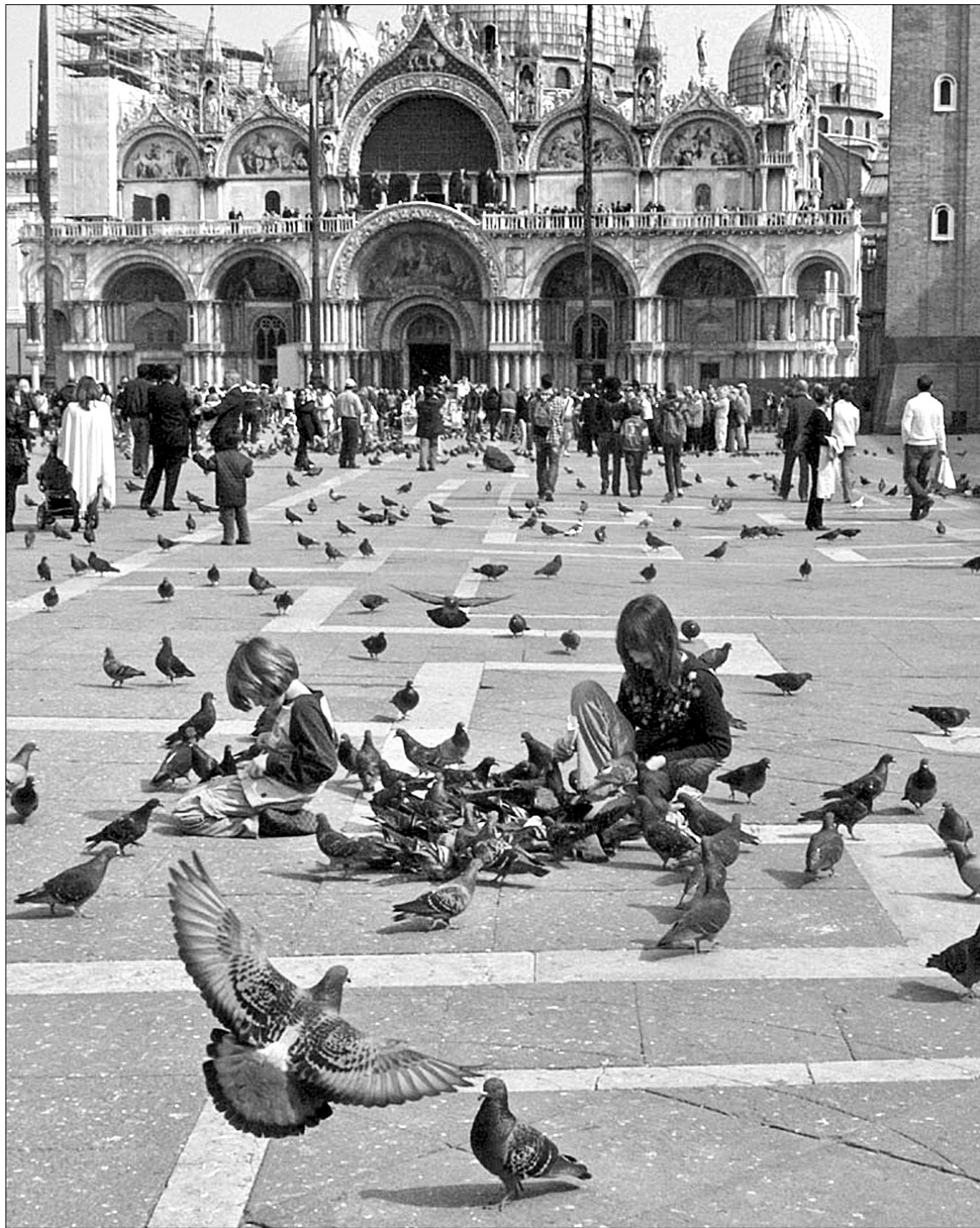
Нью-Йорк — не перше місто, в якому вирішили боротися із засиллям голубів. У Венеції закон про заборону годівлі птахів набуде чинності навесні наступного року

Нью-Йорк — не перше місто, у якому хочуть заборонити годів-