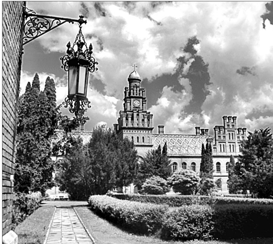
Університет ім. Федьковича — перлина Чернівців

Нині над ратушею майорить синьожовтий прапор, а фасад прикрашає герб міста. Втім, найбільше уваги привертає 50-метрова вежа, на балкончик якої щодня о 12 годині виходить сурмач у на-