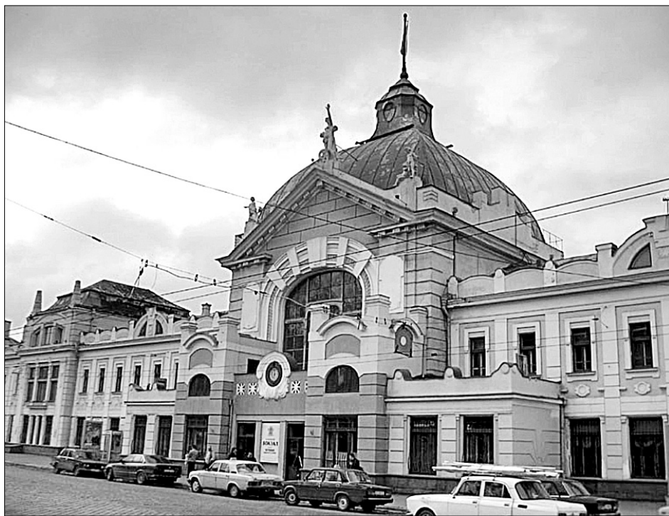
Чернівецька залізниця (1866 р.) на 4 роки старша за київську

Натхнення, яке подарував мені Ганг, було таким сильним, що, повернувшись до Києва, я замкнулася у будинку за містом і за п'ять днів написала книжку "В обіймах Гангу" ●