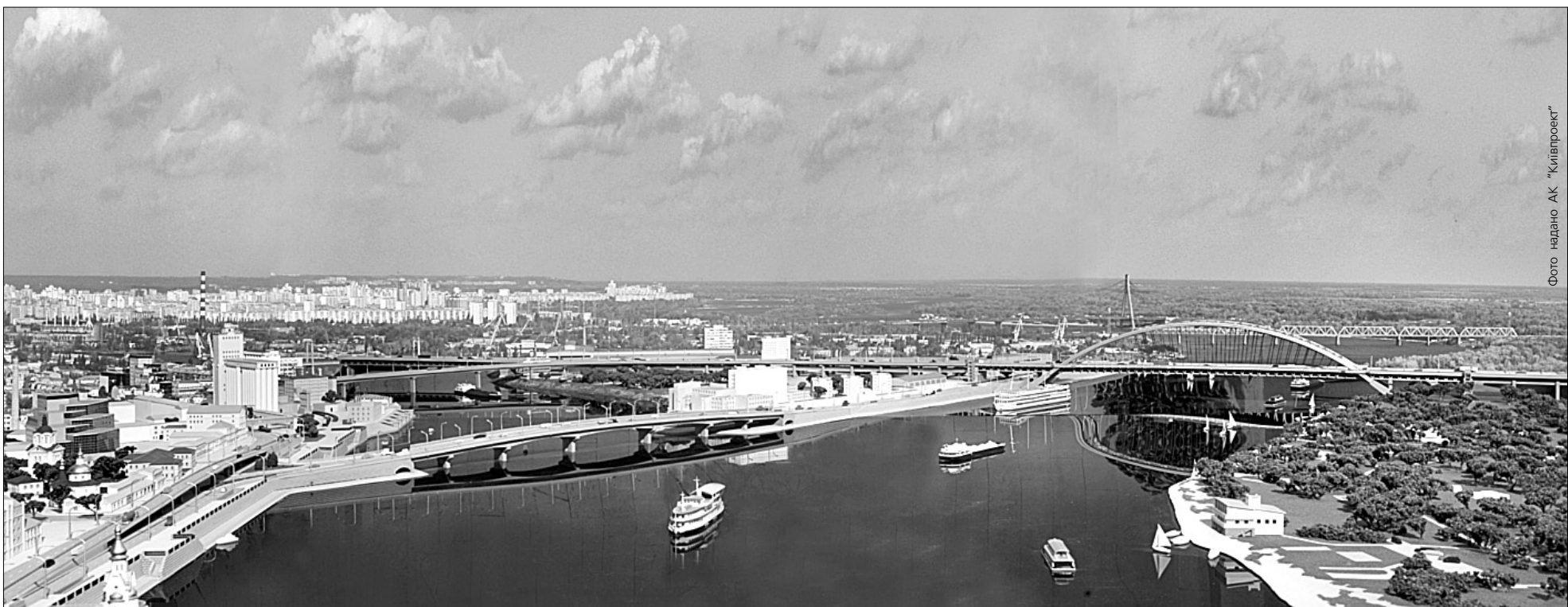
Фахівці "Київпроєкту" причетні до розроблення проекту Подільсько-Воскресенського мостового переходу