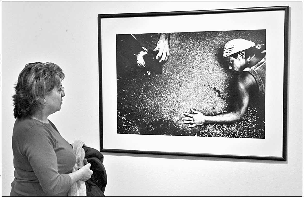
Шлях до святого Лазаря на Кубі долають у багнюці й пилу

Тридцять кілометрів від Гавани до храму в Сантьяго де ля Вега найбільшим грішникам належить пройти пішки. Бажано без