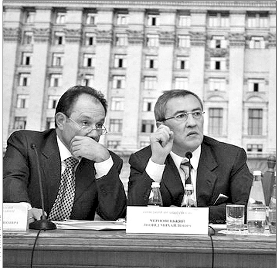
Нереагування на скарги мешканців Святошинського району змусило міську владу подумати про перепідпорядкування ЖЕКів місту

"Якби ЖЕКи підпорядковувалися місту, а не району, то їхні начальники могли б нікого не боятися, напряму звертатися до нашого Головного управління і отримувати все, що потрібно", — сказав Леонід Черновецький. А втім, поки що така централізація — лише ідея. Натомість від наступного року, за словами першого заступника голови КМДА Анатолія Голубченка, на базі ЖЕКів у районах буде єдиний замовник, котрий на конкурсній основі визначатиме, хто і на яких умовах надаватиме ту чи ту послугу. Таким чином комунальне господарство Києва практично вийде на ринкові умови, де буде взаємна відповідальність замовника і надавача, а крім того, підвищення якості послуг через конкуренцію.