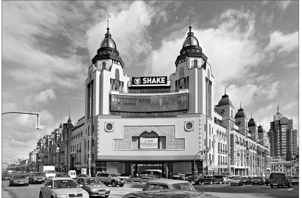
Серед найзначущих об'єктів "Київпроекту" — реконструйований Бессарабський квартал

ціональний", універмаг "Україна", реконструйовано Бессарабський квартал, Севастопольську площу, Водно-інформаційний центр тощо. Окрім цього, зведено торговельні центри в центральній частині міста та на житлових масивах загальною площею майже 300 тис. кв. м. 17 об'єктів. Розробки київпроектівців відзначено Державними преміями різних рівнів. Серед них — три Генеральні плани, Палац піонерів і школярів, площа Жовтневої революції, термінал "Південний" Центрального залізничного вокзалу, реконструкція площі Льва Толстого та станція метро "Золоті ворота", гуманізація середовища житлового масиву Оболонь. Важливим етапом діяльності "Київпроекту" є участь у відтворенні та реконструкції святинь, зокрема Успенського собору Києво-Печерської лаври та Михайлівського золотоверхого собору. Окрім цього, за розробками фахівців компанії побудовано храм Святої Трійці на житловому масиві Троєщина-Вигурівщина. За багаторічну плідну працю колектив "Київпроекту" удостоєно орденом "За трудові досягнення" IV ступеня, відзначено міжнародним призом "Європейська якість", премією Національної спілки архітекторів України "Валюта" за видатні заслуги в розбудові Києва. До слова, якість проектних робіт підтверджено міжнародним сертифікатом якості ISO-9001.