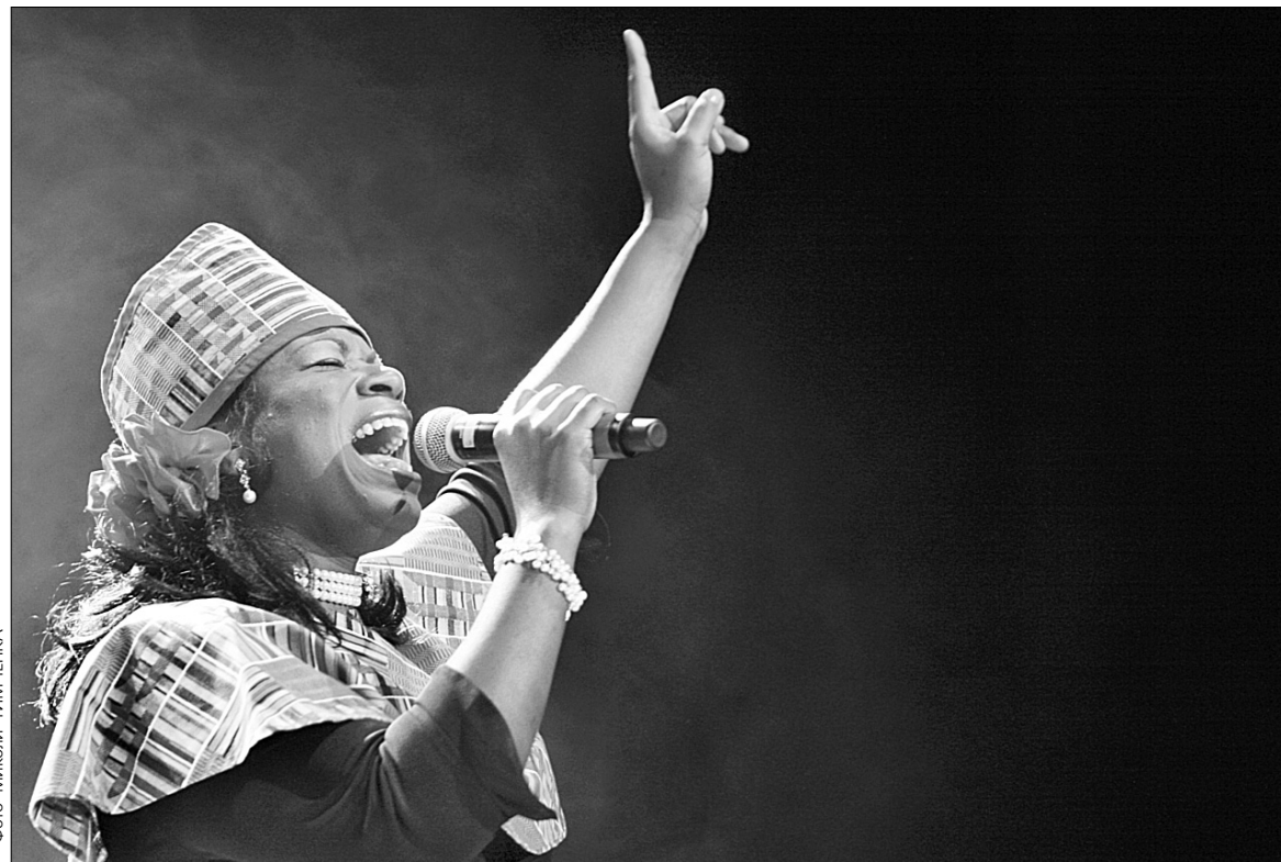
Слухачам концерту від Гарлем Госпел хору перепала чимала частина сестринської любові

Однією з перших пролунала пісня I Wish I Could Fly, яку ще у 1960-ті співав R. Kelly. Утім, невдовзі спокійні мотиви змінили веселі мелодії, характерніші для амплуа колективу. Бадьорість та енергійність дійства музиканти вирішили підкріпити заздалегідь підготованими танцями на місці, котрі дуже сильно нагадували рухи, яких досвідчені худож-