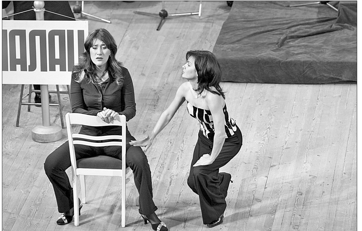
Постановники опери представили історію цілком земних Дідон та Енеїв

Звісно, Києву показали не тих недосяжних міфологічних легендарних богів, про котрих писав колись Вергілій, а представили історію нещасливого кохання сучасних і цілком земних Дідон та Енеїв зі всіма їхніми недоброчин-