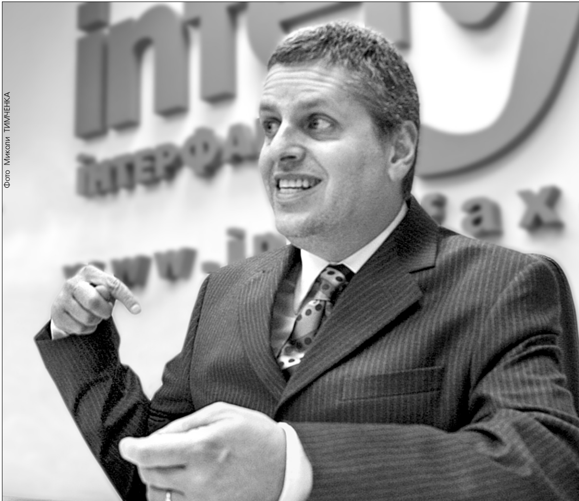
Сценарист мультфільмів "Мадагаскар" і "Лісова братія" Біллі Фролік поки що не хоче розповідати про свою нову роботу

Автор "Мадагаскару" пише сценарій для українсько-американської стрічки