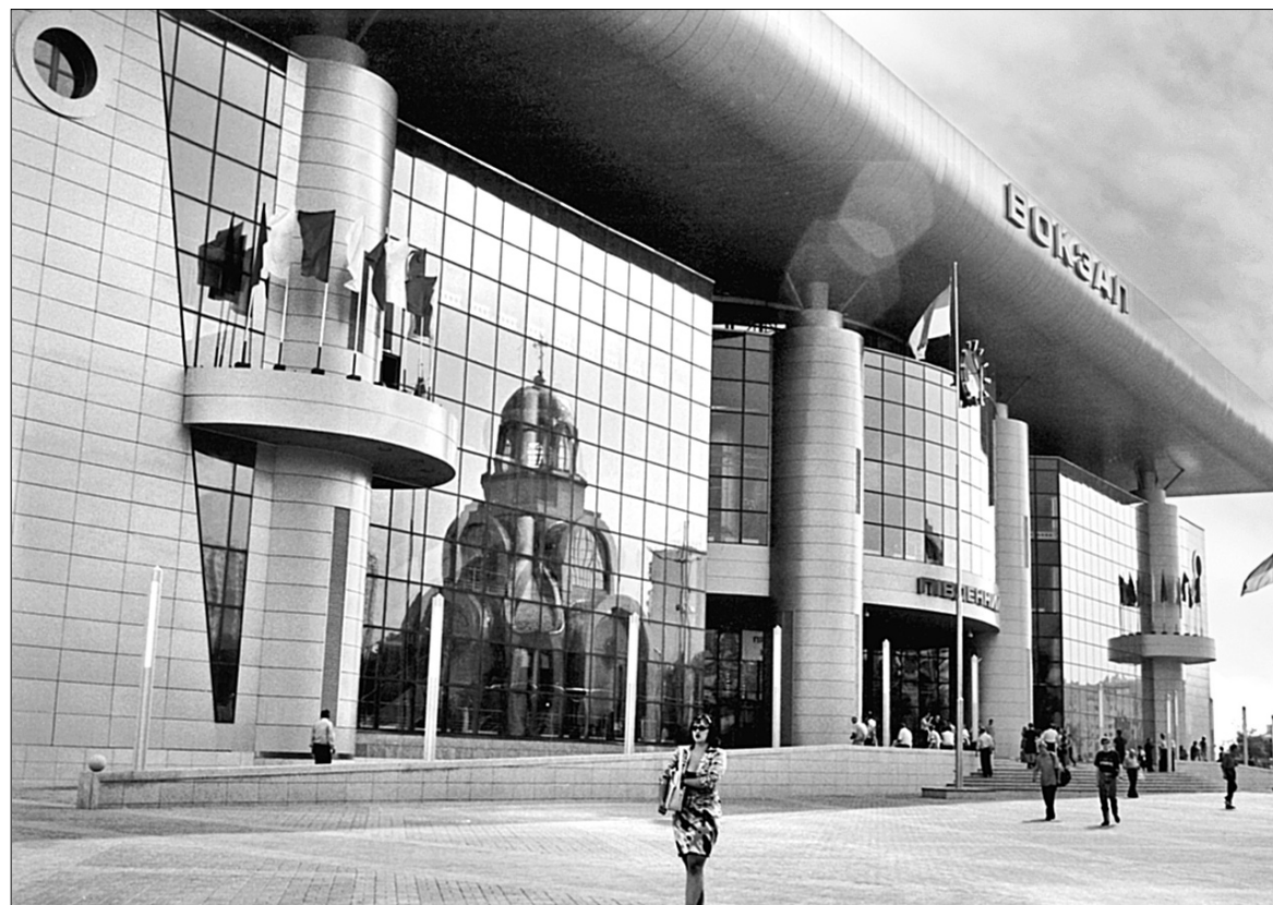
Проект Південного терміналу Центрального залізничного вокзалу відзначено багатьма нагородами

Велике, як мовиться, помічаєш на відстані: наше сьогоднішнє ми розуміємо тоді, коли воно стає "вчора", але й наше "завтра" формується "сьогодні". 70 років для людини — практично все його життя, а для організації — це час підбиття підсумків, розуміння того, що і як було зроблено. "Київпроект" створив місто, вулицю, площу, які є обличчям не тільки столиці, а й держави. Сьогодні можна сказати, що 70 років його служіння Києву були гідними ●